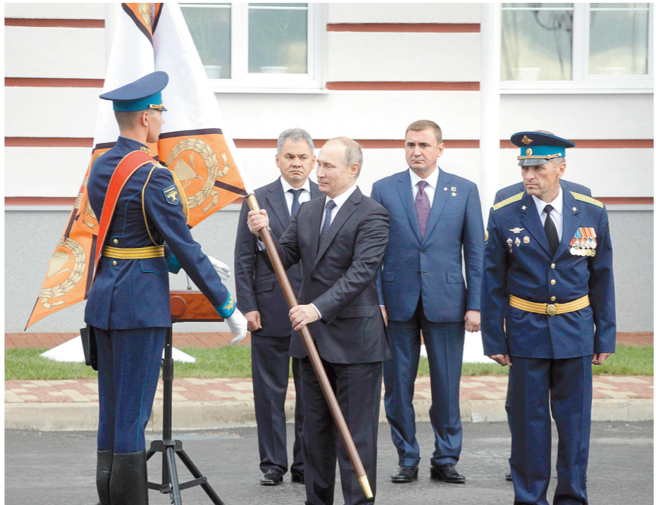
Глава государства передает знамя Тульскому СВУ