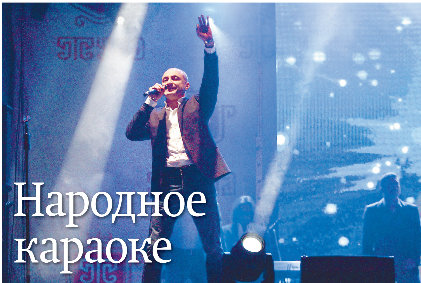
Михаил Турецкий: туляки – необыкновенные люди, творческие и трудолюбивые

– Я – человек, выросший в Советском Союзе, и, естественно, много путешествовал. Мне есть с чем сравнивать, есть что любить, чем дорожить. Это наша страна, Россия, здесь все – наше, родное... А поскольку Тула недалеко от Москвы, мы часто сюда приезжаем. Туляки – необыкновенные люди, творческие и трудолюбивые. Здесь много предприятий, в том числе оружейный завод, и ваш город я считаю южным форпостом России. Мы чтим историю, из книг знаем, что Тула никогда не была слана врагам и в Великую Отечественную войну встала на пути фашист-