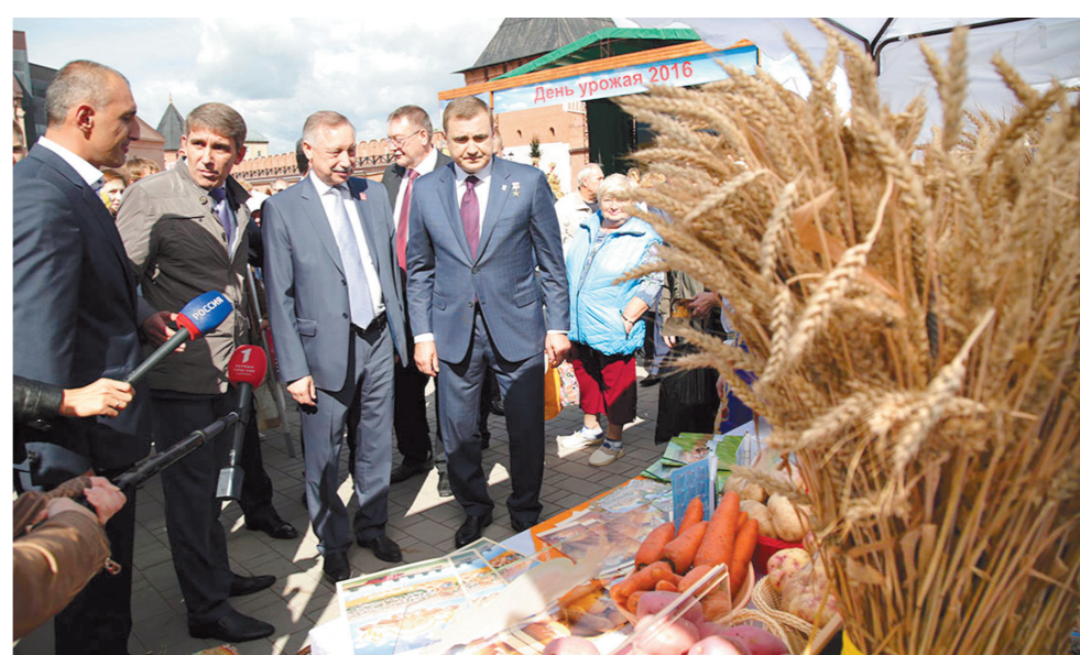
В Кремле работала выставка-ярмарка сельскохозяйственной продукции «Праздник урожая». Ее посетили полномочный представитель Президента РФ в ЦФО Александр Беглов и врио губернатора Тульской области Алексей Дюмин