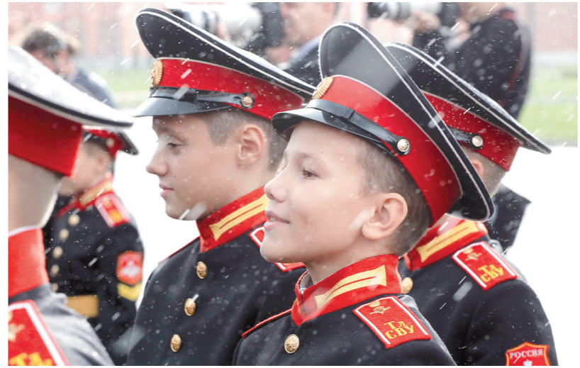
Для этих мальчишек, надевших погоны, приезд Президента РФ — весьма волнительный момент

В настоящее время в Тульском суворовском училище возведены два спальных корпуса на 160 мест, учебно-административный корпус с библиотекой, читальным залом и книгохранилищем на 35 тысяч еди-