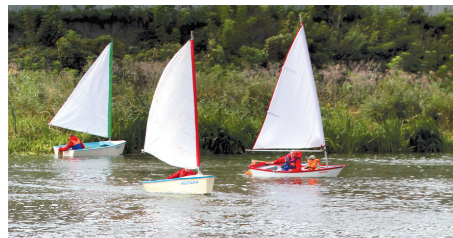
Участники праздника любовались настоящим парадом лодок. Все они – и моторные, и парусные – построены туляками