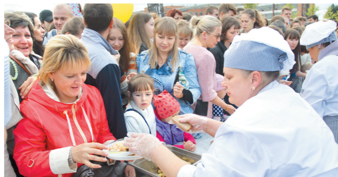
Желающие полакомиться картофелем выстроились в огромную очередь