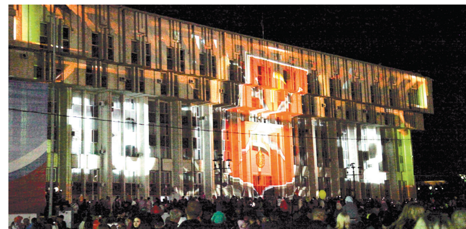
Завершился праздник ярким 3D Mapping-шоу – на здание регионального правительства проецировались картины, посвященные Туле. После этого жители и гости оружейной столицы увидели красочный фейерверк

Наши земляки умеют и трудиться, и радоваться – и это они еще раз доказали в минувшие выходные, когда в городе оружейников отметили сразу два праздника: День области и 870-летие Тулы. Программа торжеств получилась пестрой, и каждый в этом калейдоскопе нашел то, что ему по душе.