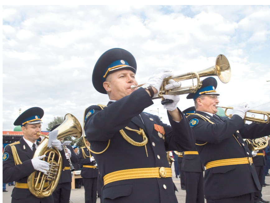
Впервые в Тульской области состоялся парад духовых оркестров