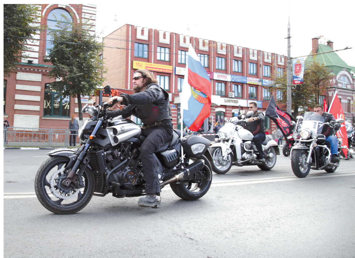
В честь 870-летия Тулы провели мотофлешмоб, который возглавил лидер движения байкеров «Ночные волки» Александр Залдостанов (Хирург)