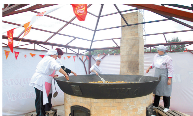
На набережной Упы установили гигантскую сковороду, на которой пожарили 500 килограммов картофеля