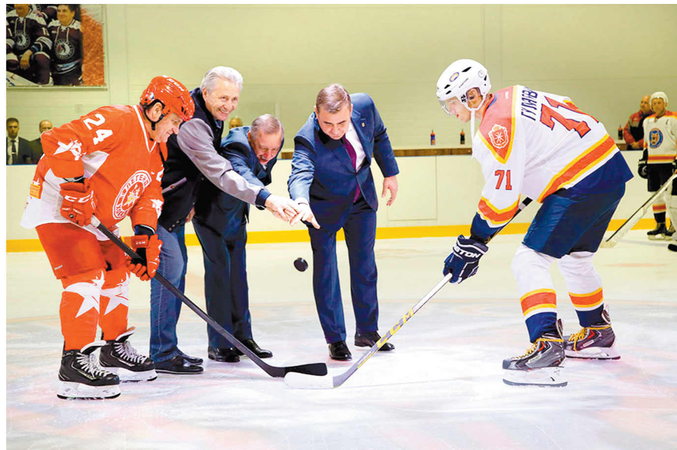
Первую годовщину отметила Ледовая арена «Тропик». В честь этого здесь состоялся гала-матч между одноименной тульской командой и звездами отечественного хоккея. Гости победили – 4:2