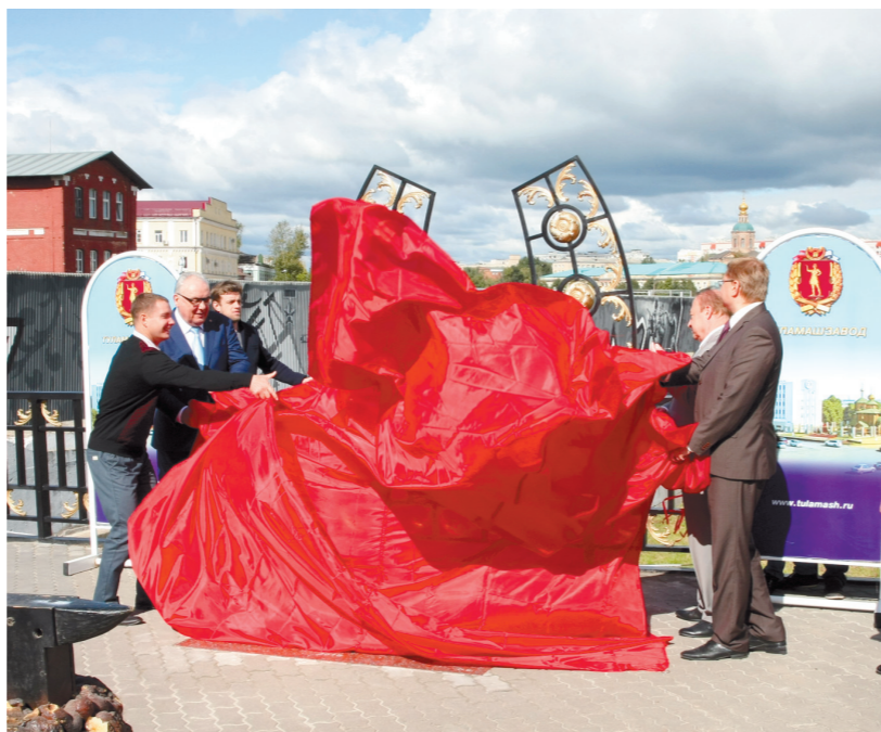
Алое полотнище, скрывавшее «Подкову счастья», как алый парус – символ исполнения мечты