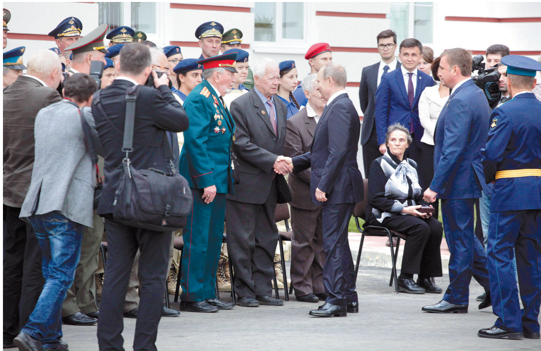
Владимир Путин после вручения звезды Героя России Анатолия Горшкова его дочери (на фото сидит справа от президента) пообщался с тульскими ветеранами