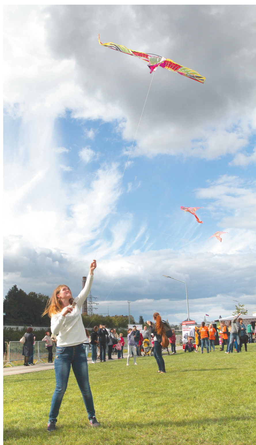
На фестивале воздушных змеев каждый мог сам изготовить и запустить бумажную рептилию