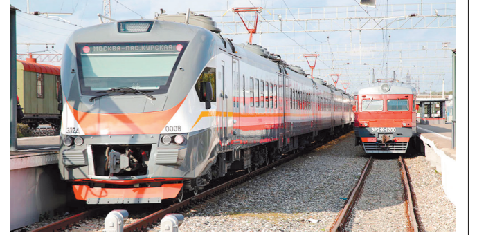
Такие поезда уже курсируют между Москвой и Тулой

Тулу с рабочим визитом посетил президент ОАО «Российские железные дороги» Олег Белозеров. Вместе с врио губернатора Алексеем Дюминым он осмотрел новый подвижной состав, следующий по маршруту Тула — Москва: кабину машиниста, вагон бизнес-класса, вагоны 1-го и 2-го класса, вагон с местами для маломобильных групп населения.