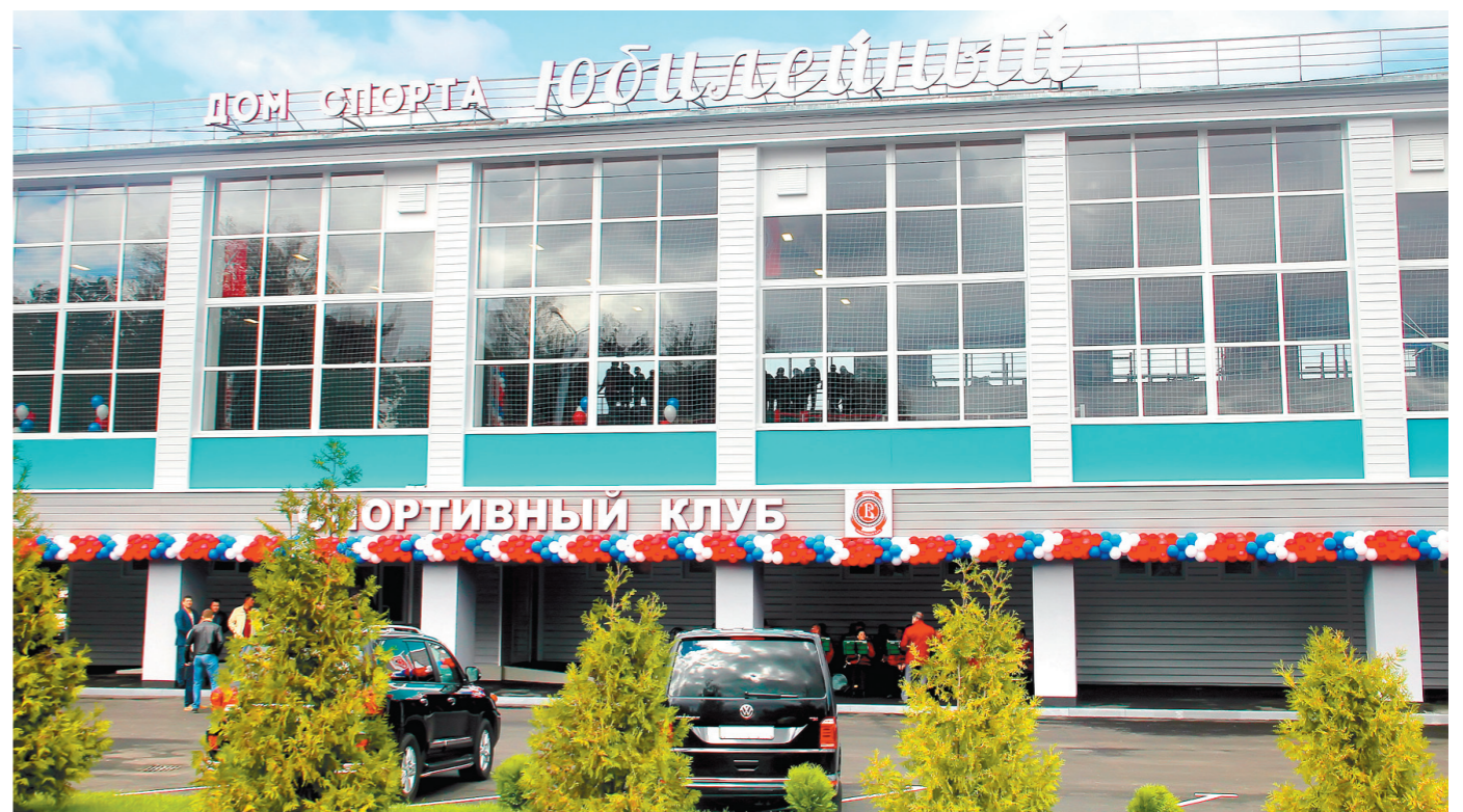
Дом спорта «Юбилейный» остается центром притяжения спорта