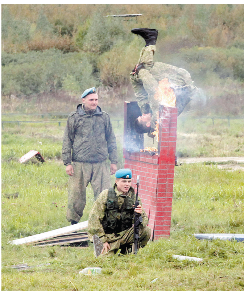
Тульские десантники продемонстрировали гостям боевое мастерство