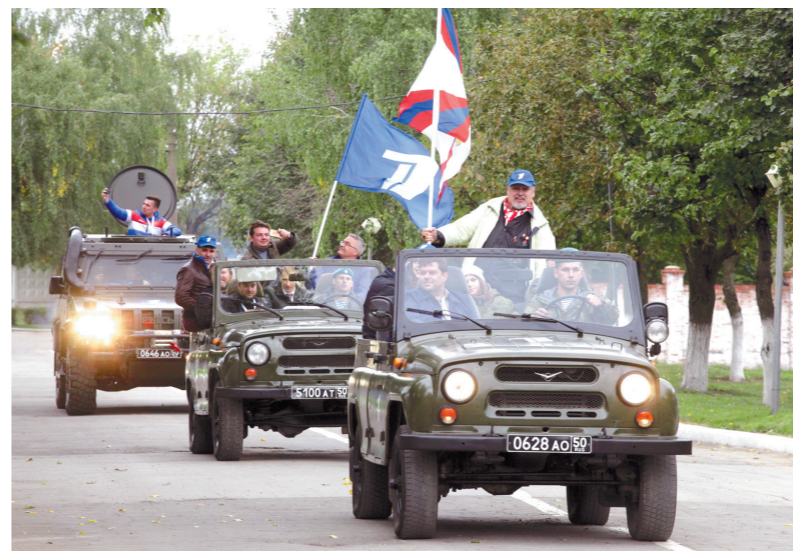
В распоряжении 51-го полка гости пересели из мягких автобусов в армейские вездеходы

– Знаете, мы, артисты, известны благодаря экрану. А настоящие звезды – они на небе, на груди героев и на офицерских погонах. И никак иначе.