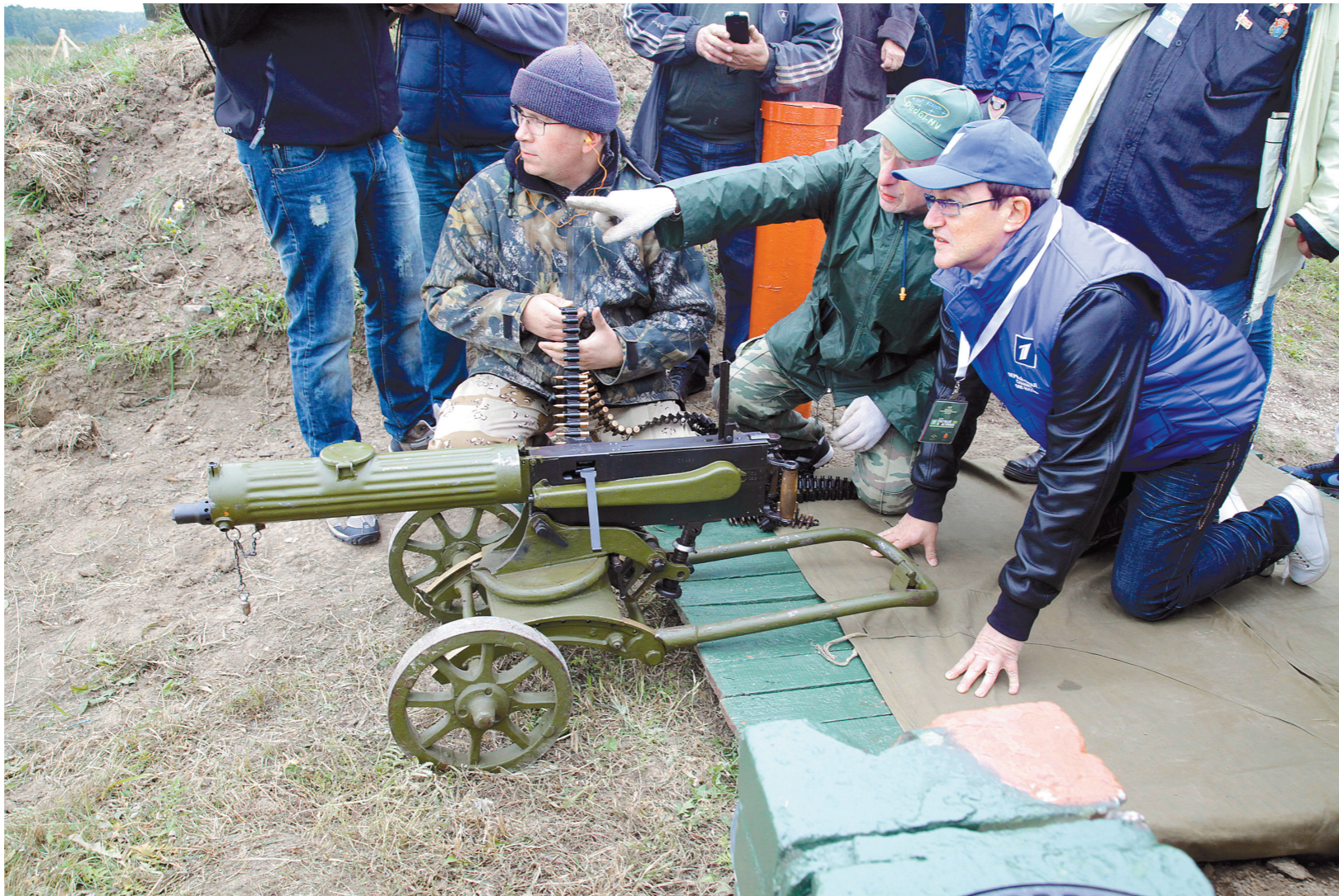
«Звонок другу» и «помощь зала» на стрельбище не предусмотрены