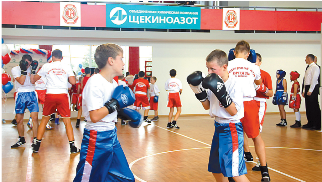
Более 300 боксеров будут заниматься в клубе «Витязь» бесплатно