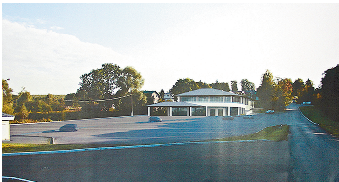
Центр приема посетителей хорошо впишется в ландшафт

чем они. Со строительством фондохранилища здесь также освободится немало «квадратов», которые получат наконец музейную функцию.