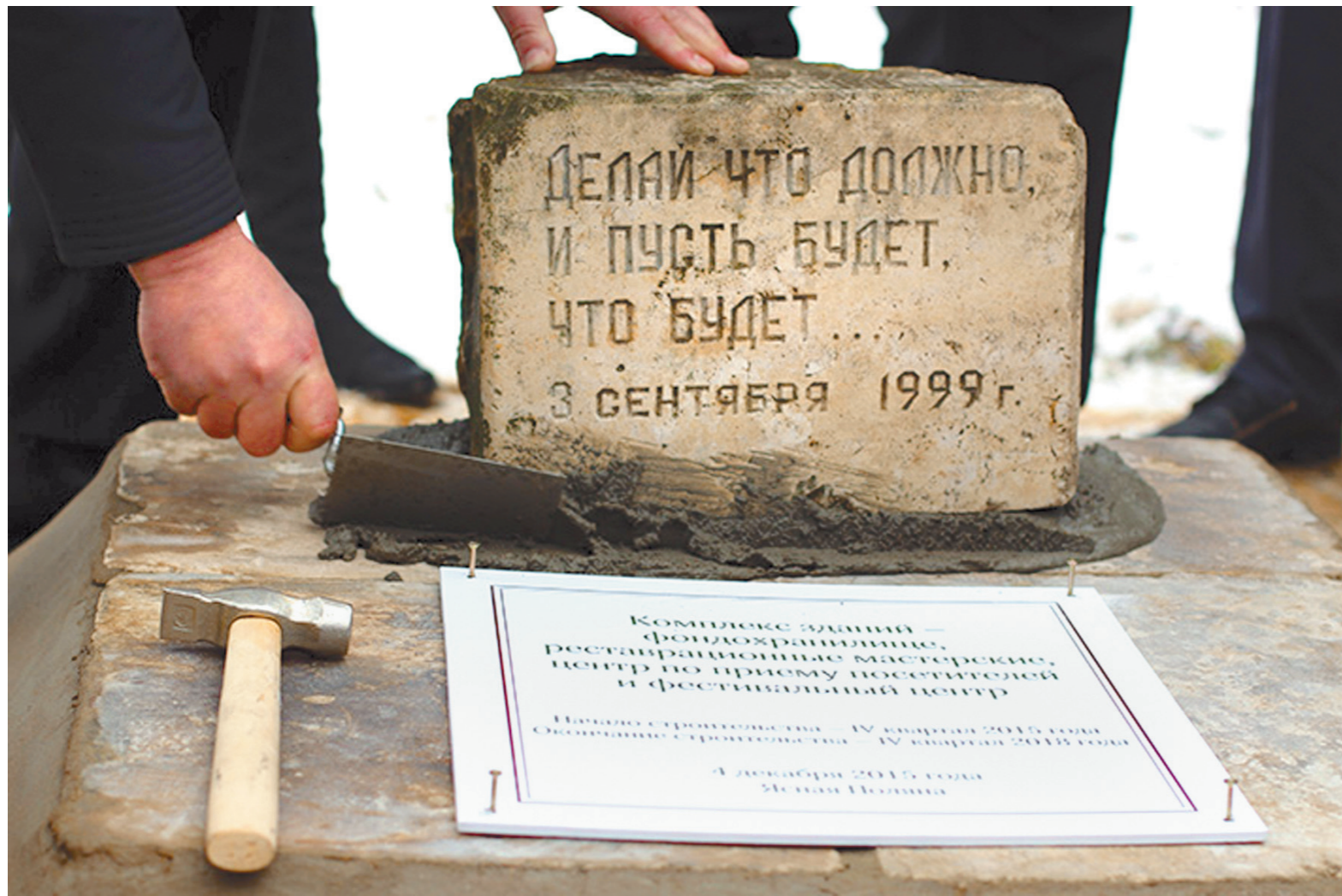
В декабре 2015-го в Ясной Поляне заложили камень в честь начала масштабного строительства