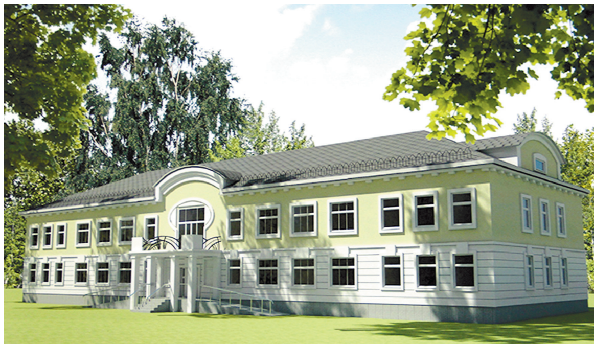
Так будут выглядеть реставрационные мастерские

Большая часть комнат в Доме Волконского сейчас отдана под хозяйственные службы, архивы и научную библиотеку. Расстановки сил такова, что выставочный зал занимает куда меньше места,