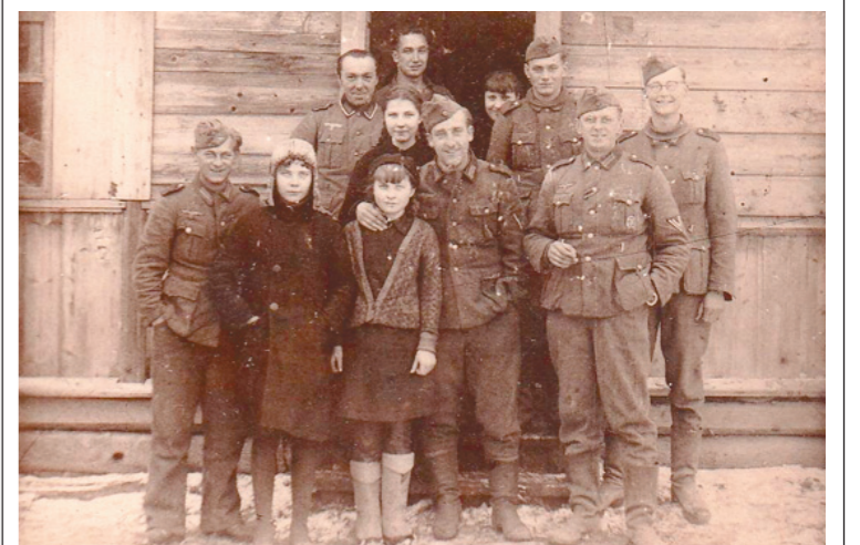
Эта фотография была сделана в Щекине в 1941 году

В Германии на интернет-аукционе www.ebay.de сейчас выставлена на продажу уникальная фотография, сделанная в 1941 году в период боев на территории нашей области, на что указывает карандашная запись на немецком языке, сделанная на обратной стороне снимка.