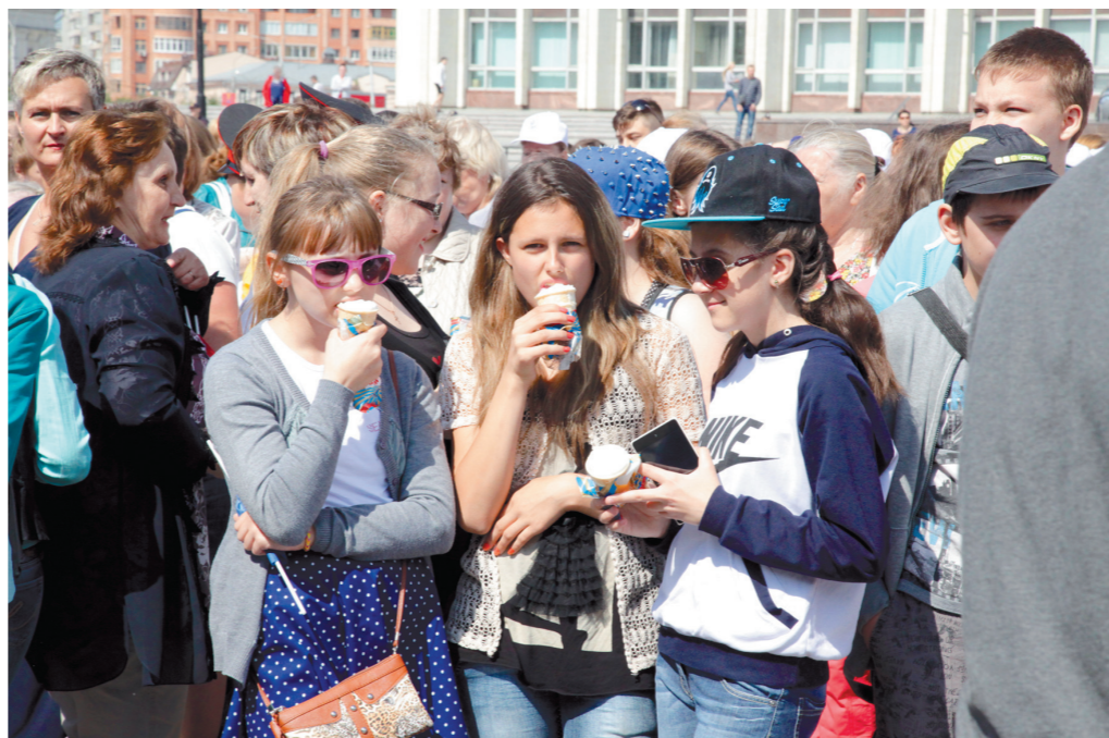
Мороженое туляки любят – вот только узловское осталось лишь в воспоминаниях