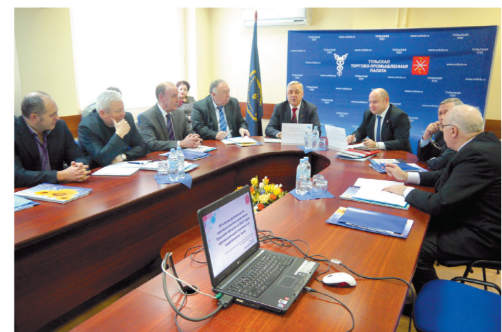
Тульская ТПП и областное правительство продолжают совместную деятельность

По итогам заседания приняли рекомендации, которые направлены в правительство области для использования их в планировании и проведении совместных с Тульской ТПП мероприятий.