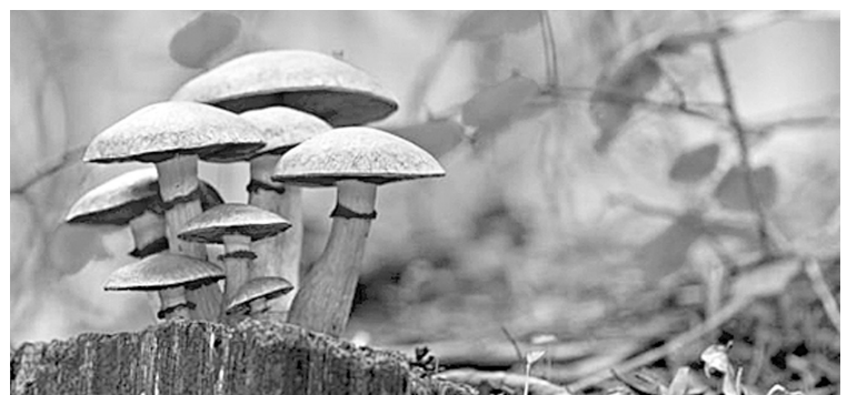
Незнакомые грибы класть в корзину нельзя

Управление Роспотребнадзора по Тульской области сообщило о новых случаях отравления грибами, правда, на этот раз до летального исхода дело не дошло — только до реанимации. В Ефремовском районе три человека отравились условно съедобными толкачками.