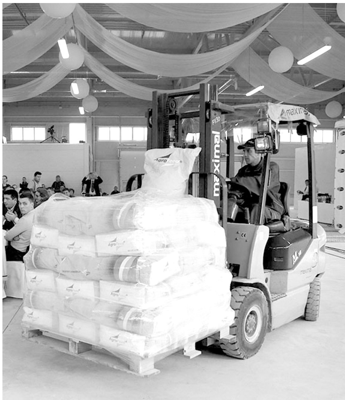
Первую партию продукции ввезли прямо на церемонию торжественного открытия завода

Стоит отметить, что тульские животноводы и птицеводы наверняка заметят экономии на доставке продукта. Кроме того, местные аграрии смогут поставлять сюда сырье для переработки.