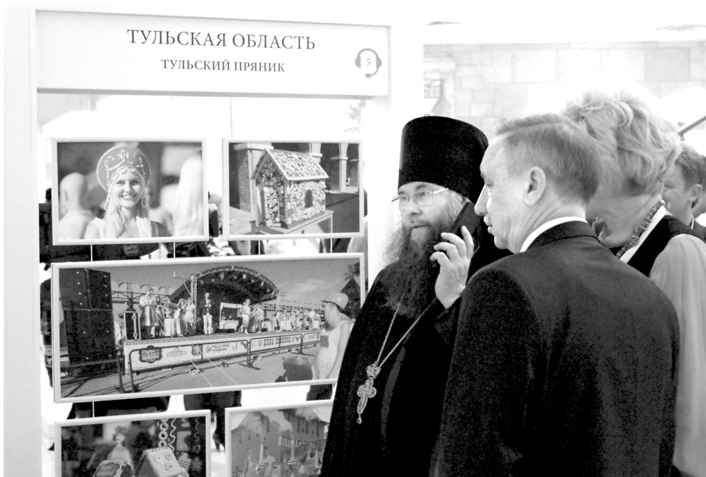
Тульскую область отметили на выставке региональных туристических проектов «Путешествуй по Центральной России»

По материалам представительства правительства Тульской области При Правительстве Российской Федерации.