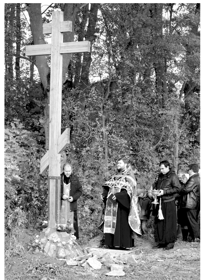
Установка креста стала делом десятка неравнодушных людей