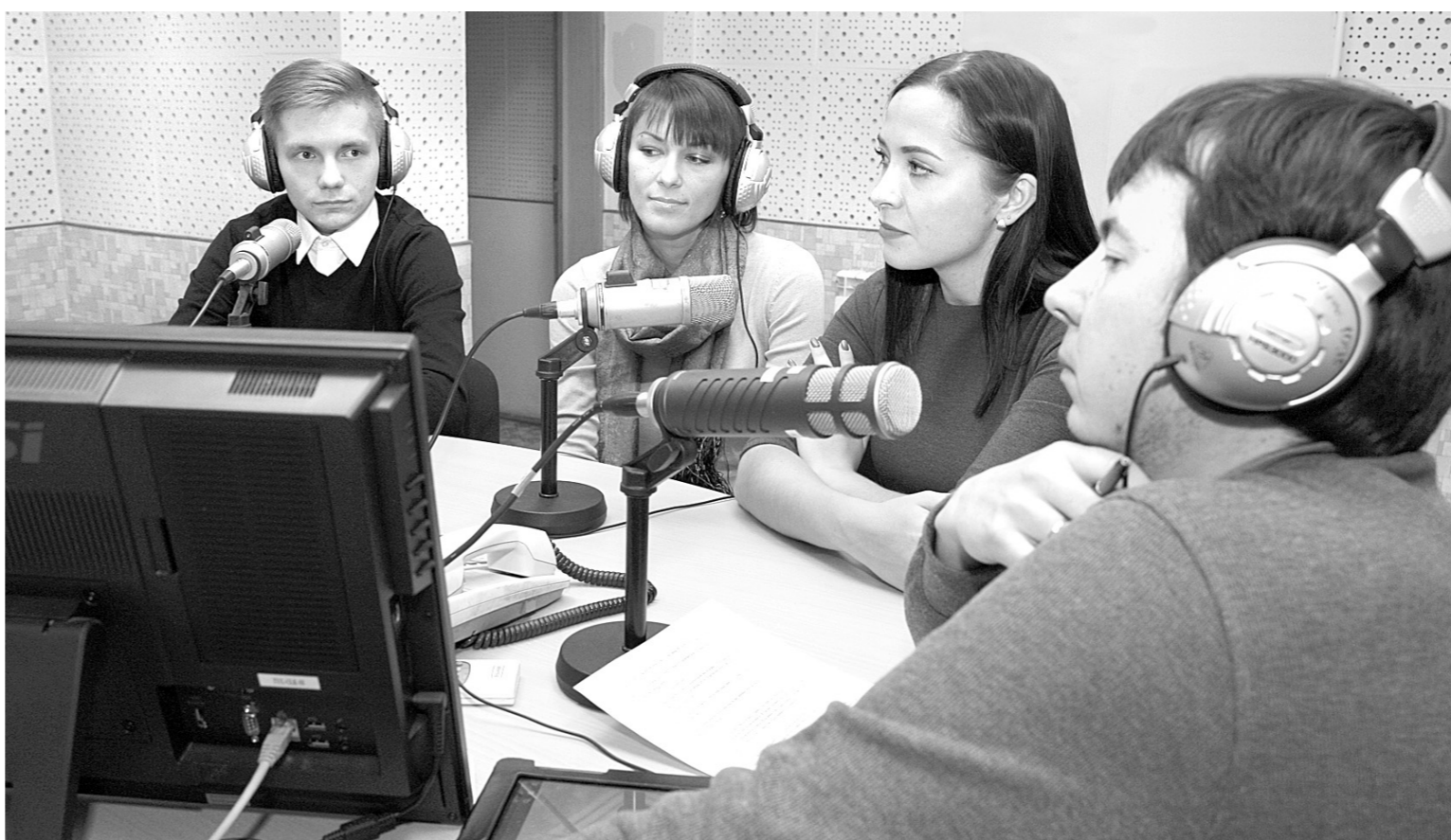
Гости программы «Беседка» в прямом эфире на «Радио России – Тула» говорили о том, чем живут студенты

– По большей части нашим ребятам самим интересно раз-