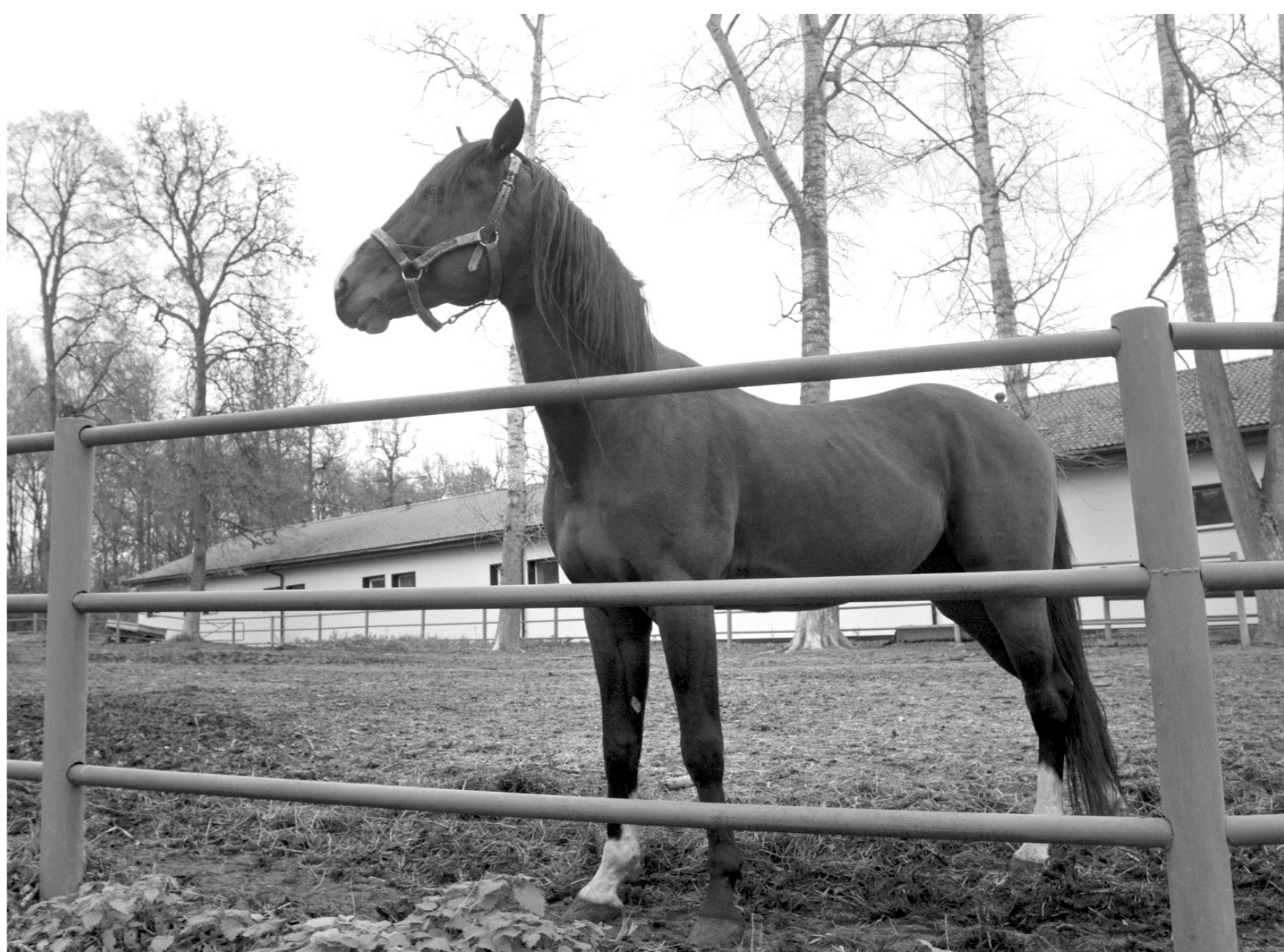
Коней-красавцев держит Прилепский племенной конный завод – единственное в Тульской области профильное предприятие