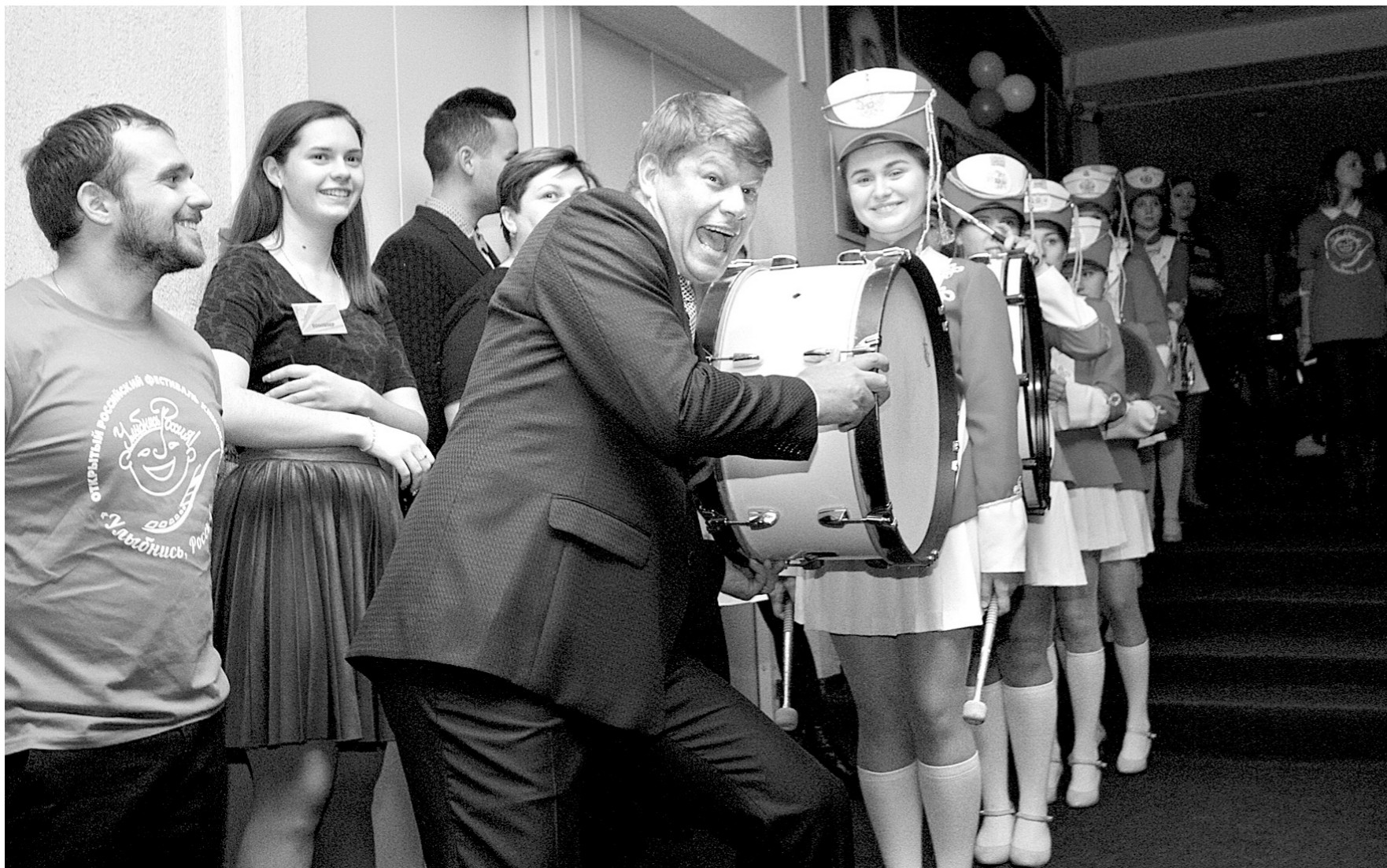
Губерниев не боится быть естественным и в жизни, и в работе