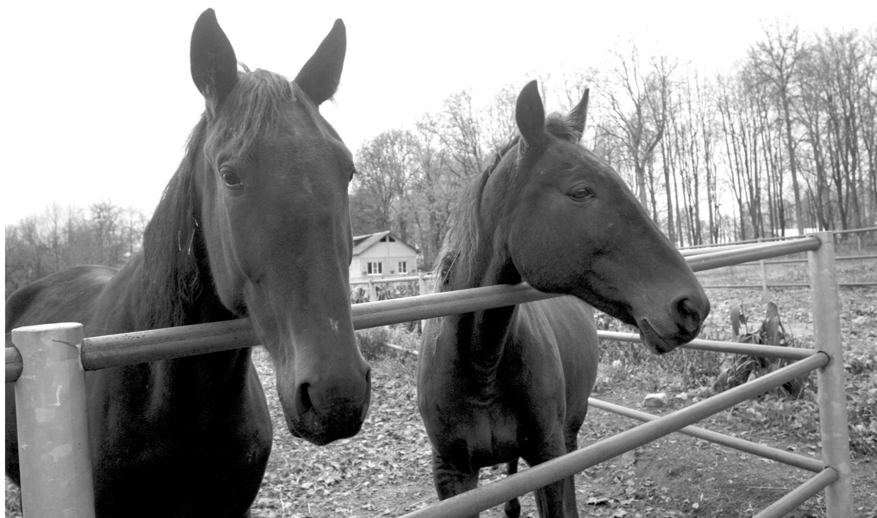
Животные выставлены на продажу – вот только толп покупателей у ворот ООО не наблюдается