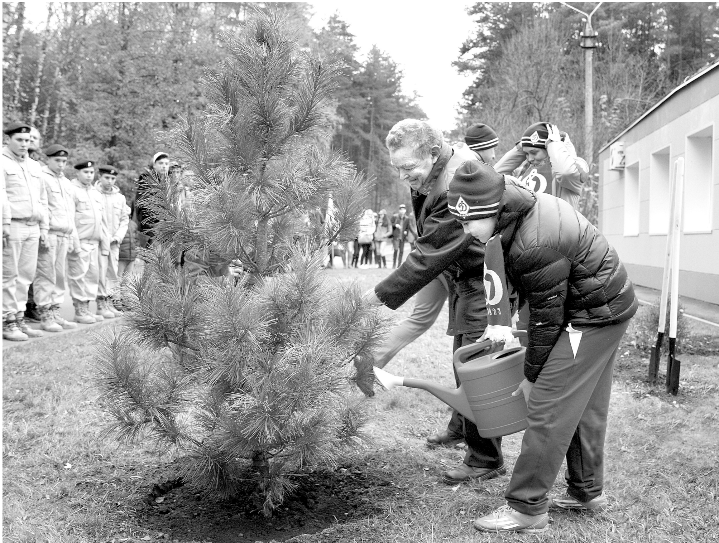
Вячеслав Веденин посадил кедр, который даст начало динамовской аллее чемпионов