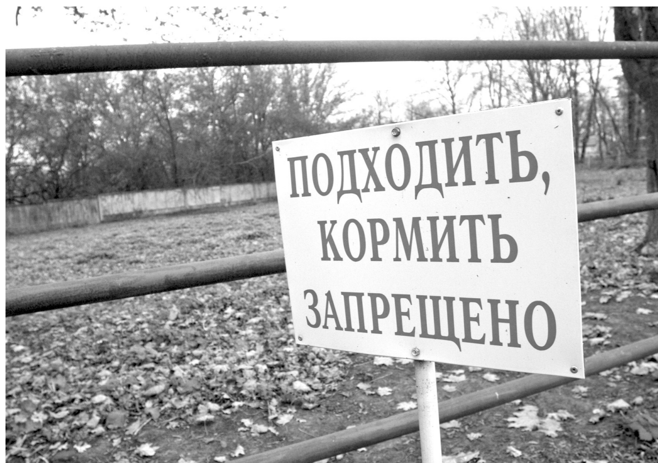
Такие таблички размещены на территории предприятия