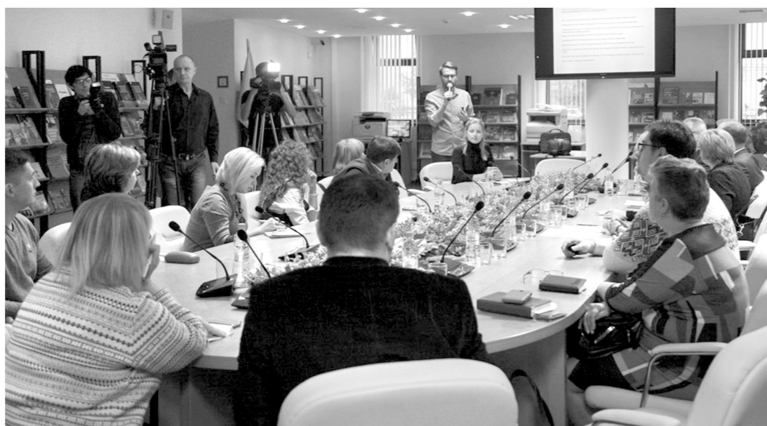
Тульский бренд обсудили со студентами, предпринимателями и сотрудниками культуры