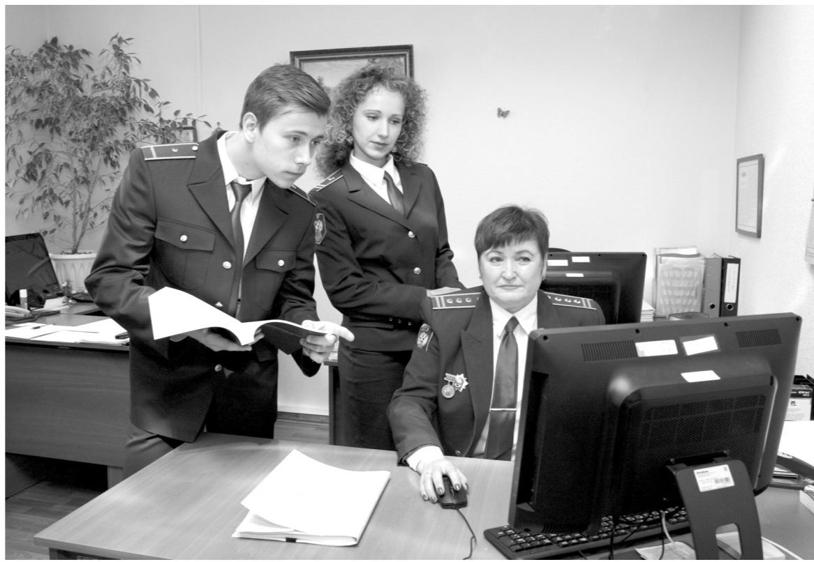
Главная составляющая качественной работы – высокий конкурс и отличные наставники

домстве идет реорганизация и оптимизация. При этом увеличилось количество таможенных постов не повлекло изменения численности специалистов. Сегодня в штатном расписании значится 237 человек, а укомплектованность составляет 96 процентов.