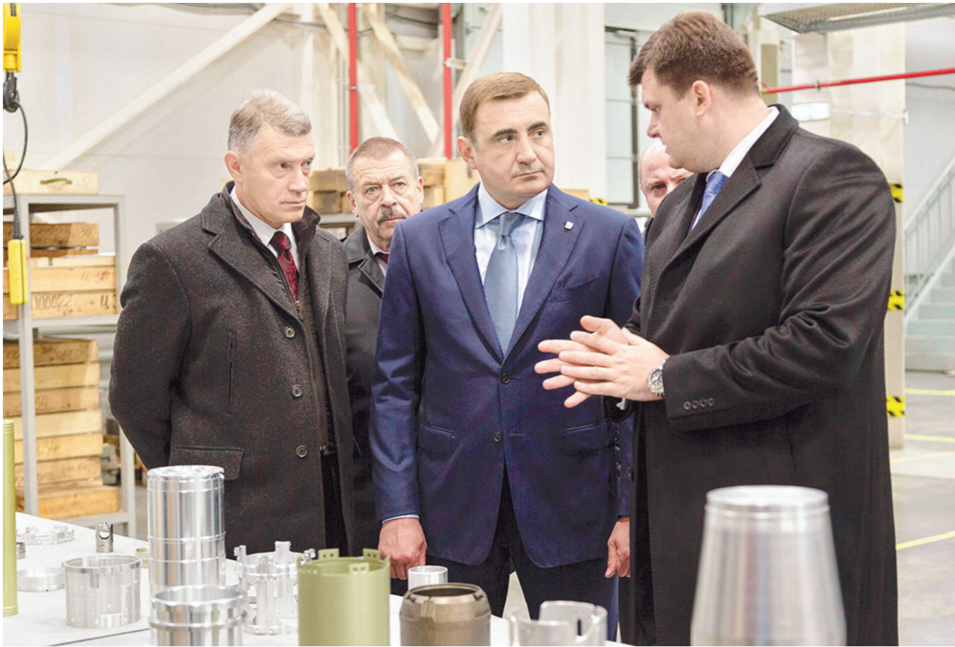
Алексей Дюмин ознакомился с продукцией Тульского оружейного завода

На днях с рабочим визитом на заводе побывал губернатор Алексей Дюмин. Он познакомился с работой цехов заготовительного и механического производства, осмотрел совре-