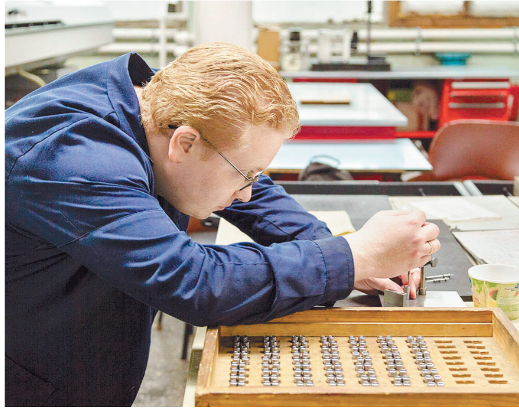
На ТОЗе проводится масштабное переоснащение производства

– Для нас сотрудничество с Тульским оружейным заводом – это одно из стратегических направлений. Предприятие может и впредь рассчитывать на нашу всестороннюю поддержку в реализации своих проектов. Мы будем отстаивать ваши интересы, чтобы у завода была возможность более эффективно наращивать производство, – сказал он.