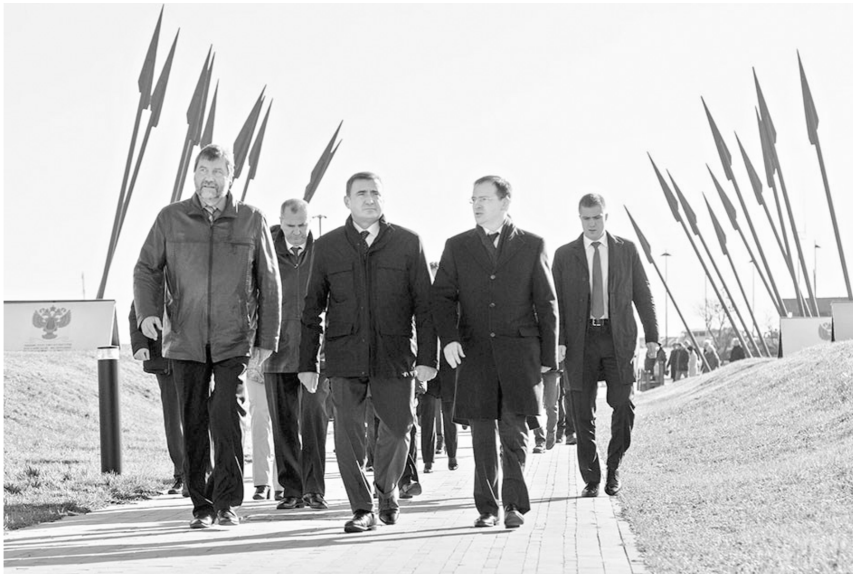
На открытие музея приехали губернатор Алексей Дюмин и министр культуры РФ Владимир Мединский

Площадь новой экспозиции – 2000 квадратных метров, и еще 300 отведено под временные выставки. Кстати, буквально на днях проект нового музейного комплекса и авторский коллектив его создателей под руководством архитектора Сергея Гнедовского получили Национальную премию РФ «Хрустальный Дедал».