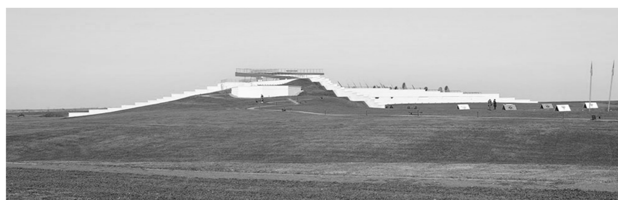
Здание нового музея напоминает курган

— Здесь использованы самые современные технологии и представлены артефакты, имеющие большую археологическую ценность, а также новые научные разработки. Все это в совокупности даст посетителям – а мы надеемся, что это будут не только жители России, но и зарубежные туристы, – насыщенную, интересную информацию, – сказал глава региона и добавил, что в Программе развития Тульской области большое внимание уделено туризму, и открытие