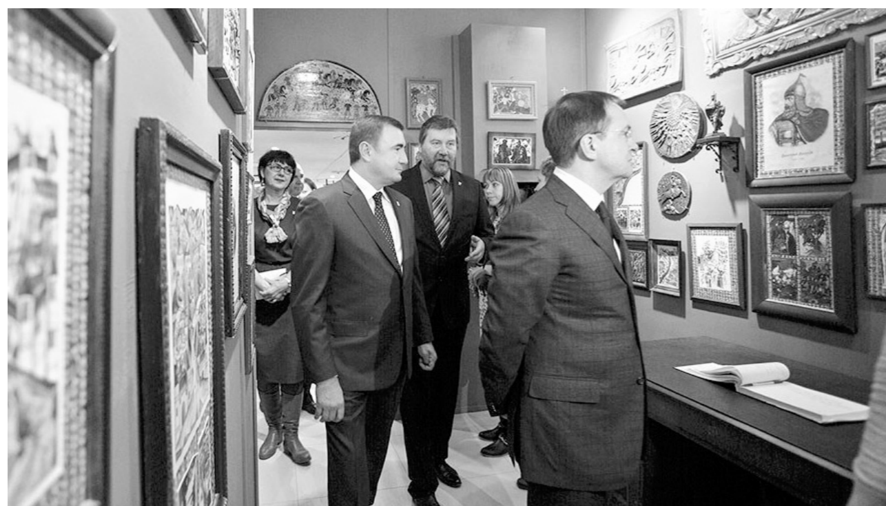
Экскурсию для почетных гостей провел Владимир Гриценко

— Для того чтобы создать на этой улице точки притяжения для туристов, важно исключить здания из списка приватизации, – отметил губернатор. – Считаю, эту задачу надо решать совместными усилиями.