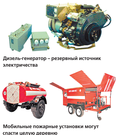
Дизель-генератор – резервный источник электричества

МПУ просто незаменимы в дачных товариществах и отдаленных деревнях. Они могут потушить возгорание задолго до приезда основных сил. Радиус действия установки – не менее 100 метров, поэтому она способна охватить достаточно большой населенный пункт и спасти от огня порядка 50 домов.