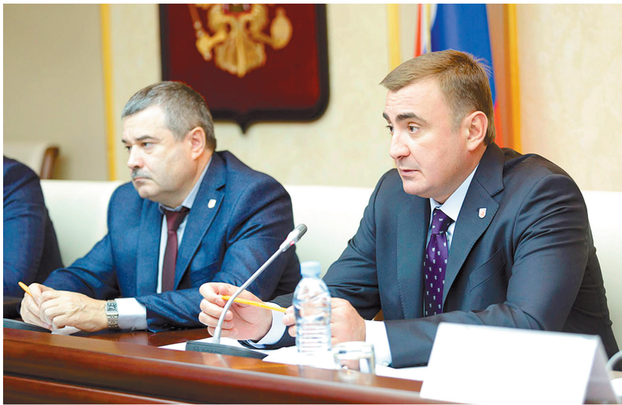
Вопросы, связанные с состоянием дорог, регулярно рассматриваются на заседаниях правительства

Как рассказал министр транспорта и дорожного хозяйства Александр Камзолов, в этом году 2 миллиарда 347 миллионов рублей было запланировано израсходовать на ремонт тульских дорог, а на их со-