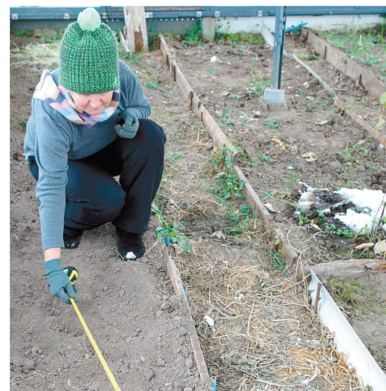
Налог на землю похож на рулетку: повезет – не повезет...

— Налогообложение земельным налогом в отношении земельного участка, перешедшего по наследству, осуществляется с месяца открытия наследства.