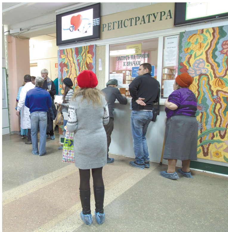
Регистратура поликлиники Тульской областной больницы № 2 готова к преобразованию

А впечатление бывает так себе... Согнувшись перед стеклянной стеной, практически полностью запертой листками с информацией, в которой непонятно разобраться, пациент тщетно пытается наладить контакт с барышней по ту сторону. Но слы-