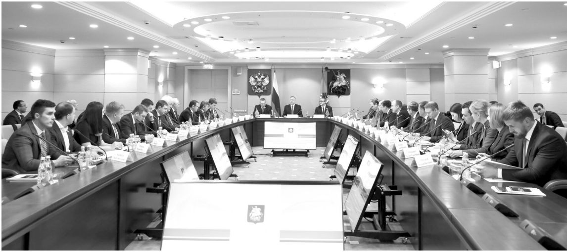
На Совет законодателей ЦФО съехались спикеры региональных парламентов

– Как отмечают регионы, нововведения уже сейчас влекут снижение интереса со стороны потенциальных претендентов в представительные органы местного самоуправления. В следующем году в Москве пройдут муниципальные выборы, нам нужно избрать 1800 депутатов, и где же найти кандидатов, готовых пройти эту непростую процедуру? – обратился с риторическим вопросом к участникам заседания докладчик. – Как бы мы не отбили у людей вообще охоту идти в местное самоуправление. Каким образом оптимизиро-