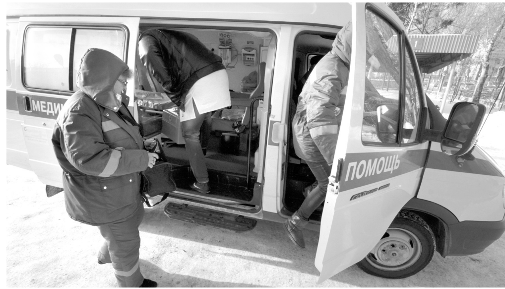
Нормативное время – 20 минут

– В Новомосковске и Узловой, где есть медицина, укомплектованность скорой помощи фельдшерами всегда приближалась к ста процентам, но сейчас и там начались проблемы, – сказал Потапов. – Фельдшеров призывали по зарплате к медицинским сестрам, и они массово двинулись работать в поликлиники, где нагрузки и риски меньше, нет ночных смен. Москва сейчас не многих медиков к себе забирает, хотя и это нельзя сбрасывать со счетов. В этом году благодаря областной