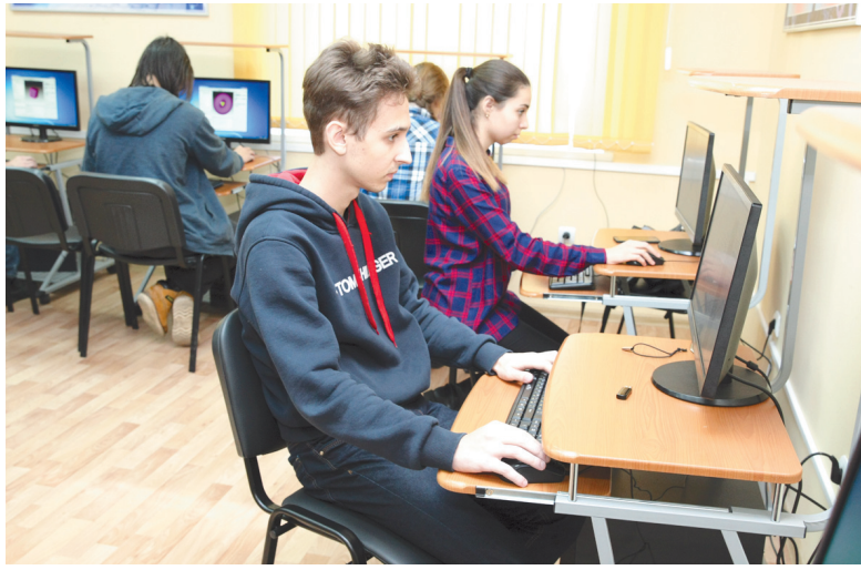
Число сотрудников должно увеличиться уже в ближайшее время

– Это площадка для взаимодействия между научным сооб-