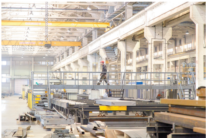
На заводе «Сталинвест» кровно заработанных денег ждут свыше 500 человек

– Потенциальные покупатели уже приезжают, – сообщил Муратов. – На предприятия