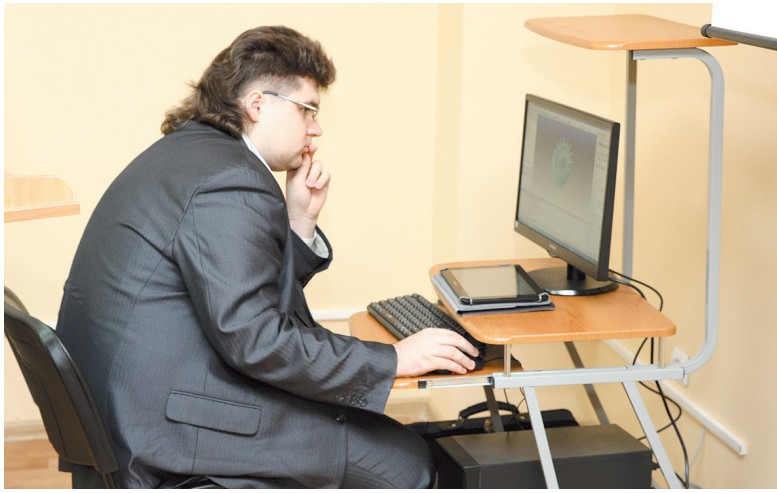
Отечественный софт, которым оборудован центр, производительнее иностранного