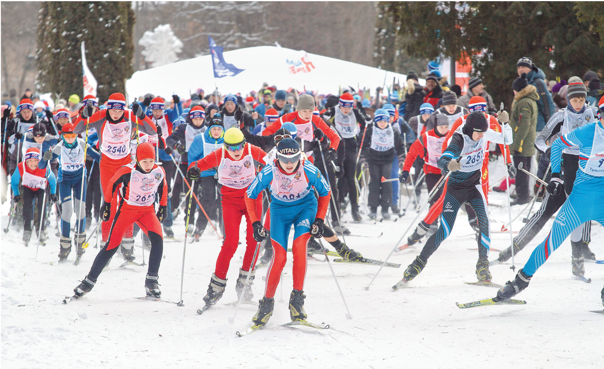
Зимой в тульских парках будет жарко