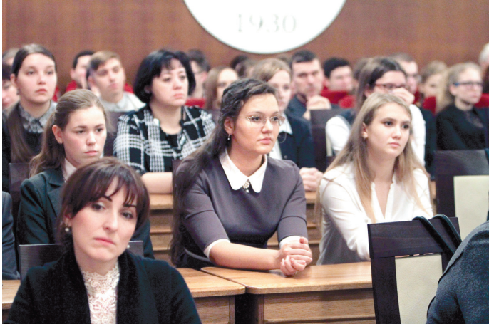
На стобалльников регион возлагает большие надежды

держке талантливой молодежи и, в частности, об организованном на базе Тульского государственного университета «Клубе стобалльников». – Кстати, идея работы с