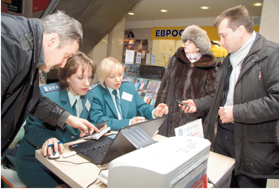
Очереди в ТЦ выстраиваются отнюдь не в бутики, а к налоговикам

Торговые центры, МФЦ, отделения Сбербанка – хождение в народ сотрудников регионального УФНС продлится как минимум до 1 декабря – финального срока уплаты имущественных налогов, после которого неисполненные обязательства перейдут в ранг недоимок, а значит, в отношении должников будет внедряться процедура взыскания. Не-