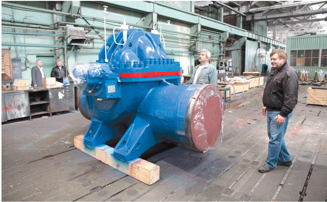
Руководство ОАО «ТНТИ» задолжало своим работникам более 50 миллионов рублей

Не все просто и за пределами областного центра. Так, на территории Щекинского района расположен завод «Сталинвест», головное предприятие которого находится в городе Домодедово Московской области. На производстве чис-