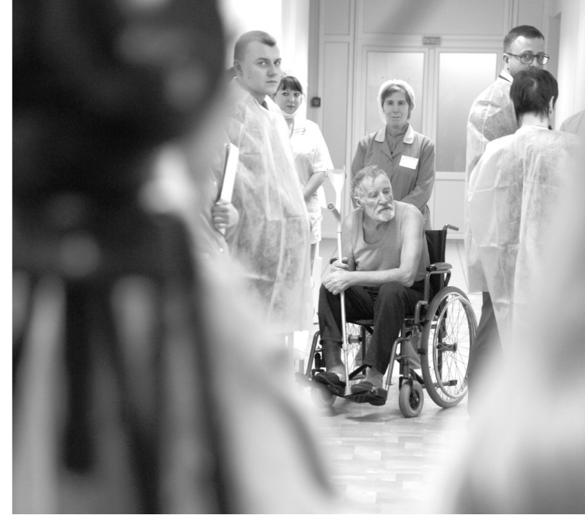
В ожидании целительного препарата

Известно, что самое грозное осложнение сахарного диабета – диабетическая стопа с гангреной и последующей ампутацией, вернее – несколькими, последовательными усеченностями конечности – является величайшей проблемой эндокринологии. В нашем регионе проводится до 270 ампутаций ежегодно. Заболеваемость сахарным диабетом в Тульской области, как и во всем мире, имеет тенденцию к быстрому росту, в прошлом году у нас было зарегистрировано 58 856 человек с этим заболеванием. Прогрессивно увеличивается и число больных диабетической полинейропатией – с 17 674 случаев в 2011 году до 21 419 случаев в 2015-м. Именно поли-