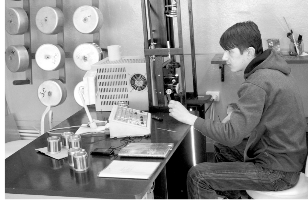
От ученых ждут таких разработок, внедрение которых принесет солидную прибыль