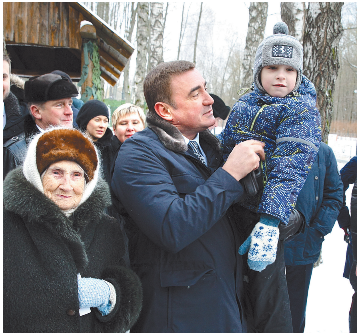
Многие туляки хотели сфотографироваться с Алексеем Дюминим

Сергей МИТРОФАНОВ Сергей КИРЕЕВ, Геннадий ПОЛЯКОВ Все фото на сайте ti71.ru