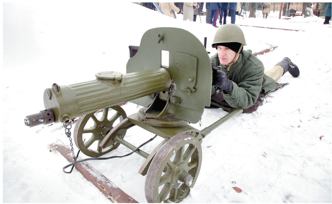
Вход в «Партизанскую деревню» охранял пулеметчик

– Именно здесь проходил передний край обороны. Военно-патриотический парк – это еще одно памятное место, напоминающее о тяжелых днях 41-го. Хочу выразить слова благодарности тем людям, которые вложили сердце и душу в этот комплекс.