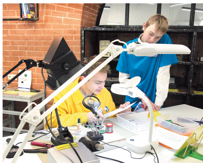
Задача «Кванториума» – выявлять таланты, быть базой для их развития и ранней профориентации детей

– Ширится и региональное олимпиадное движение. Так, в марте были проведены областные соревнования по LEGO-робототехнике, позволяющие выявить талантливых обучающихся, занимающихся по программам инновационных технологий, мехатроники и программирования. А в октябре состоялась первая региональная олимпиада