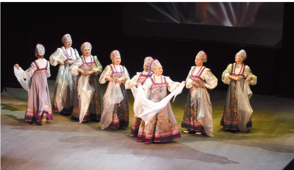
Зрители пытались найти что-то общее в русских и итальянских танцах