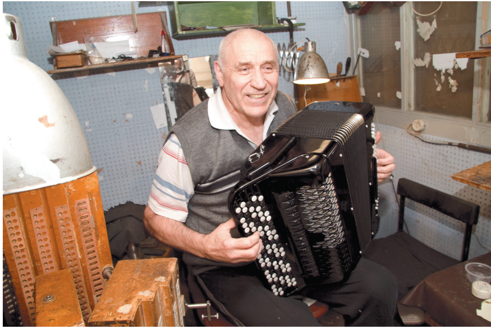
Он умеет не только настроить или починить инструмент, но и прекрасно играет