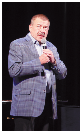
Собравшихся поприветствовал председатель правительства Тульской области Юрий Андрианов