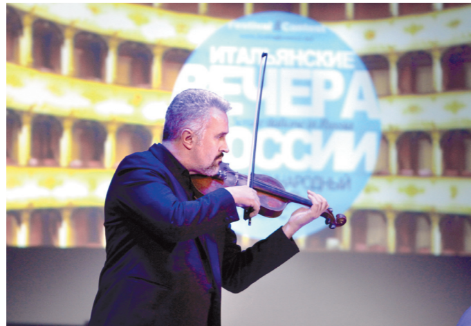
«Итальянские вечера» – настоящий праздник искусства

По сути, этот фестиваль является частью международного проекта «Российские вечера в Италии», цель кото-