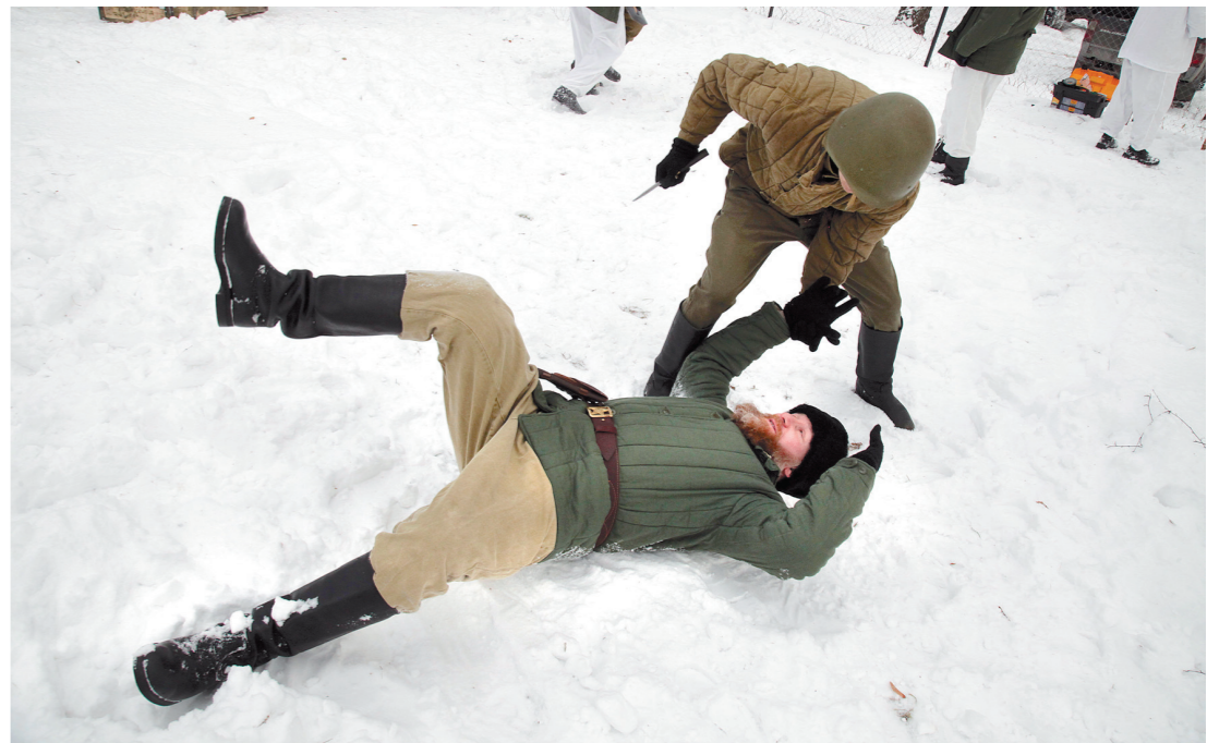
...а здесь учили прием рукопашного боя