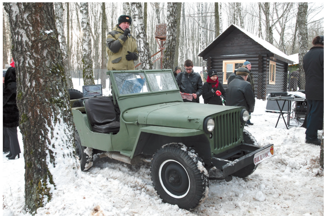
На территорию «Партизанской деревни» своим ходом прибыл старенький «виллис»