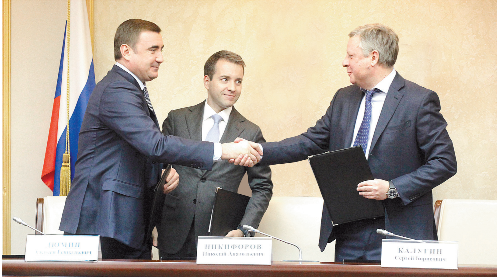
Трехстороннее соглашение позволит повысить качество жизни даже в небольших населенных пунктах Тульской области

– Уверен, что реализация нашего соглашения повысит качество связи и охват населения Тульской