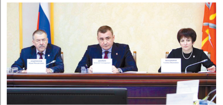
Алексей Дюмин провел совещание с членами правительства области