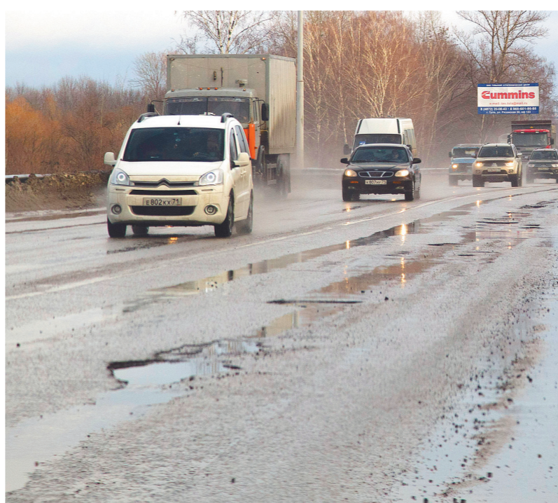
Улицу Рязанскую «лечили» на прошлой неделе и продолжили на этой

Конкурс на выполнение ямочного ремонта в Туле выиграло АО «Спецавтохозяйство». На этой неделе предприятие работает в продленном графике. Изменил привыч-