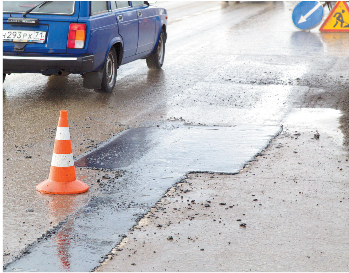
Качественно сделанная заплатка прослужит дороге не один год.

Сообщить о ямах на дорогах Тулы можно по тел.: 30-47-81 или 33-11-37.