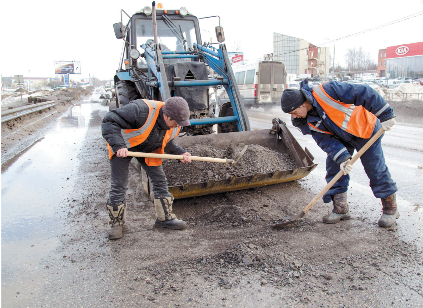
Спецавтохозяйство работает в усиленном режиме

К слову, эксперты лишь частично согласны с тем, что причина увеличения рытин на дорогах кроется в сложных погодных условиях.