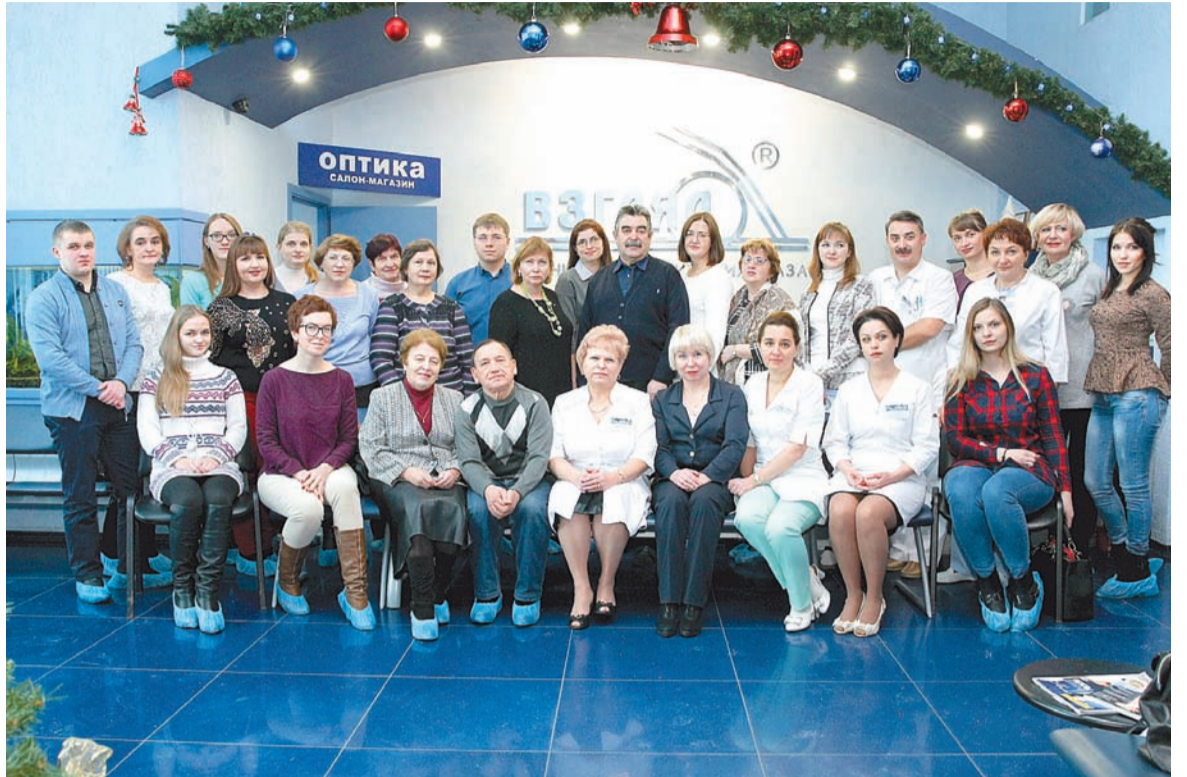
Коллективное фотографирование всех участников круглого стола – добрая традиция

– ОКТ позволяет видеть то, что может не распознать врач даже вооруженным глазом, и вовремя принять меры. Ведь можно заметить роговицу, хрусталик, а вот глазное дно – нельзя. Это не старый ковер, вместо которого можно постелить новый.