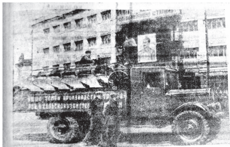
Первомайская демонстрация трудящихся в Туле. На снимке: автомобиль патронного завода с новой продукцией – тракторный плуг. 1947 г.

Сегодня уже нет в регионе ни действующих шахт, ни самого «Тулауголя», да и сама профессия канула в Лету – а вот уголек еще есть. Но мы уверены, что о достижениях тульских горняков еще обязательно вспомнят, и не раз, как это сделали мы на страницах газеты в память о людях, ставивших трудовые рекорды не столько ради славы, сколько ради того, чтобы стране жилось легче.