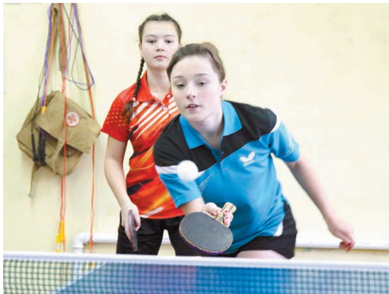
Каменские старшеклассницы – одни из сильнейших в областном настольном теннисе