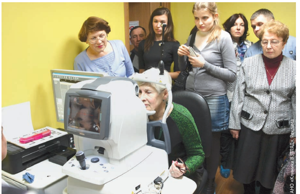
ОКТ – прибор, вызвавший массу восторгов у врачей

ИМЕЮТСЯ ПРОТИВОПОКАЗАНИЯ. НЕОБХОДИМО ПОЛУЧЕНИЕ КОНСУЛЬТАЦИИ СПЕЦИАЛИСТА