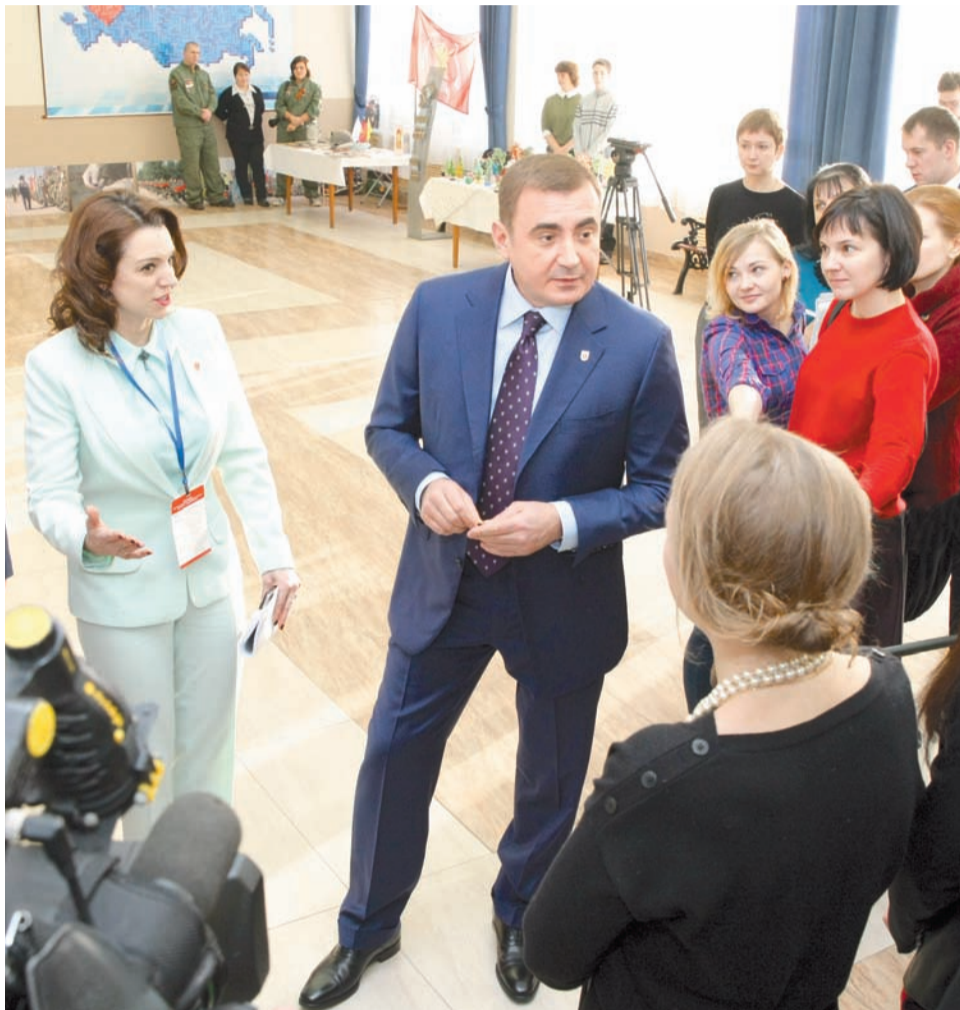
Общаясь с журналистами, губернатор сказал, что верит в потенциал молодых

– Я изучил некоторые инициативы. Все они разные, но их объединяет одно – стремление изменить мир к лучшему и мощный