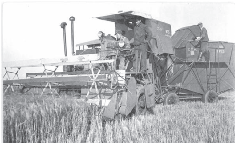
«Сталинец-4» на жатве в ГДР, 1953 год

Отмена карточной системы 1947 года дала импульс восстановлению торговли: стали восстанавливать рынки, появилось большое число магазинов.