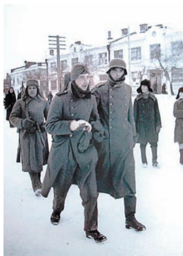
Немецких военнопленных, не друживших с дисциплиной, отправляли на перевоспитание в Плавск

В 1947 году в Плавске размещалось штрафное подразделение, куда попадали на перековку немецкие военнопленные-сорвиго-