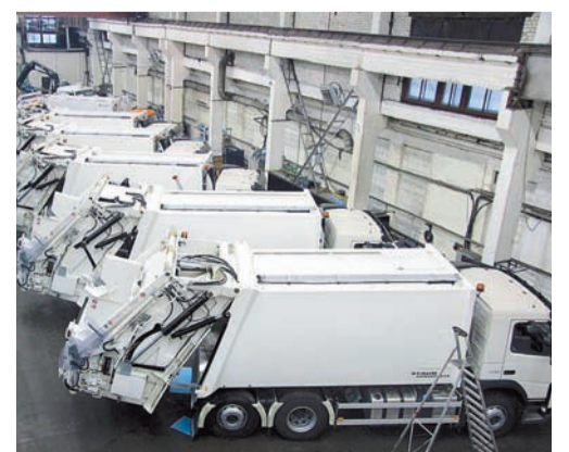
Такие мусоровозы через два года планируется производить и в Тульской области

Планируемая мощность будущего предприятия – 250 машин в год. А запуск производства намечен на 2018 год.