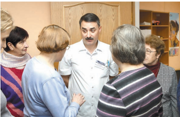
В процессе знакомства с клиникой и ее специалистами окулисты могли сразу обсудить и ряд возникающих у них профессиональных вопросов

ИМЕЮТСЯ ПРОТИВОПОКАЗАНИЯ. НЕОБХОДИМО ПОЛУЧЕНИЕ КОНСУЛЬТАЦИИ СПЕЦИАЛИСТА