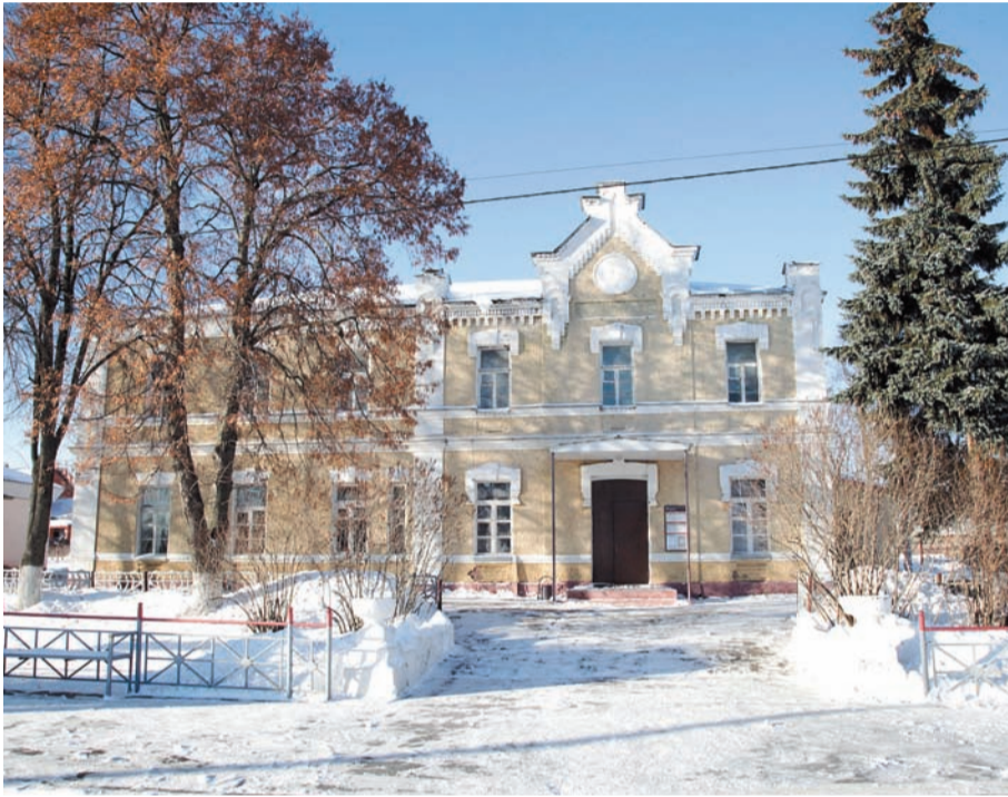
Станция Мордвес приобретет новый облик

Но Мордвес славен не только своим железнодорожным узлом, но и людьми. В самом поселке и окрестных деревнях родились шесть Героев Советского Союза, которые самоотверженно сражались с гитлеровцами в годы Великой Отечественной войны. Среди уроженцев этих мест есть и те, кто проявил себя в войне с Наполеоном, в Первой мировой. Память о них в поселке чтут – здесь располагается выполненный в форме пятиконечной звезды сквер в память о павших воинах. Каждый год в День Победы в поселке до тысячи человек участвуют в шествии «Бессмертного полка». В день 75-летия со дня освобождения Мордвеса от немецко-фашистских захватчиков здесь прошел торжественный митинг, к памятнику у братской могилы, где похоронены 186 солдат, возложили цветы.