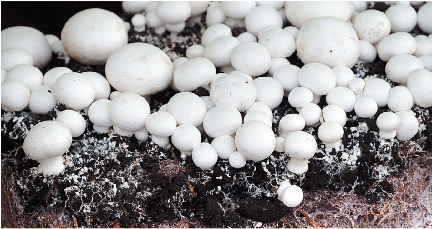
Шампиньоны в промышленных масштабах в Тульской области начнут выращивать уже в следующем году