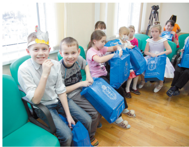
Подарки понравились всем

– Хотелось бы, чтобы этот праздник дал детям импульс к выздоровлению, и я очень благодарна своим коллегам – врачам и медсестрам – за тот праздник, который они сегодня устроили для ребятишек. Ну а как депутат я надеюсь, что все законы, которые будут приняты в наступающем году, обернутся детям только во благо.