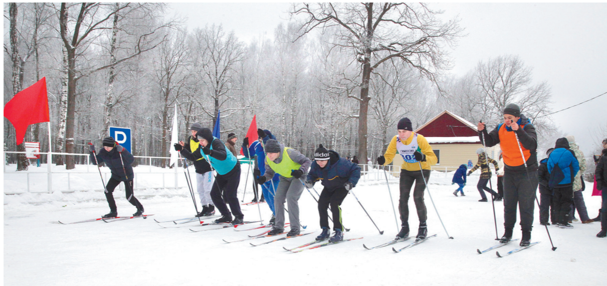
Кататься на лыжах в любое время суток – большая радость для суворовцев