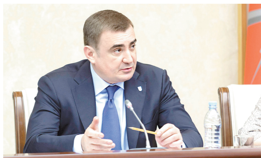
Алексей Дюмин: надо использовать все ресурсы, для того чтобы навести порядок в сфере управляющих компаний как можно раньше

– По закону перерасчет у нас носит заявительный характер: житель должен обратиться за ним в управляющую компанию, представив акт. Увы, не все люди об этом знают, чем и пользуются нерадивые УК, – констатировал он. – Здесь мы возлагаем надежды на советы домов, которые в регионе на 1 декабря уже около 5 тысяч и работа по их созданию продолжается.