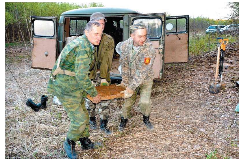
Весной в Белевском районе следопыты нашли массивный фрагмент бронетанковой техники

Мы получили информацию о том, что близ деревни Хрущевка Киреевского района имеется глубокая воронка от авиационной бомбы, куда, со слов одного из местных жителей, после боев 1941 года сносили с полей тела убитых солдат. Долгое время в ней была вода, там люди даже купались. Но потом она пересохла. И мы предприняли попытку найти в земле останки. Сложность работы заключалась в том, что бойцы лежали на глубине более двух метров!