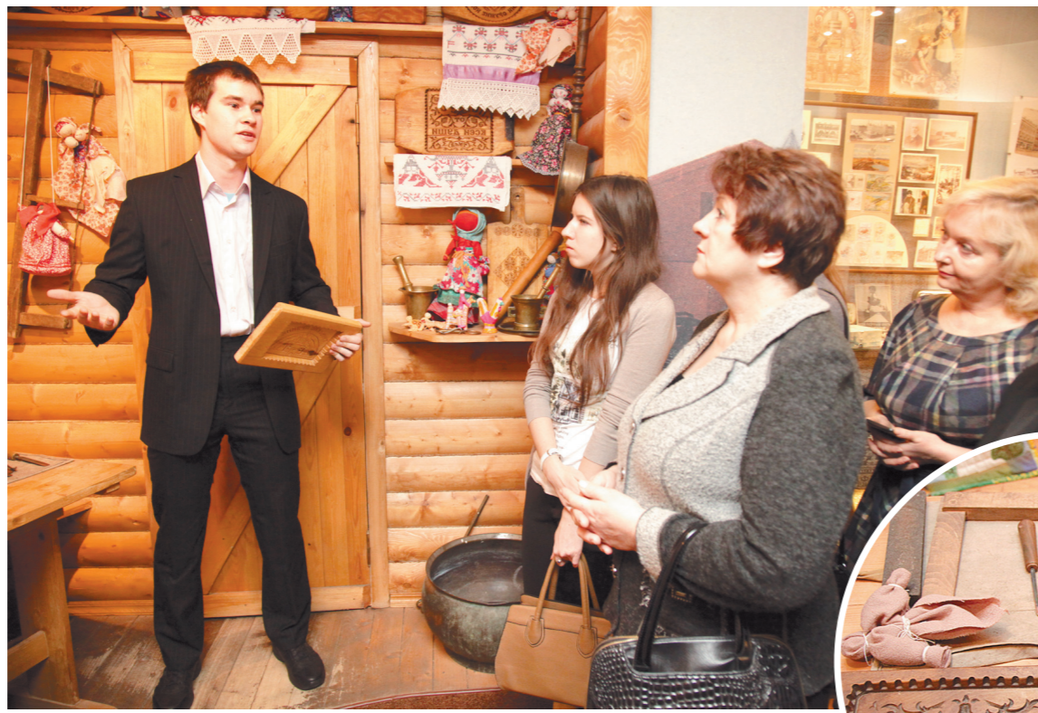
С туроператорами поделились секретами праздничного производства