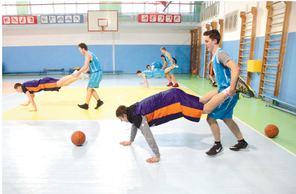
Эстафеты были не только полезными, но и веселыми

А в завершение всего выстрелили устроили для богородчан двустороннюю игру, но, чтобы нивелировать разницу в классе, профи надели на одну руку боксерскую перчатку. Играть таким образом, как оказалось, тяжело даже против школьников – поэтому импровизированный