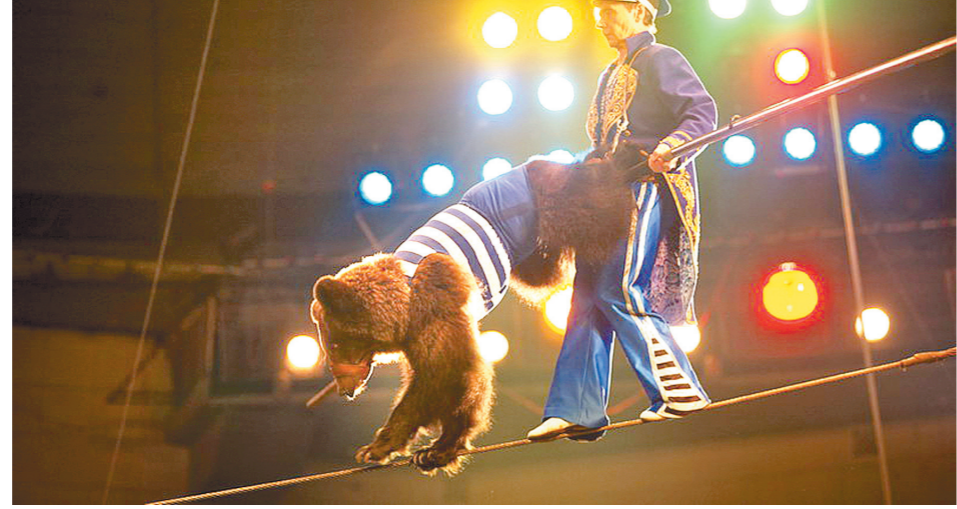
Пираты, медведи, обезьяны, пони – в Тульском цирке

Марту мы взяли совсем маленькой и тогда же обратили внимание, что у нее недомогало со зрением. Когда гастролировали в