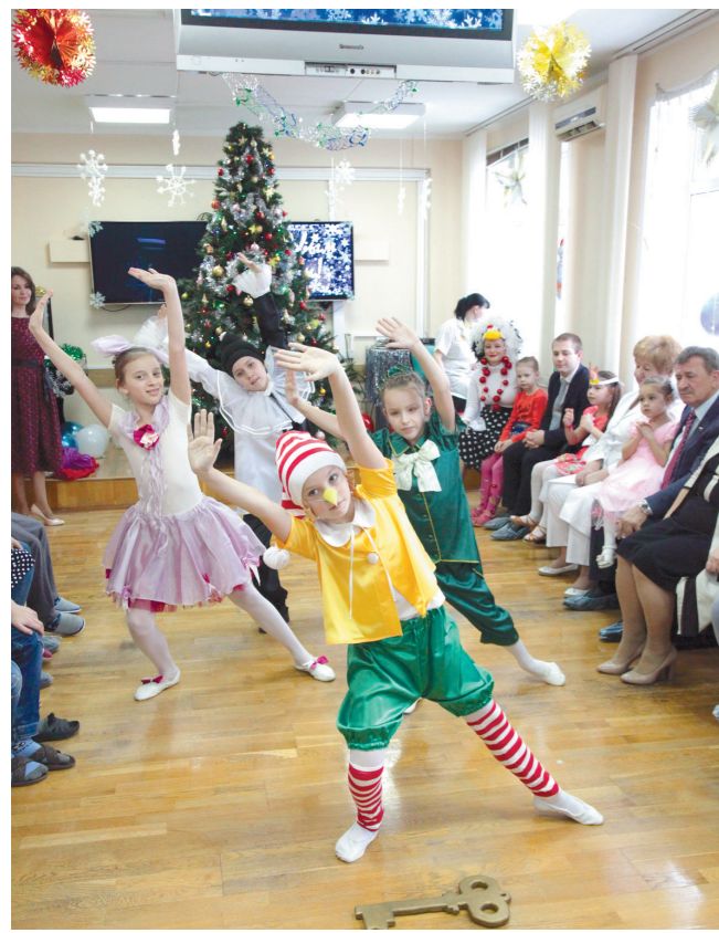
Всех развлекали маленькие танцоры из коллектива «Элегия»