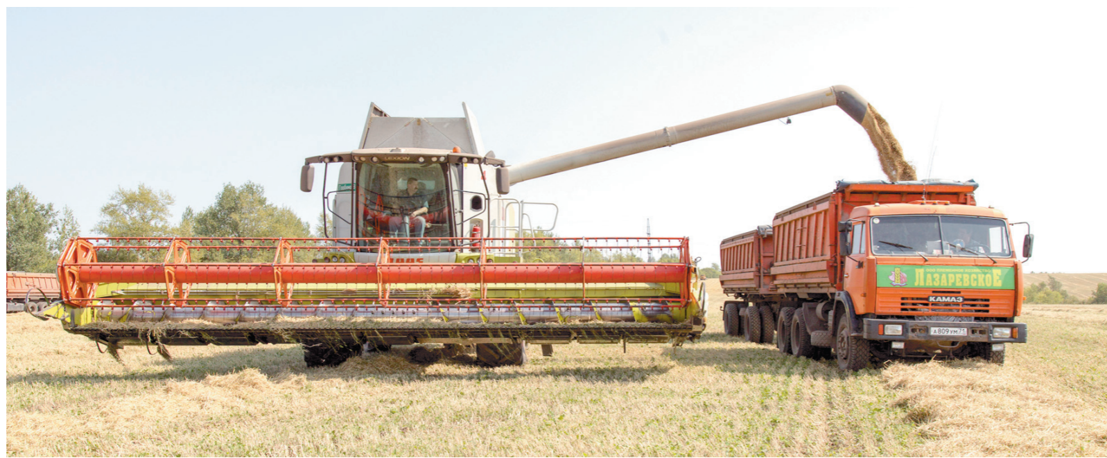
Одно дело – собрать урожай, другое – сохранить его без потерь, а для этого региону нужны сушильно-сортировальные комплексы

Что касается направления «Новая индустриализация», то на Питерском экономическом форуме были заключены 19 соглашений на общую сумму более 80 миллиардов рублей, реализация этих проектов приведет к созданию в