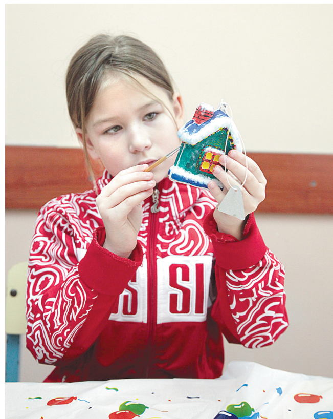
В ходе мастер-класса дети сами расписали игрушки