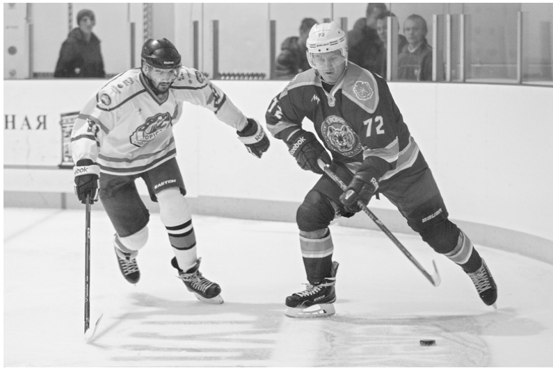
Поиграть в хоккей и покататься на коньках летом туляки смогут не только в «Тропике»