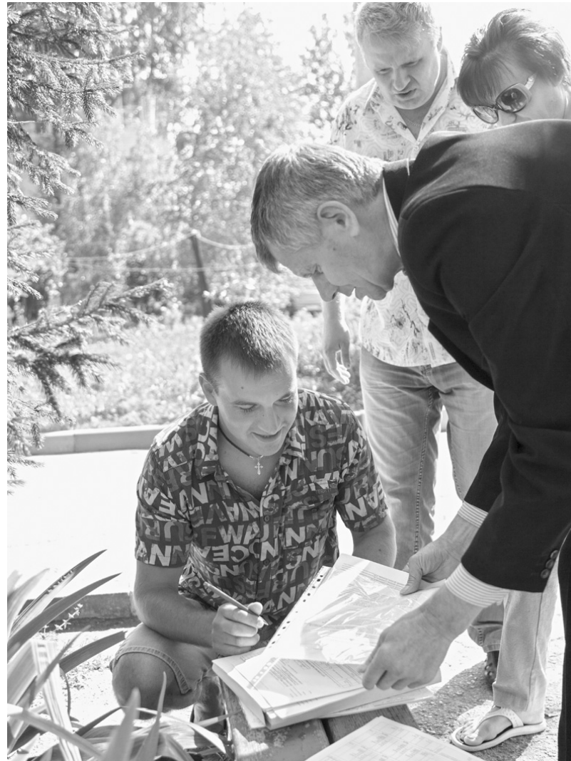
Народный бюджет: жители требуют качества и порядка

В течение последних лет в области планомерно проводилась