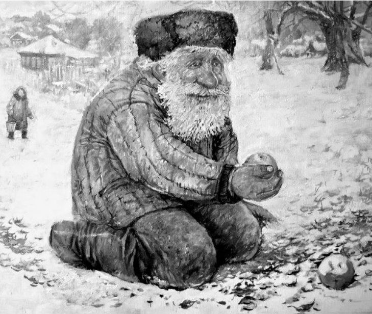
Яблочки в саду наливные...