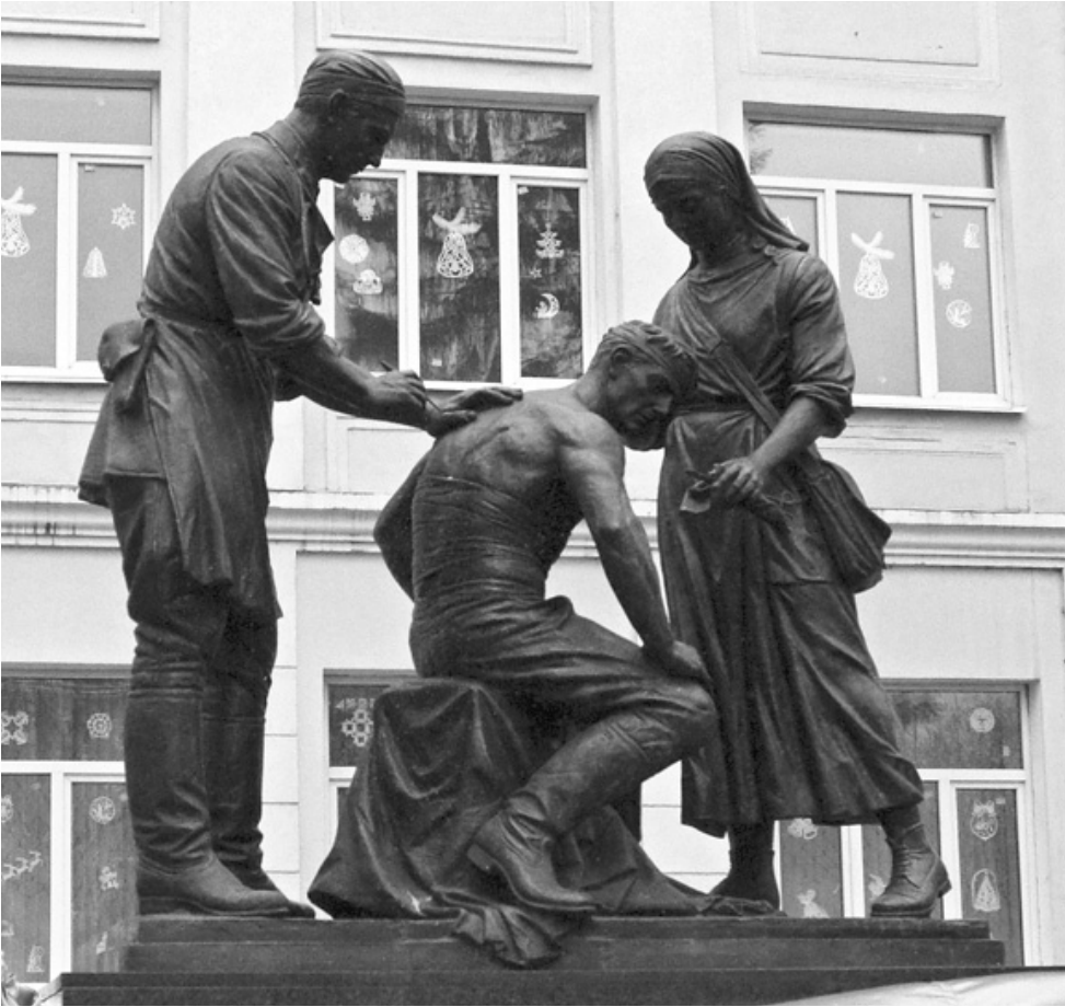
Памятник военным медикам создан благодаря Российскому военно-историческому обществу

Владимир Мединский также сообщил собравшимся, что за неполные три года существования Российского военно-исторического общества по стране открыто более полусотни памятников, а этот, посвященный подвигу военных медиков, – один из первых, если пока не единственный в России.