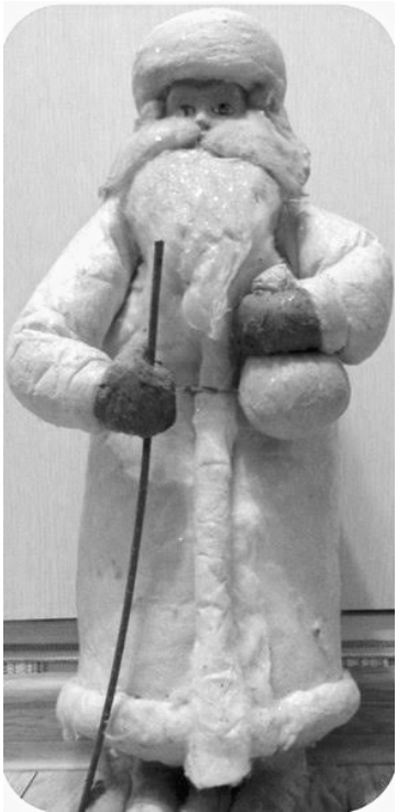
Эта необычная коллекция никого не оставляет равнодушным