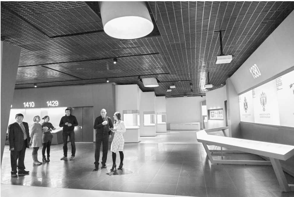
Музейщики предвкушают самую приятную часть работы – наполнение экспозиции

1 Здесь есть свои гостиница, центр приема посетителей. Площадь будущей экспозиции – порядка 2000 квадратных метров. Еще 400 метров в новом музейном комплексе предусмотрено для временных выставок. Новые площади более чем в семь раз превышают пространство, которое сегодня занимают выставки в старом музее. Полностью экспозиция будет смонтирована к сентябрю – к годовщине битвы. А пока посетители могут увидеть залы, посвященные Параду Победы в 1945-м, оформленные при участии Государственного исторического музея.