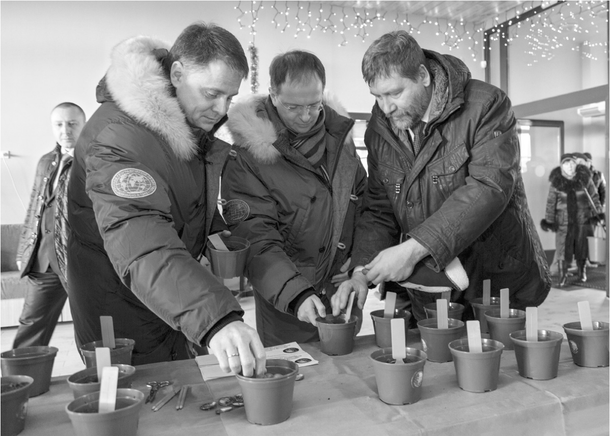
Почетные гости приняли участие в патриотической акции «Зеленая дубрава» – посадили желуди, собранные в окрестностях Куликова поля