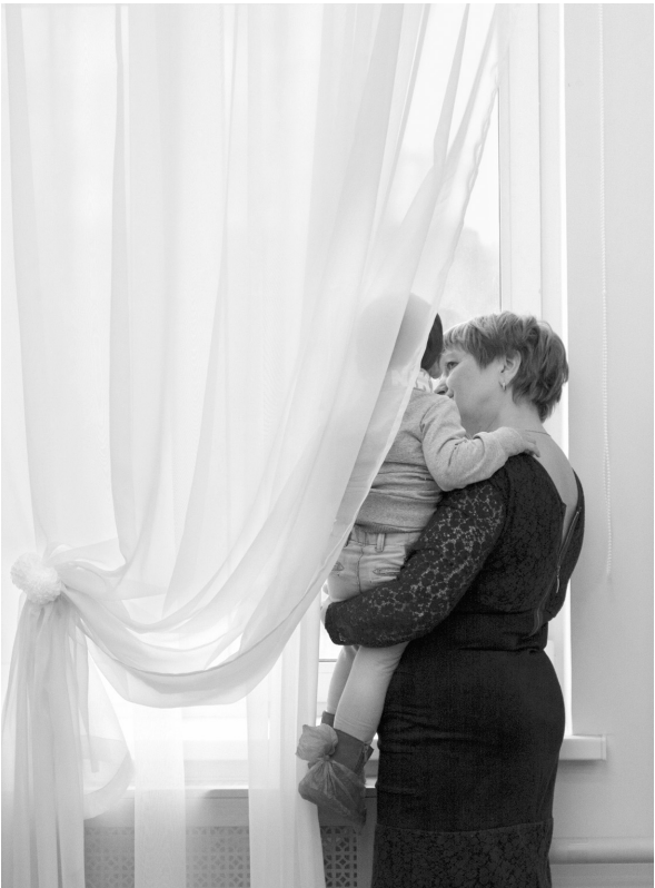
Что нужно ребенку для счастья? Заботливые родители и теплый уютный дом

Только в этом году 488 молодых семей смогли оформить социальную выплату на приобретение квартиры, и к 1 декабря 473 супружеские пары уже получили соответствующие документы. Что касается программы, способствующей развитию ипотечного кредитования, то по ней поддержку за счет бюджетных средств региона оказывают гражданам, обитающим в помещениях, признанных непригодными для проживания, таким людям возмещают 60 процентов расчетной стоимости приобретаемой квартиры; многодетным семьям положена выплата в размере 40–90 процентов, а зависит итоговая сумма от количества ребятишек у родителей; работникам государственных и муниципальных учреждений покрывают половину расходов на покупку нового жилья. В уходящем году такую меру поддержки получили 176 семей, из них 21 многодетная. А с 2011 года на реализацию программы поступило 1167,4 миллиона рублей, что позволило 800 семьям справиться долгожданное новоселье.