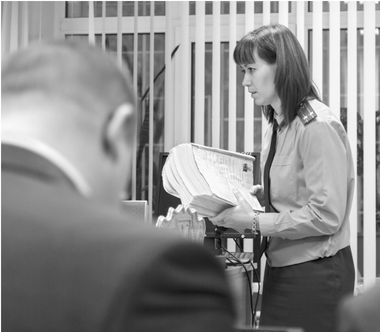
Прокурор представила личные дела подсудимых и детализацию разговоров, доказывающих, что их не было дома