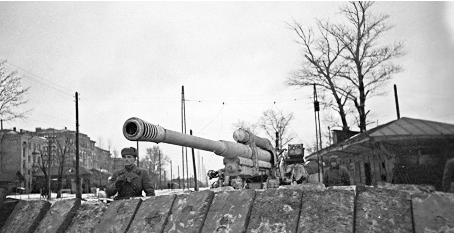
Важную роль в обороне Тулы сыграла артиллерия