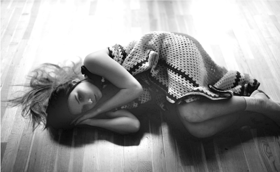
Плед купила бабушка, а выплачивать кредит придется всей семье

Таких денег у пожилой женщины с собой не было, но менедже-