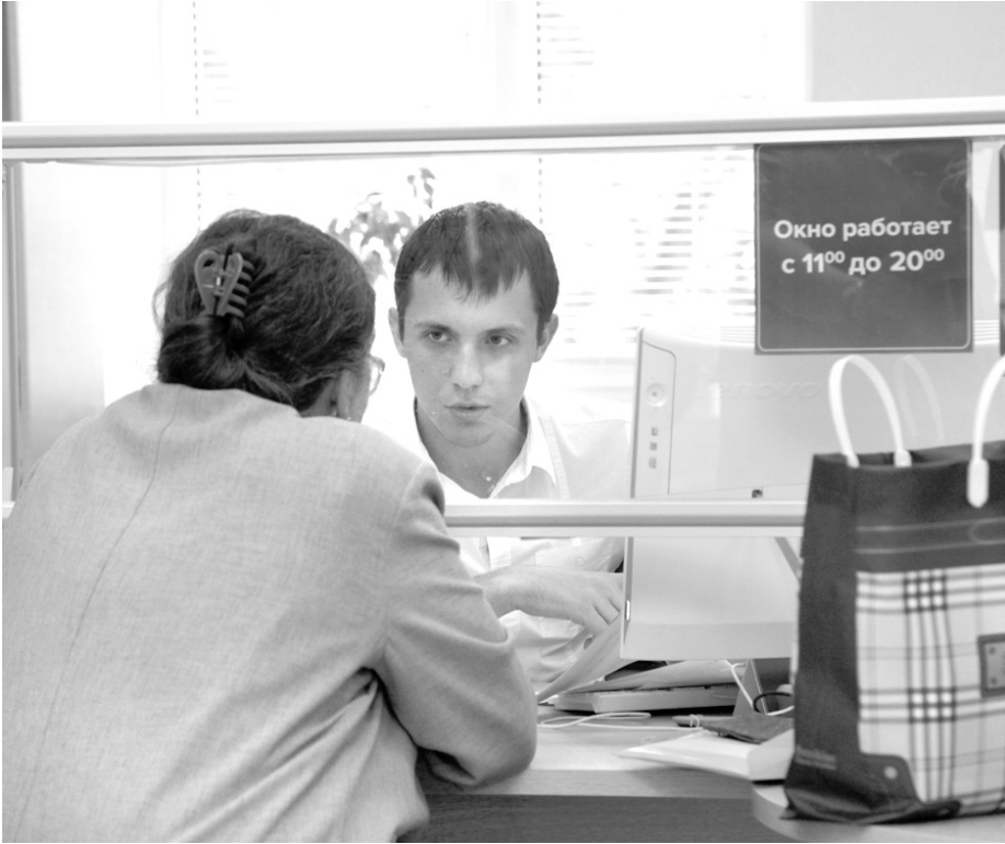
За качеством обслуживания жителей в МФЦ строго следят