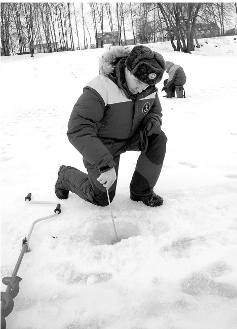
Каждые выходные специалисты замеряют толщину наледи

Зачастую любители поудить с наступлением зимы буквально утрачивают ин-