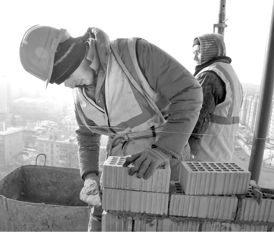
В 2015 году в Тульской области было выдано 20 тысяч патентов на трудоустройство мигрантам

Жалобы на дороговизну понятны, однако овчинка выделки стоит. Иначе не тянулись бы стройными рядами в Россию, и в Тульскую область в частности, гости из ближнего зарубежья. Так, за прошлый год в нашем регионе встали на миграционный учет более 146 тысяч иностранцев. Прирост по сравнению с 2014 годом составил 22 процента. А всего сегодня у нас гостят 68 тысяч человек. Патентов же на работу в 2015-м выдано более 20 тысяч. Такие данные по итогам