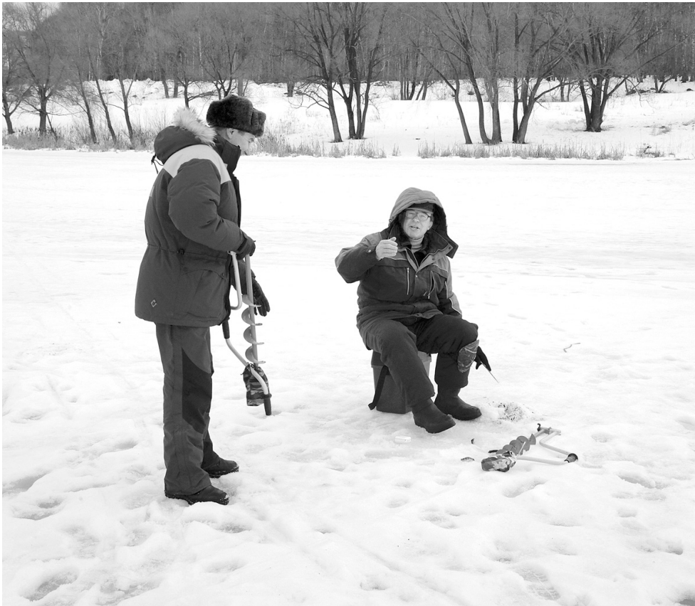
Инспекторы ГИМС регулярно напоминают рыбакам о мерах безопасности на льду

стинкт самосохранения: только ударят морозы, они выходят на промысел, забывая об элементарных мерах безопасности. Чтобы предотвратить несчастные случаи, на особо рыбные места в рейды регулярно выезжают сотрудники Государственной инспекции по маломерным судам регионального МЧС. Они проводят с удильщиками профилактические беседы и призывают их быть внимательнее.