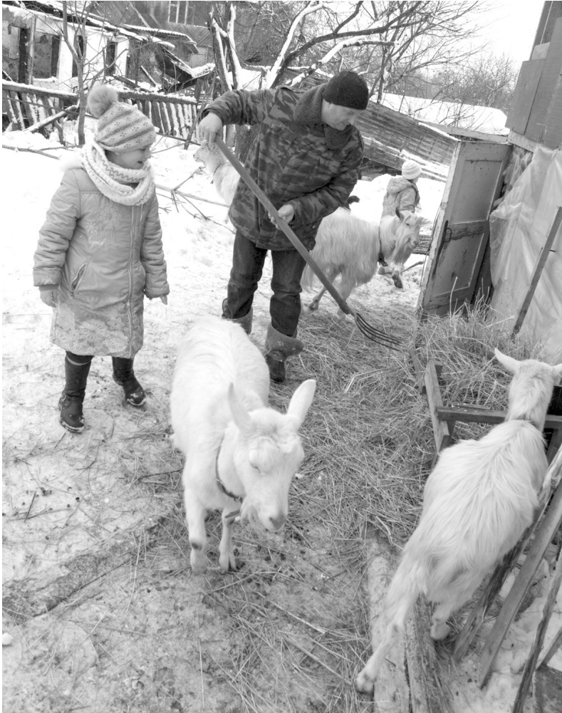
Козы не только дают вкусное молоко, но и способствуют пополнению семейного бюджета