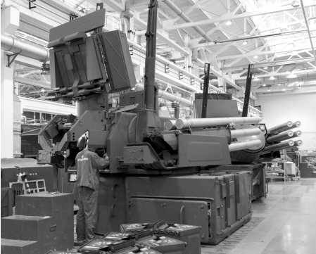
Учебные центры региона будут готовить больше специалистов для предприятий ОПК

– Знаю, что в прошлом году учебные центры уже увеличили набор, на металлообработку пришли порядка 400 человек. Но этого недостаточно. В этом году количество учебных мест существенно увеличим – по наиболее востребованным специальностям, – отметил врио губернатора.