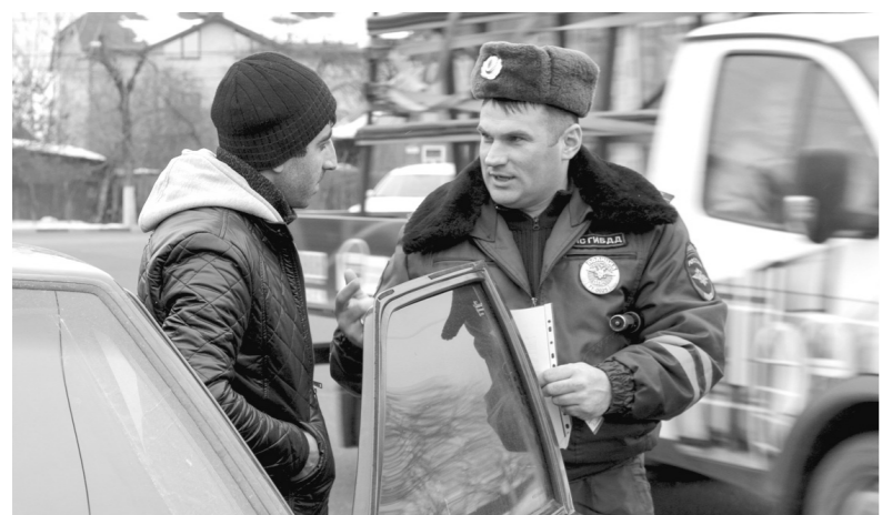
Сотрудники ГИБДД проверяли документы и выясняли, есть ли неоплаченные долги