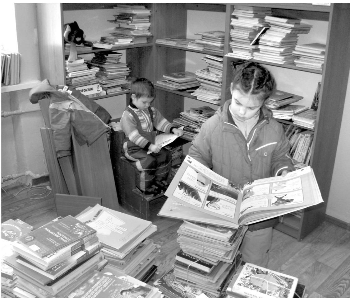
Любовь к чтению следует прививать с ранних лет

то, что задано по школьной программе. К тому же теперь библиотека – это не просто некое книгохранилище, но информационный, образовательный и досуговый центр. Мы активно сотрудничаем с детскими садами и школами, а также по программе «Доступная среда» – с детской психоневрологической больницей. Чтобы заинтересовать юных читателей, проводим встречи и выставки, всевозможные игры и конкурсы. И сейчас у нас действует экспозиция, в которой представлены работы малышей и подростков. Дети с удовольствием рисуют, изготавливают поделки по мотивам прочитанного – это могут быть и герои произведений, и отдельные сцены из них. В прошлом году, к 70-летию Великой Побе-