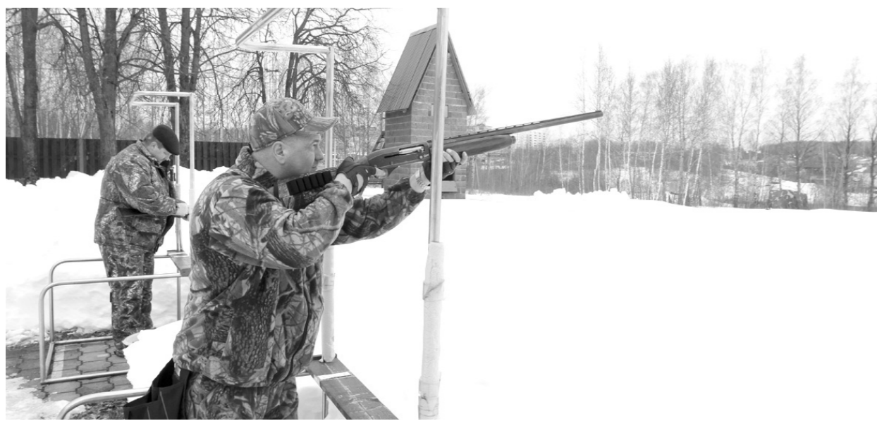
Соревнования по стендовой стрельбе – форма пропаганды занятий охотой