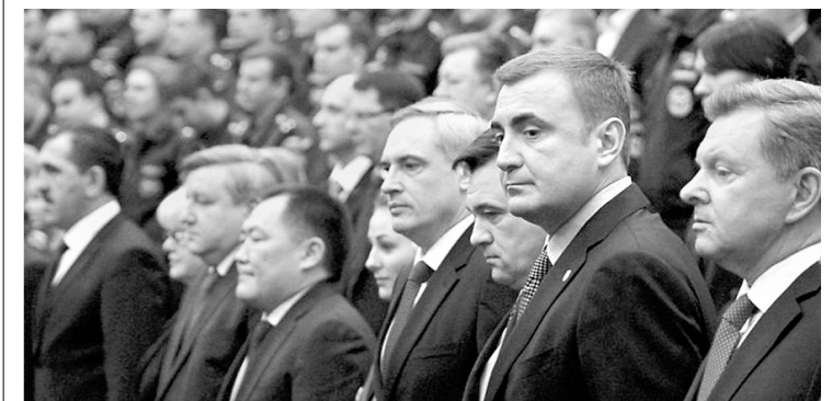
Алексей Дюмин на открытии Всероссийского сбора