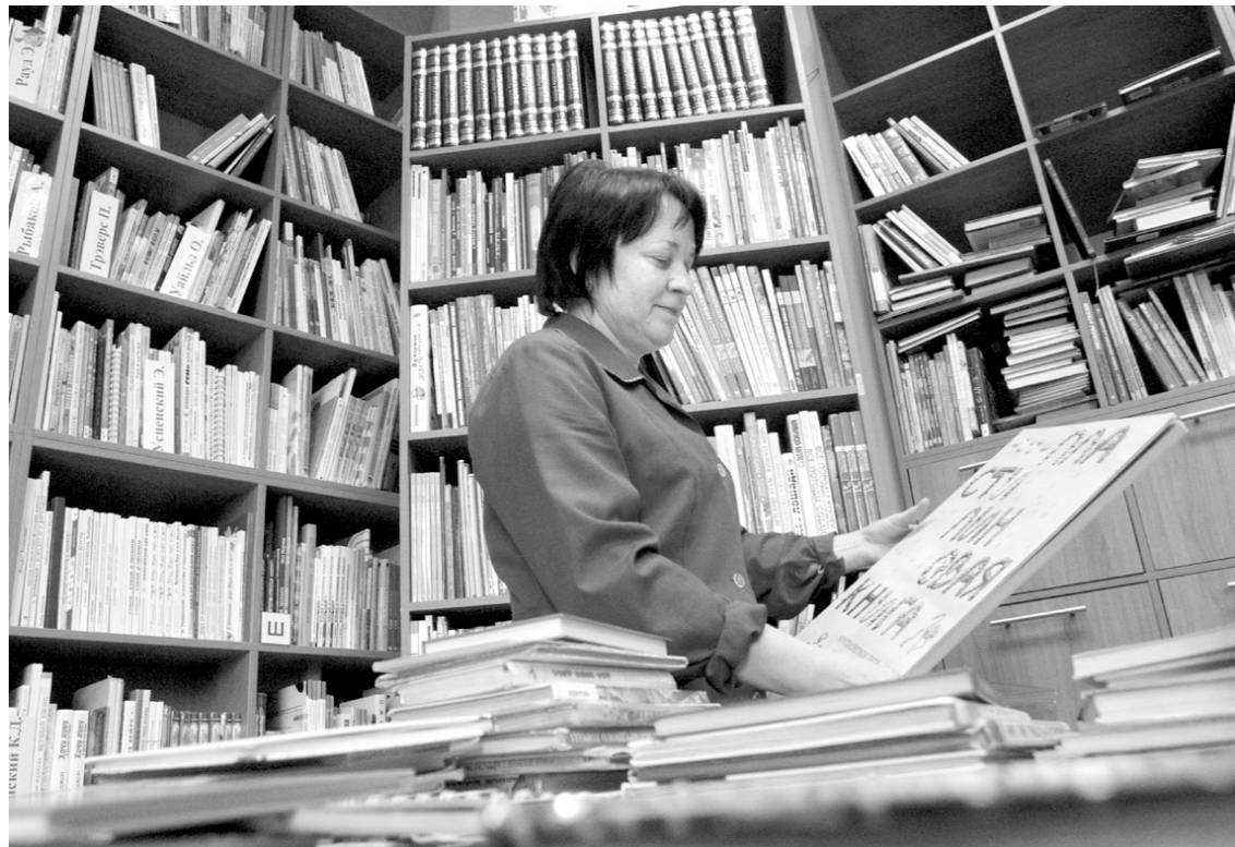
Работники библиотеки спешат расставить книги по новым стеллажам

Фонды детской библиотеки ежегодно исправно пополняются на 600 тысяч рублей, на них закупаются и появляющиеся на книжном рынке новинки, и старая добрая классика. Если же читатели вдруг интересуются произведениями, которых в библиотеке нет, ее работники тут же записывают названия книг и при первой же возможности стараются их приобрести.