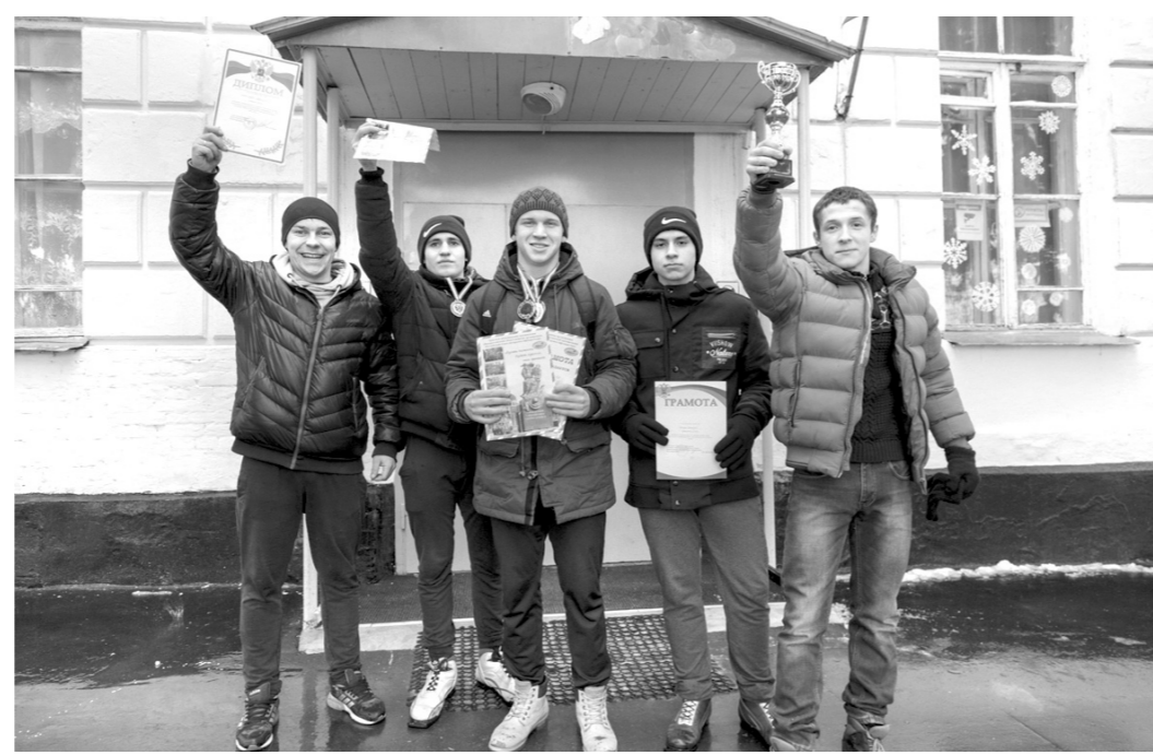
Старшеклассники школы № 4 Белева вернулись с победой в соревнованиях по полнотлону