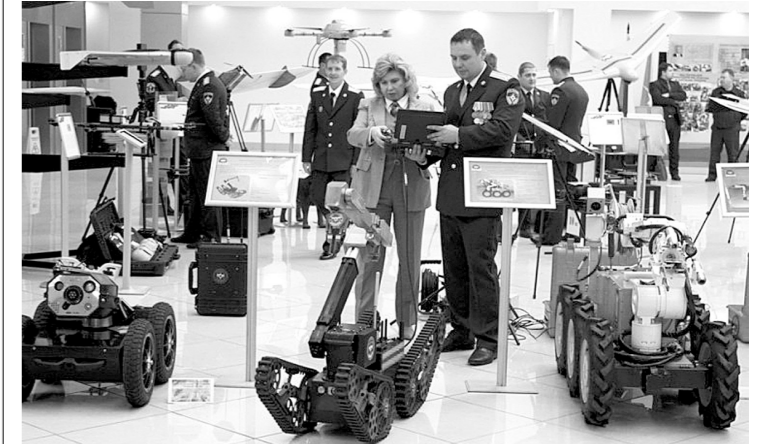
На сборе были представлены образцы робототехники, используемые подразделениями МЧС