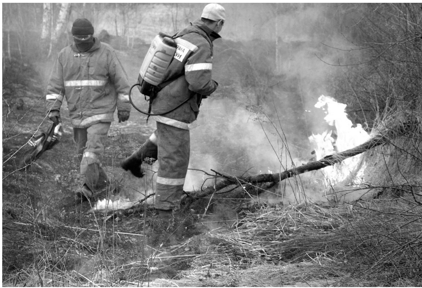
Лесные пожары наносят природе невосполнимый урон, уничтожая флору и фауну, отравляя атмосферу вредными веществами