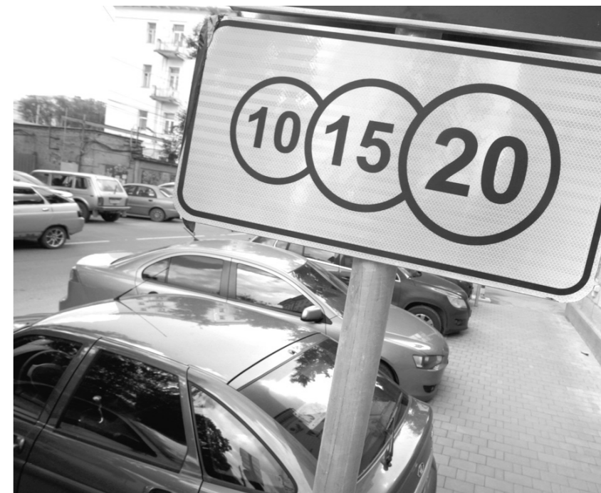
В руководстве города подчеркивают, что платные парковки – это больше социальный проект, чем коммерческий

Но основные направления расходов уже известны. – В соответствии с решением Тульской городской думы бюджета и благоустройства парковочного пространства, нанесение разметки, выплаты сотрудникам МКУ «Авто-