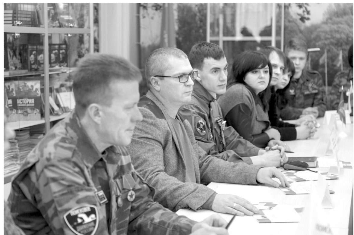
Тульские поисковики предложили Алексею Дюмину принять участие в весенней Вахте Памяти