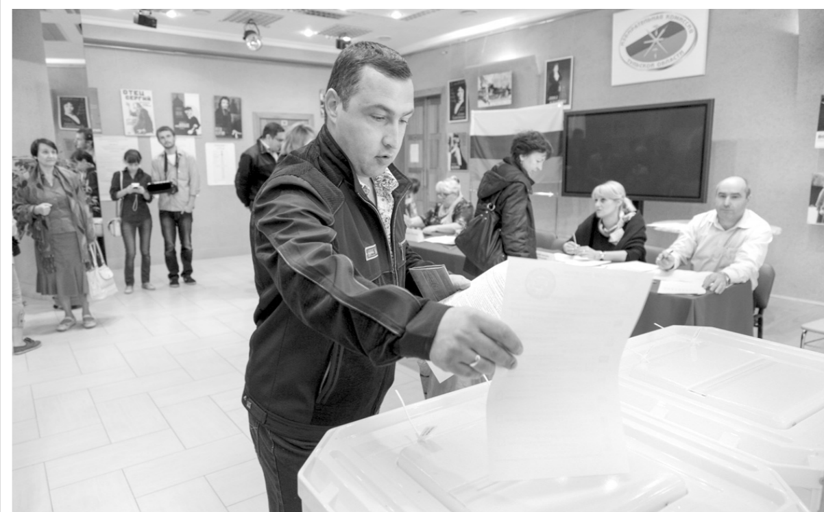
Возможности наблюдателей на выборах станут шире