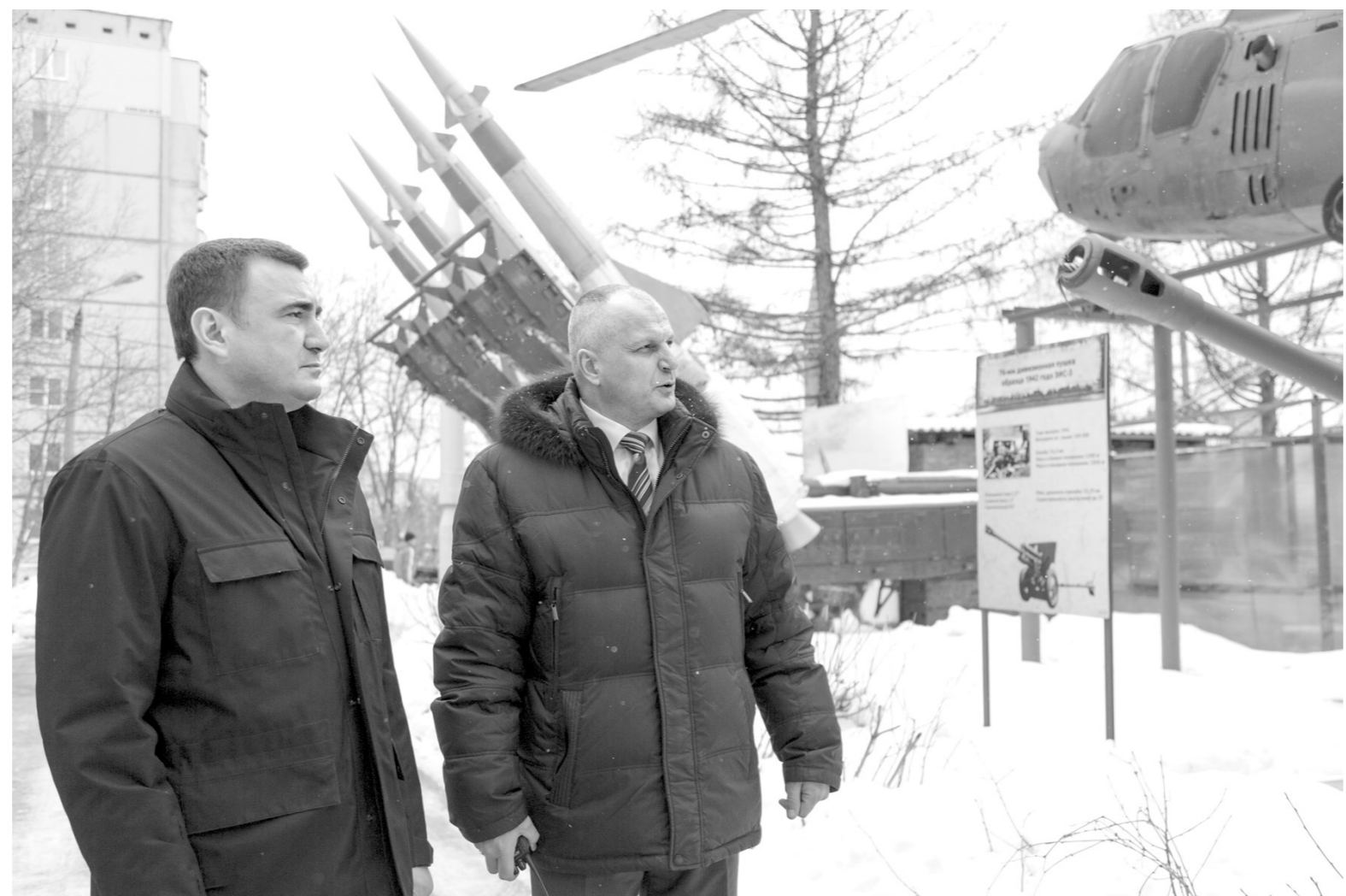
Глава региона осматривает выставку военной техники на территории центра «Искатель»

Сергей МИТРОФАНОВ Андрей ЛЫЖЕНКОВ Все фото на сайте ti71.ru