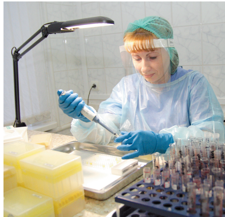
Пройти исследование крови на ВИЧ – обязанность каждого

Если ВИЧ обнаруживается у беременной женщины, ей назначается профилактическое лечение, способное защитить от инфицирования будущее дитя. Беременная принимает специальные таблетки, которые, как утверждают медики, новорожденному не вредят. В это охотно веришь, тем более что навредить больше, чем это может сделать вирус иммунодефицита, проблематично... Препараты капельно вводятся женщине и во время родов, а новорожденному сразу же дается специальный сиропчик. Результат обнадеживает: в Российской Федерации врожденная ВИЧ-инфекция