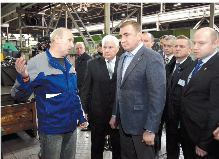
На экскурсии по цеху тормозных цилиндров

На самом деле все обстоит ровным счетом наоборот. По словам Плюханова, на предприятии разработаны и запущены в серийное производство изделия именно для вагонов нового поколения. Это тормозные цилиндры 002 и 008, произведенные по международному стандарту UIC 542. Кроме того, российской железной дороге «Трансмаш» мог бы предложить и другую перспективную продукцию: воздушные резервуары объемом 77 литров и диаметрами от 300 до 450 миллиметров, выполненные по стандарту UIC 541-07. Просто перейти на внутреннего потребителя не так-то легко.