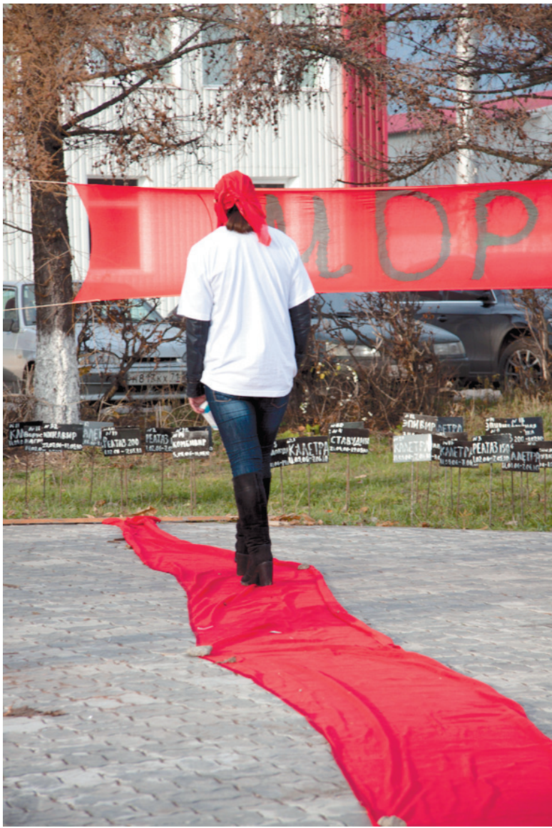
Красная лента – символ скорби и сочувствия жертвам СПИДа

Состояние это, мягко говоря, не из приятных. Организм теря-