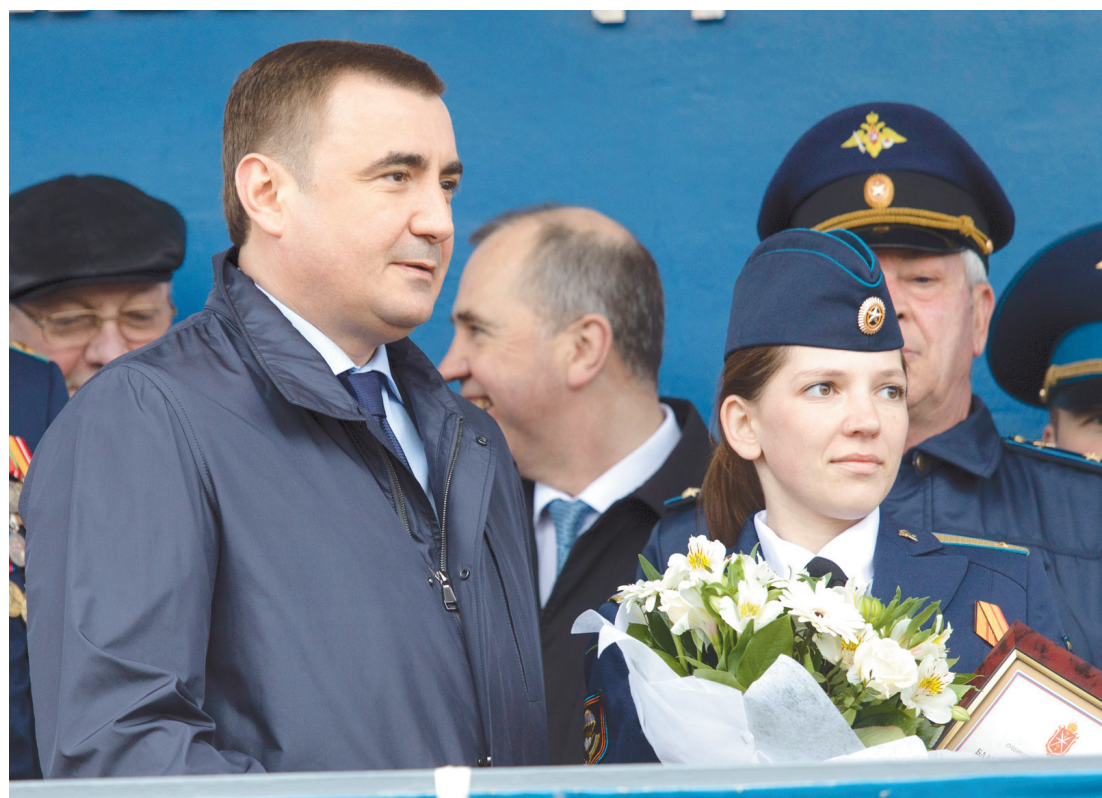
Алексей Дюмин вручил награды лучшим десанникам