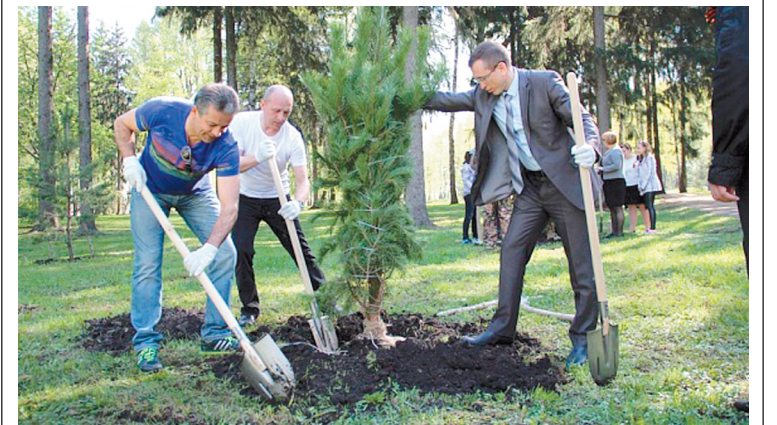
Зеленый фонд Новомосковска пополнили несколько десятков сосен и елей

40 голубых елей и сосен пополнили зеленый фонд Новомосковска. Деревья высадили в рамках акции «Кислород – городам!» вдоль Паркового проезда.