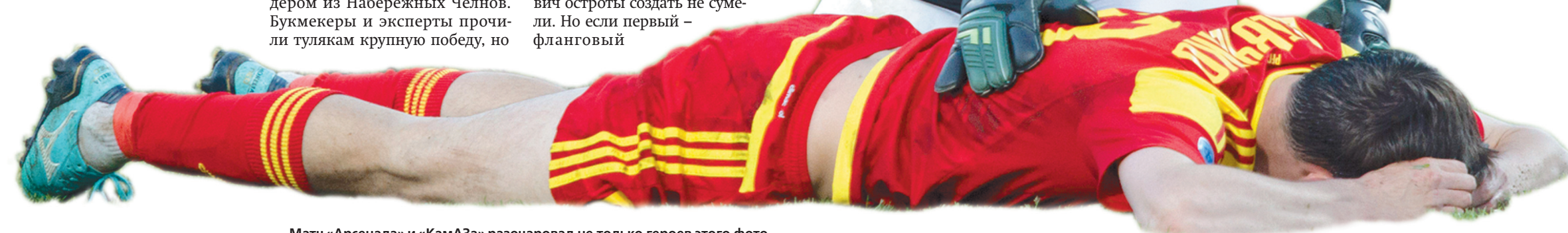
Матч «Арсенала» и «КамАЗа» разочаровал не только героев этого фото

– Болельщиков, которые нам свистели, можно понять. Они ждут от нас более результативной игры, более красивой. Но сегодня на первое место вышел результат. Надеюсь, что в дальнейшем будем больше забивать голов. Но такие матчи тоже бывают, прошу прощения и хочу, чтобы они нас тоже поняли и не ругали в такие моменты.