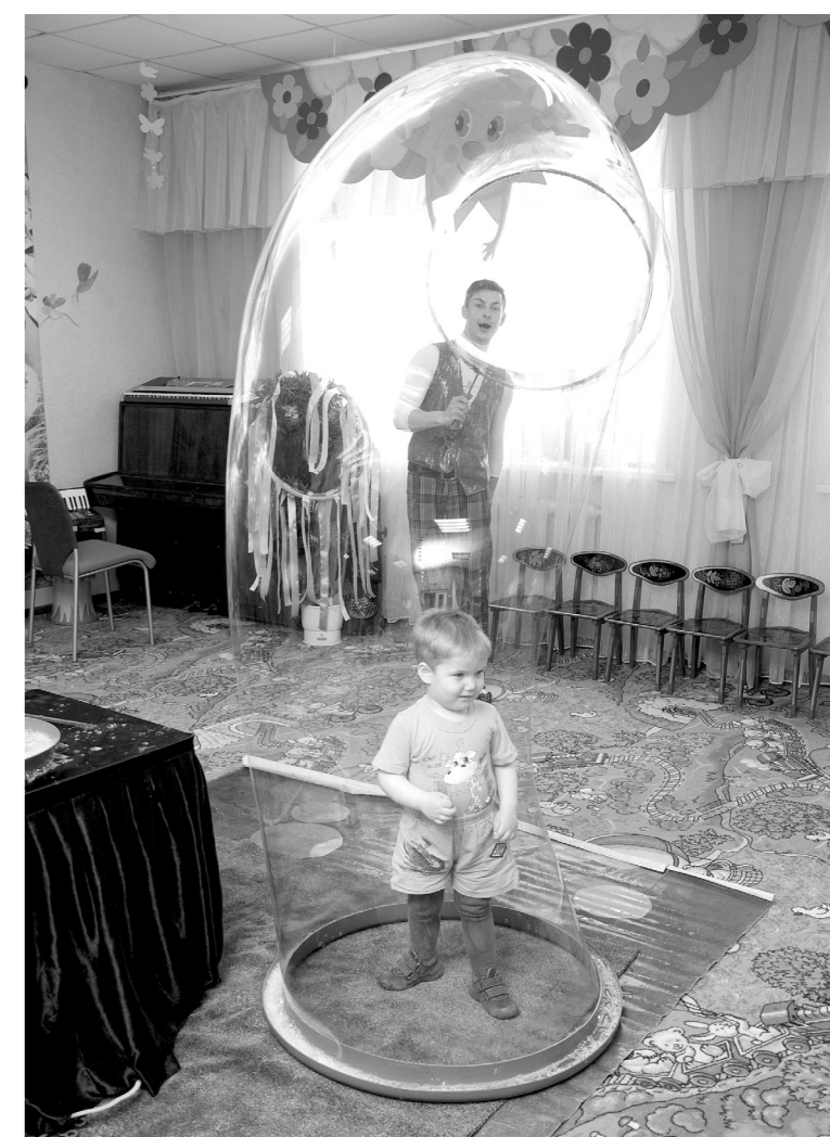
Таким малышам шоу кажется самым настоящим чудом

ских больниц. На базе хосписа и трех детских лечебных учреждений организованы выездные патронажные бригады паллиативной медицинской помощи. Создана база данных о детях, нуждающихся в таком виде услуг. В Тульском областном хосписе работает круглосуточная горячая линия по вопросам обезболивания и паллиативной помощи: 8 (487-51) 3-31-87, 8 (487-51) 3-31-88.