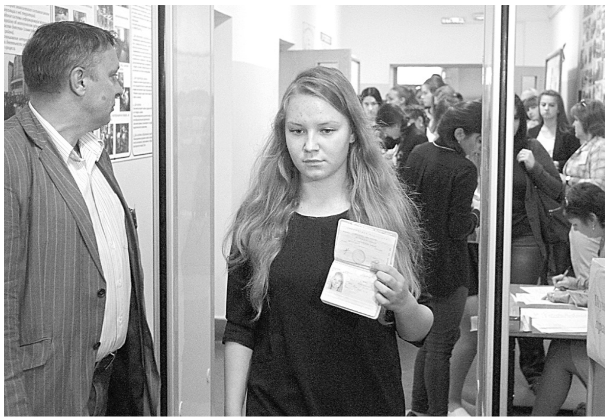
Прежде чем попасть на экзамен, школьники проходят несколько этапов контроля