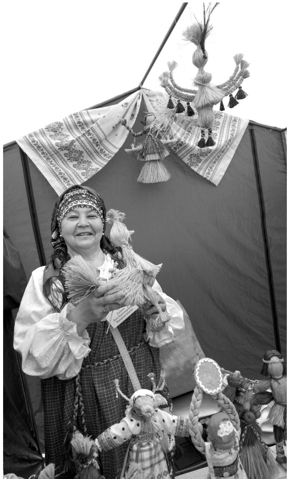
Игрушка из соломы, так непохожая на современные

Татьяна МОТОРИНА Андрей ЛЫЖЕНКОВ Все фото – на сайте «ТИ»