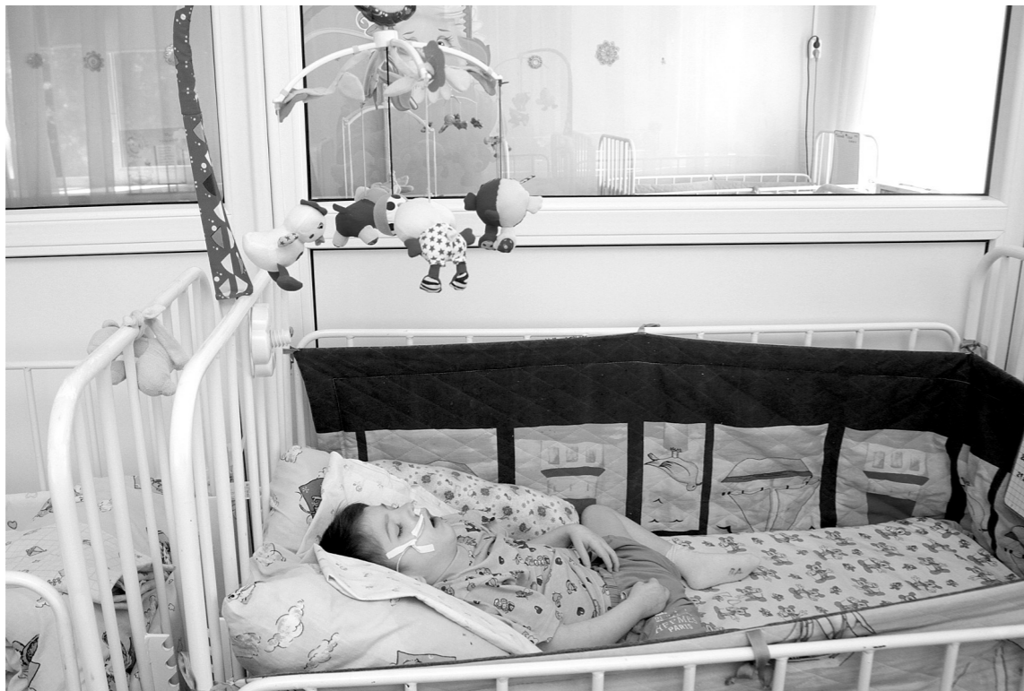
Ни минуты без помощи

Тульский областной специализированный дом ребенка № 1 (официальное наименование учреждения) был открыт для детей-сирот 90 лет назад. За это время около 20 тысяч детей с рождения и до 4 лет, сменяя друг друга, нашли здесь свой первый дом. Здесь они учились улыбаться, ходить, говорить, а маму им заменяли врачи, воспитатели и медсестры. Здесь всеми силами старались создать для воспитанников условия, приближенные к домашним. И то, что малыш при виде сотрудницы учреждения привычно тянет вверх ручонки – дескать, возьми меня, говорит о том, что в отличие от многих