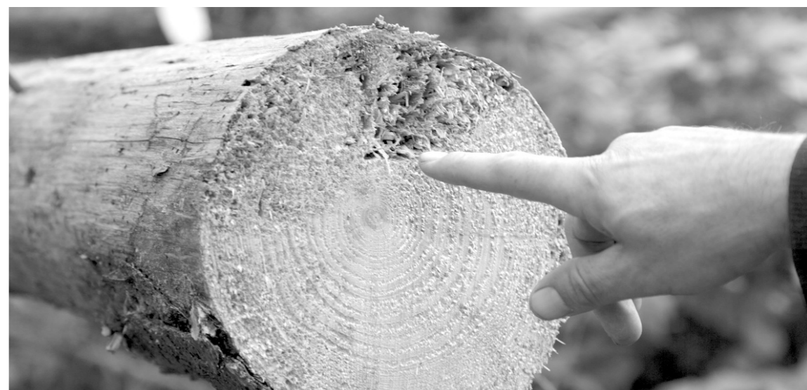
Лес в Алексине атаковал короед-типограф

По всем вопросам выруб лес в Алексине можно обращаться по телефону в Алексинское лесничество – 8 (48753) 6-27-90. Кроме того, работает круглосуточный телефон службы лесной охраны – 8-800-100-94-00.