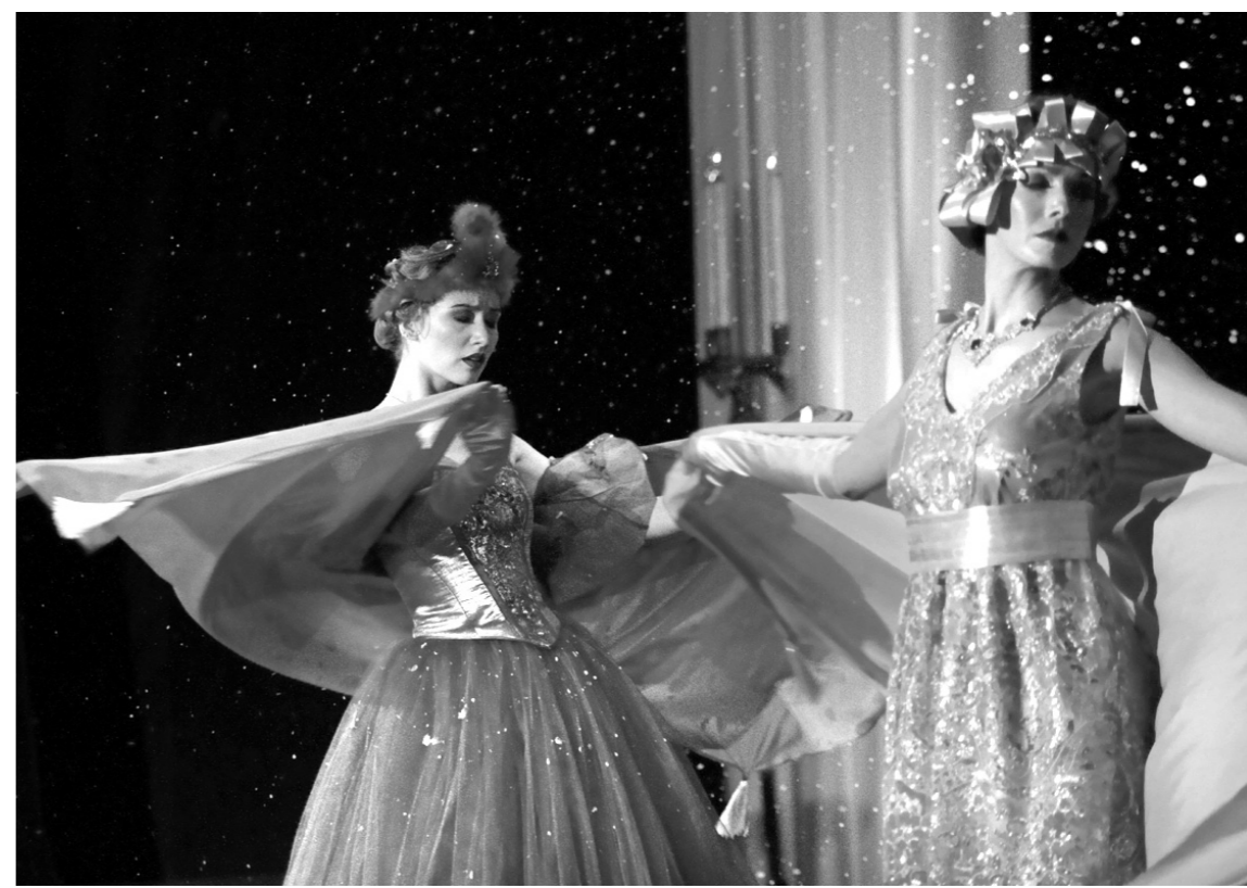
Синие цветы на снегу

Кроме прочего, здесь можно было поиграть в старинные игры. Праздник получился душевным и каким-то цельным, что ли. Но после осталось смутное ощущение, что все это было лишь отголоском чего-то, что гораздо глубже и интереснее. Для тех, кто почувствовал то же или пропустил фестиваль, но хочет познакомиться с народной игрушкой, существует Центр народного творчества, о котором мы уже упоминали. Здесь можно посетить выставки и записаться на мастер-классы, посвященные этой теме.