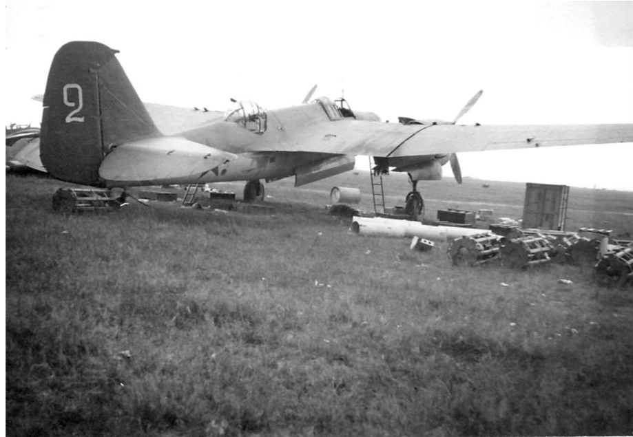
Наши земляки приступили к изучению истории фронтовых аэродромов на территории Тульской и Калужской областей