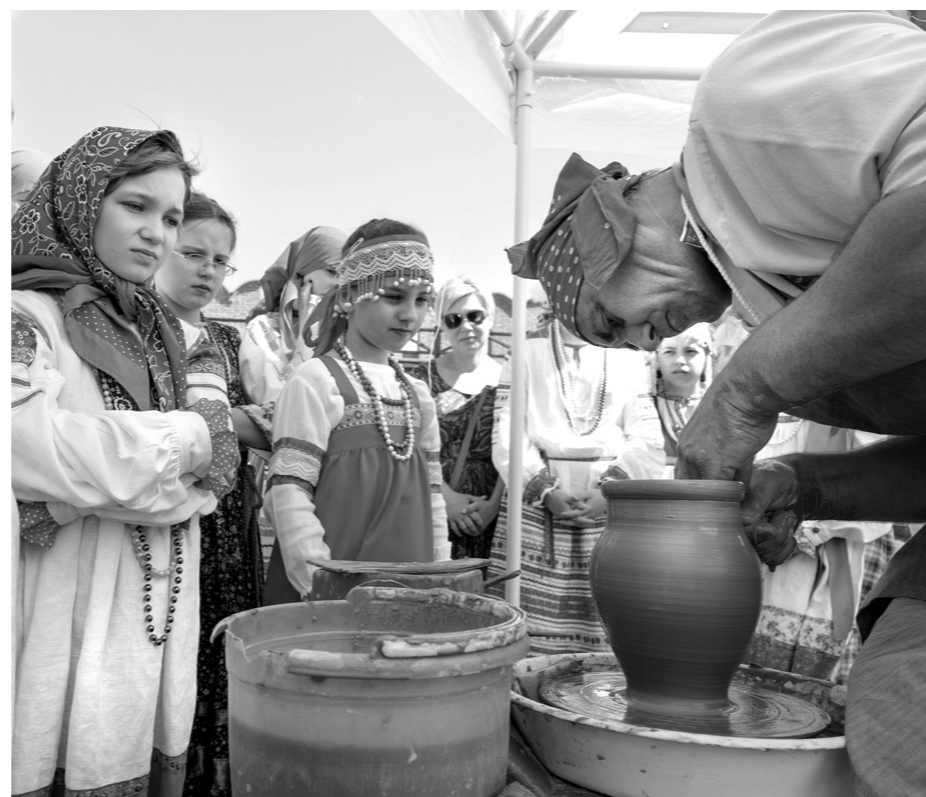
Мастер-класс по керамике: шедевр из куска глины

После осталось смутное ощущение, что все это было лишь отголоском чего-то, что гораздо интереснее. Для тех, кто почувствовал то же или пропустил фестиваль, но хочет познакомиться с народной игрушкой, существует Центр народного творчества.