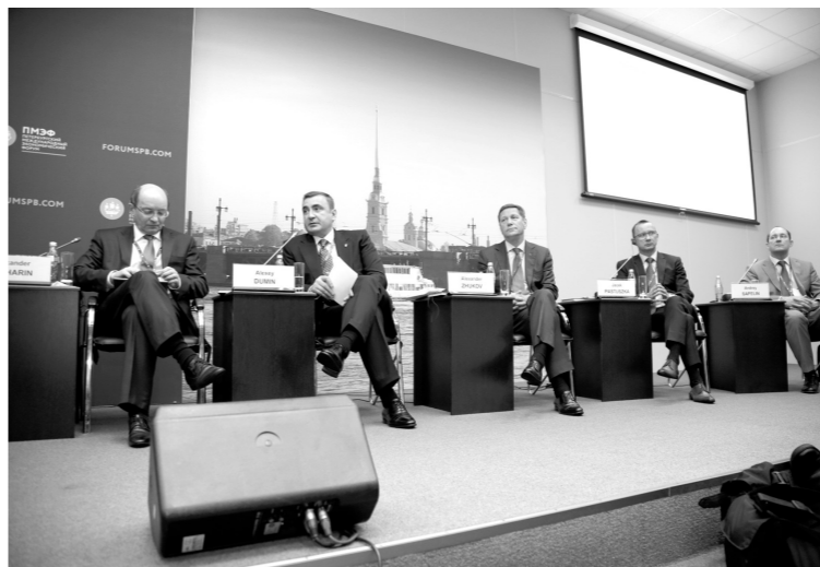
Алексей Дюмин рассказал об опте нашего региона

Алексей Дюмин поделился с собравшимися опытом Тульской области, которая, по его словам, сейчас работает по всем фронтам. – Мы наделены на диверсификацию экономики, на этом пути уже достигнуты достаточно хорошие результаты. Пять лет назад на долю пяти основных отраслей промышленности у нас приходилось 85 процентов, а