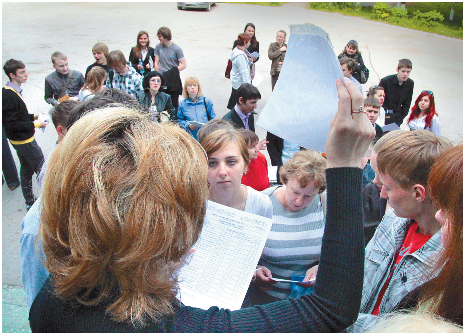
ЕГЭ существует уже 15 лет и сильно изменился за это время

Предмет, название которого с греческого переводится как «природа», среди тульских выпускников по популярности остается на уровне прошлого года. И это несмотря на курсы подготовки, ко-