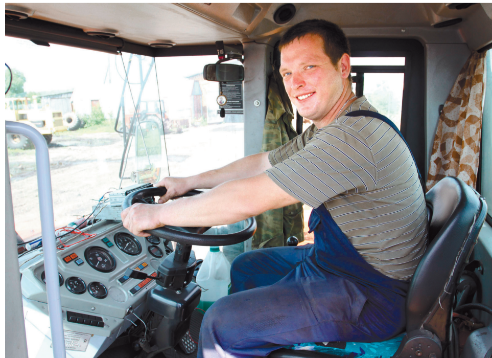
Работа в «Кудашево» привлекает молодежь со всех уголков района. Что привлекает, спросите? Во-первых, человеческое отношение к ним, во-вторых – зарплата, в-третьих – хорошая техника