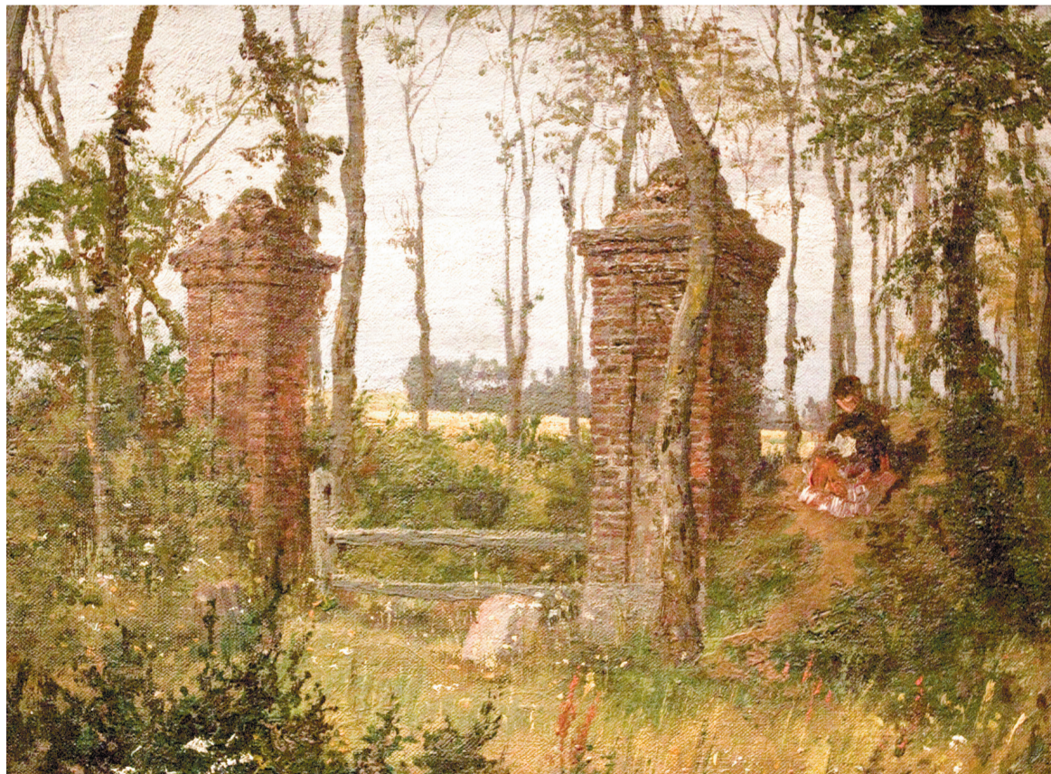
Старые ворота. Вель. Нормандия

«Франция вошла в его сердце через красоту старых замков, суровые ландшафты Нормандии. И когда молодой художник путешествовал по этой стране, он сделал множество зарисовок – получился своеобразный дневник...»