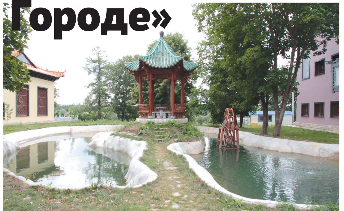
Китайские мотивы «Золотого Города»

Одна из них – сугубо медицинская, чтобы люди могли не толь-