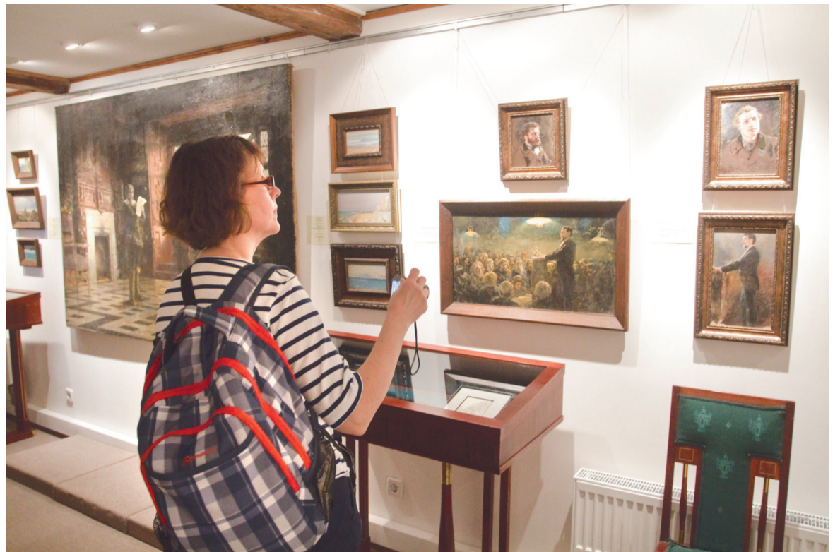
На выставке «Василий Поленов и Франция» представлена живопись и графика из фондов музея

– Франция вошла в его сердце через красоту старых замков, суровые ландшафты Нормандии, –