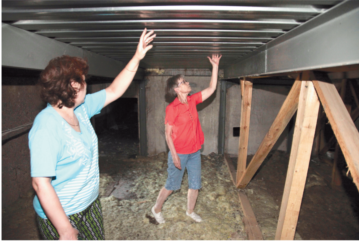
Плиты перекрытия держатся на кирпичах и деревянных подпорках...

– Где здесь комиссия из Тулы? Дайте я все расскажу и квартиру свою покажу! – пробивается сквозь толпу женщина в белоснежном платочке. – Ремонт сделать невозможно. Обои к стенам