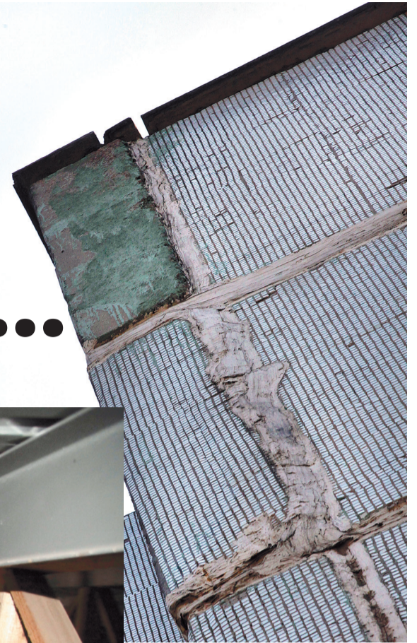
...швы кое-как замазали, но проблемы это не решает