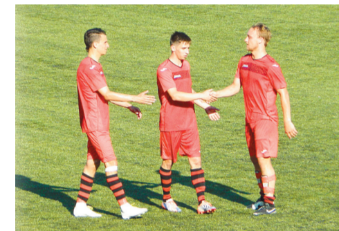
Новомосковцы отдали все силы, чтобы выстоять в матче с лидером

Новомосковский «Химик» продолжает уверенное выступление в зоне «Черноземье» третьего дивизиона. В матче 8-го тура красно-черные притормозили дома «Ротор-Волгоград-2».