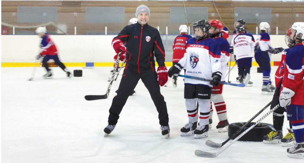
Около 80 ребят работают под началом восьми тренеров

Самому старшему из восьми наставников, под чьим началом занимаются хоккеисты, – только 28 лет. Все они воспитанники разных клубов, но при этом – друзья детства. Один из них и решил создать школу «Реванш», а затем подтянул в нее своих товарищей.