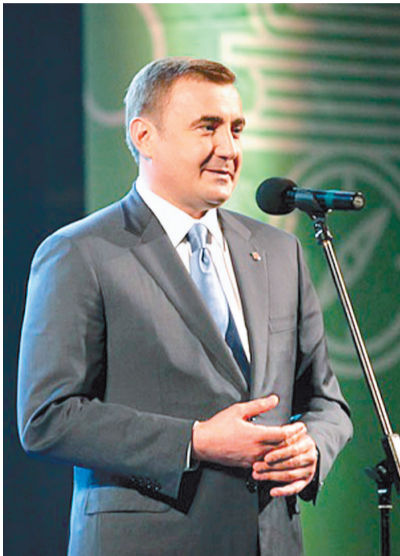
Медалистов нашего региона лично поздравил врио губернатора Алексей Дюмин

Этот концерт проходил в ДКЖ с полным аншлагом – со сцены танцевальные и вокальные коллективы поздравляли выпускников-медалистов.