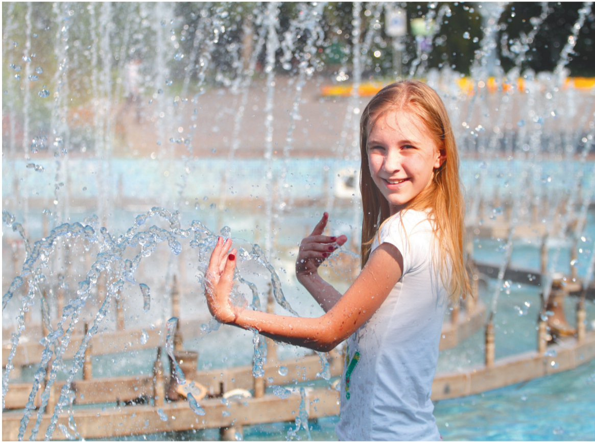
Все мы в душе немножко дети, особенно при возможности искупаться в фонтане в жару

Жара сводит с ума. С середины июня в Туле столбик термометра держался у отметки +30 °С на протяжении недели. Недолгое облегчение принесли ночной дождь и дневная облачность. Но синоптики предупреждают: расслабляться не стоит. Температурные рекорды этого года еще не побиты.