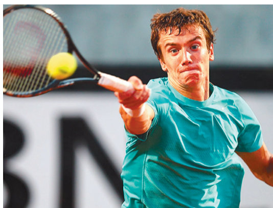
В том, что Андрей Кузнецов выступит на Олимпиаде, уже нет сомнений