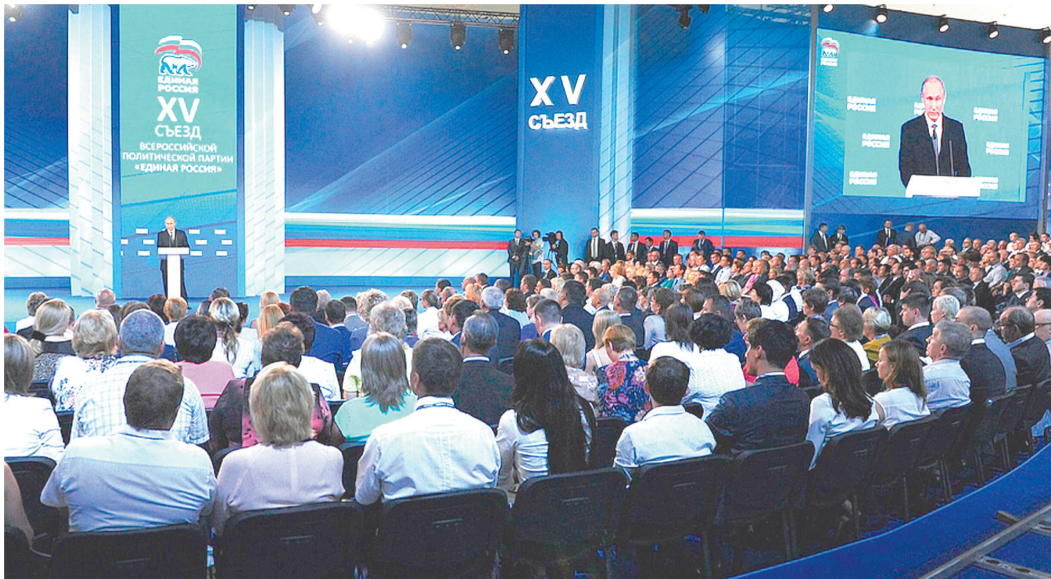
На Съезде «Единой России» глава государства напомнил, что «сам и инициировал, и создавал эту партию»