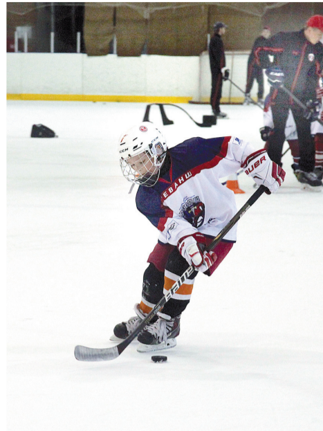
Без умения вести шайбу сильного игрока не получится