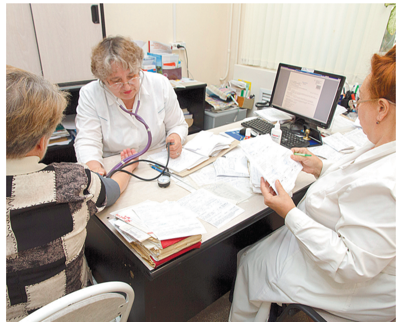
Задача медико-социальной экспертизы – выяснить, есть ли возможность вернуть человека с нарушениями к полноценной жизни

– Медико-социальная экспертиза проводится специалистами бюро (Главного бюро, Федерального бюро) путем обследования гражданина, изучения представленных им документов, анализа