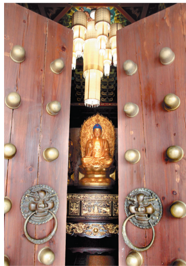
Вместе с международным центром в «Золотом Городе» будет открыт Центр Шаолинской культуры

– Повторюсь, что «Золотой Город» задумывался как уникальный уголок Китая в России. Сейчас это стремление только углубится и расширится. Вы знаете, например, что подписан меморандум о намерении открыть Центр Шаолинской культуры в Тульской области? После Америки и Герма-