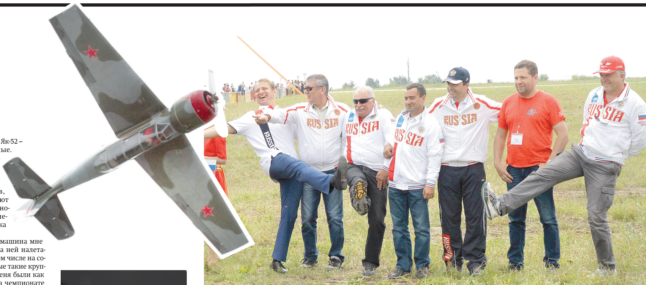
Сборная России после награждения

После награждения призеров туляки смогли насладиться грандиозным авиашоу, на котором чемпионы показали свое мастерство в небе.