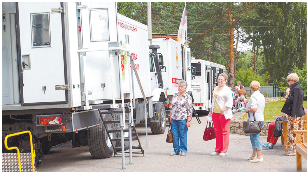
В грузовиках-гигантах размещено современное медицинское оборудование