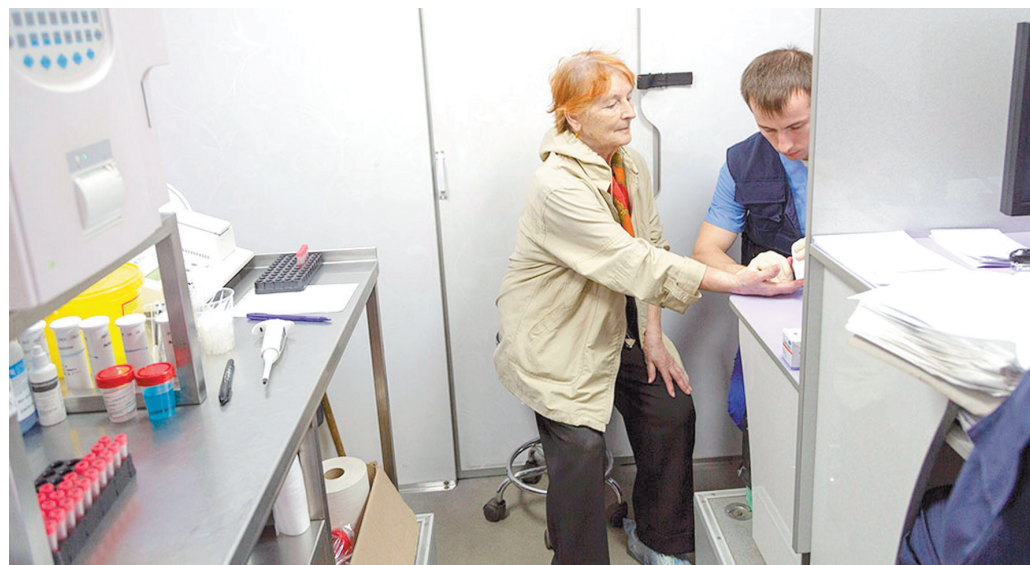
В передвижной лаборатории можно делать самые разные исследования: от общего анализа крови до биохимии