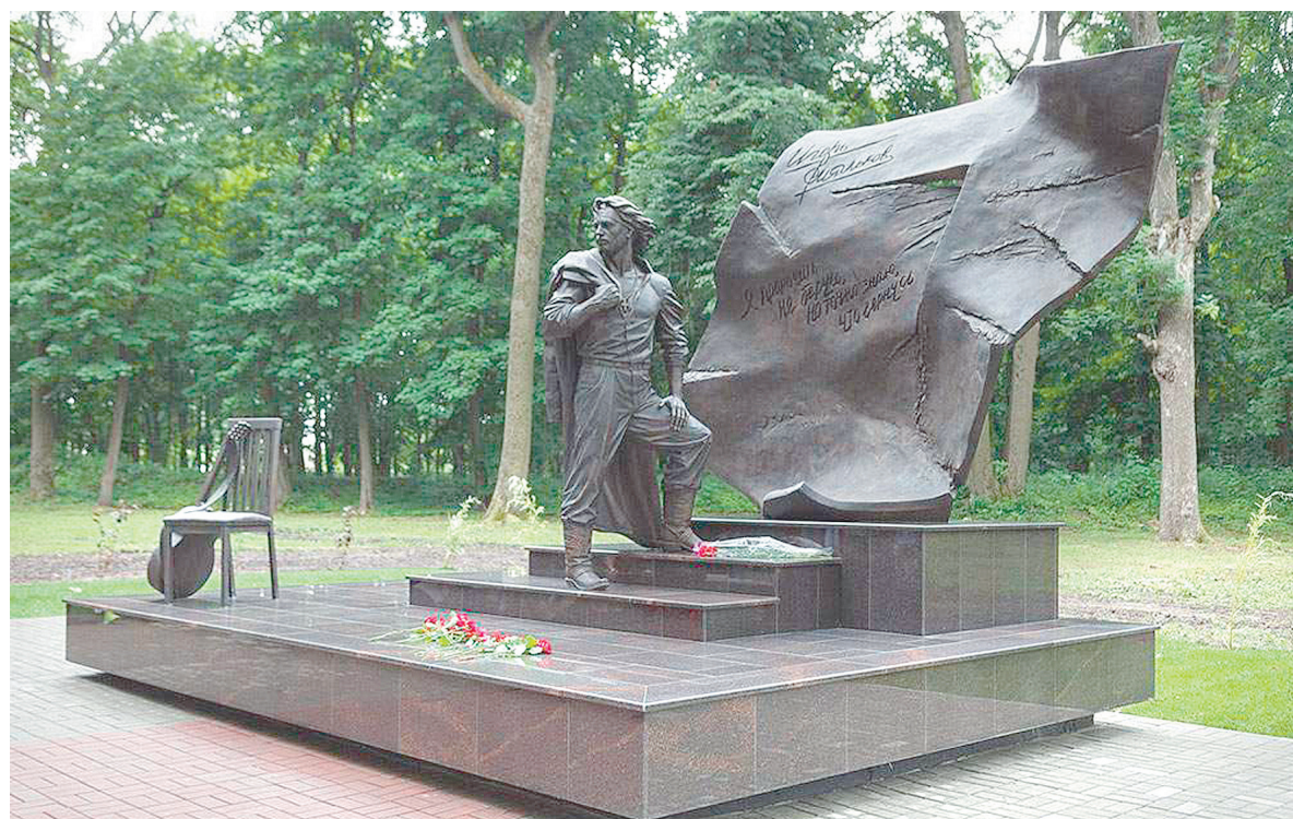
Памятник Игорю Талькову установили в Щекинском городском парке