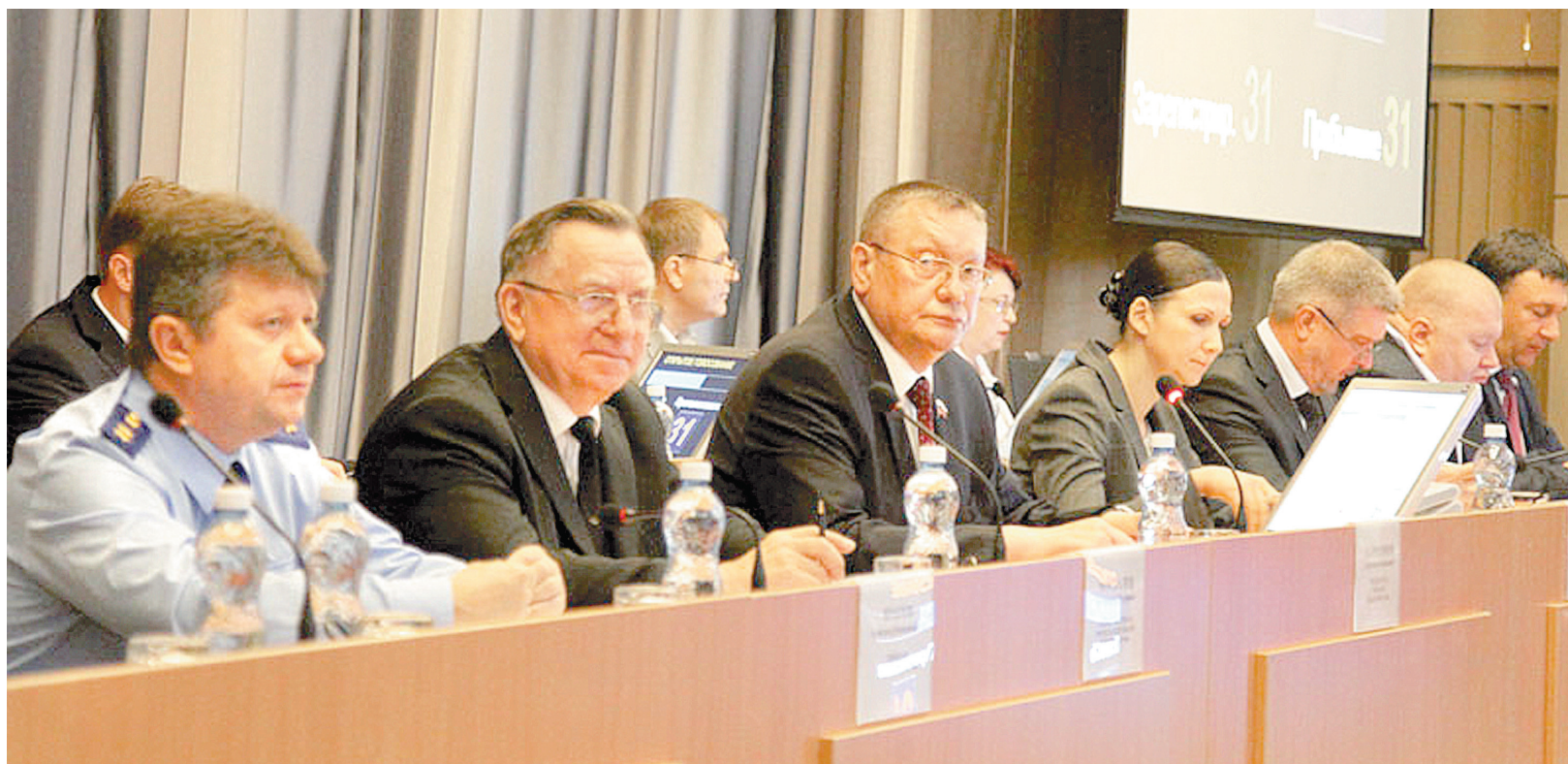
В весеннюю сессию – 2017 областные парламентарии приняли 61 закон

За лето народные избранники намерены детально разобраться в вопросе, чтобы уже осенью, если потребуются законодательная инициатива, вынести его на заседание Думы. – Решение принято правильное. Если мы инициируем санкции, то