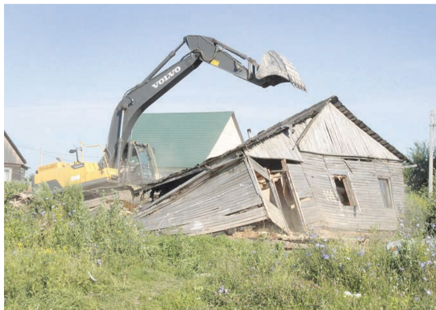
Пять построек в Хрущеве пришлось снести

17 незаконных строений на Косой Горе и в примыкающей к ней лесной зоне