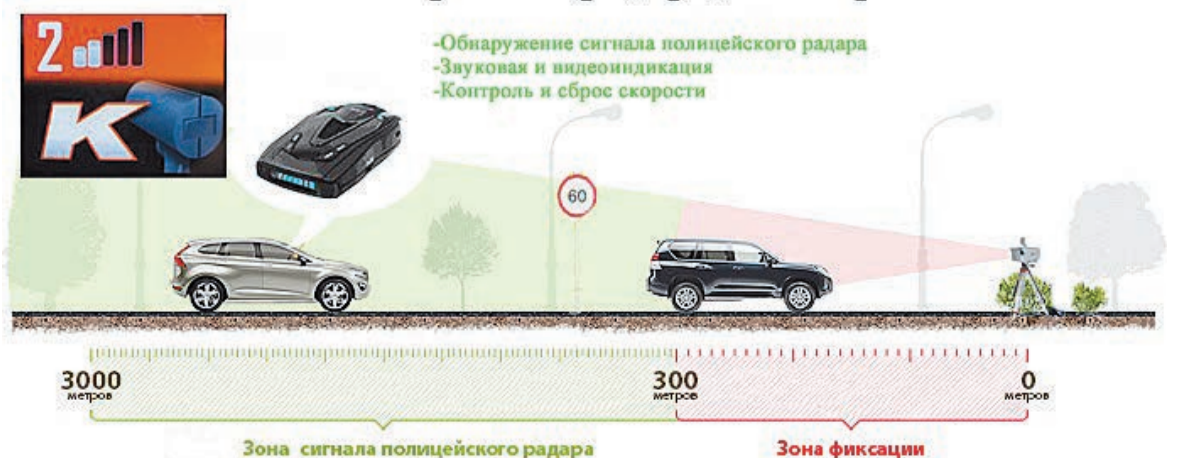
Схема работы радар-детектора

Радар-детектор не панацея от измерителей скорости, и дополнительные жизни он не дарит. Прежде всего это действенный помощник для водителя. Функция радар-детектора – помочь человеку получить нужные данные для безопасного движения в конкретном месте, выделяя их из общего информационного потока на дороге. Даже при наличии в машине радар-детектора не стоит идти поперек здравого смысла и бездумно нарушать скоростной режим, а тем более ездить с той скоростью, с которой вам хочется, – здесь радар-детектор не поможет, а вот кошелек защитит от непредвиденных трат ему вполне по силам.