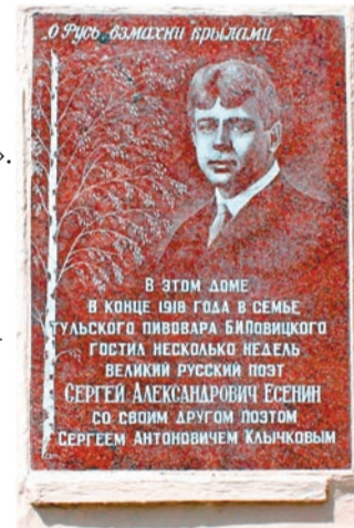
Памятная доска на здании по улице Коминтерна