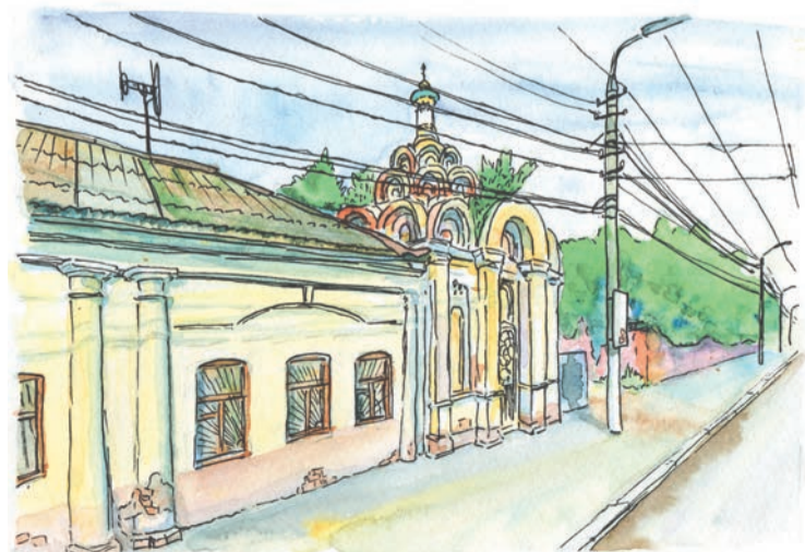
С часовней на улице Металлистов связана одна из городских легенд

...У каждого дома на этой улице – не важно, отреставрирован его фасад или нет, блещет ли он великолепием или вызывает о помощи – своя неповторимая история, свое прошлое, свое завтра.