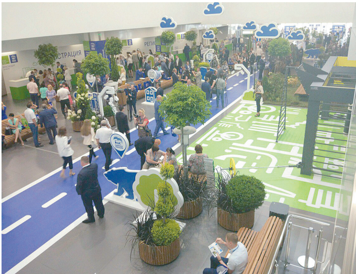
Варианты того, какой должна быть комфортная городская среда, делегатам форума наглядно представили на макетах и стендах, смонтированных в выставочном комплексе «Экспоград Юг»

Работа в регионах кипит. Изменить облик городов предполагается за пять лет. Проект разделен на два этапа, один из которых ограничивается 2017 годом, а второй, основной, рассчитан на 2018–2022 годы. В Тульской области в этом году в проекте участвуют девять муниципалитетов, а общее финансирование составляет более 500 миллионов рублей. По итогам общественного обсуждения в муниципальные программы включены 206 дворовых (369 МКД) и 31 общественная территория. Приоритет отдан работам по благоустройству дворов и общественных пространств, то есть центральных улиц, скверов, парков и площадей. Напомним, что существует два перечня работ: минимальный и расширенный. К первому относятся ремонт дворовых проездов, освещение