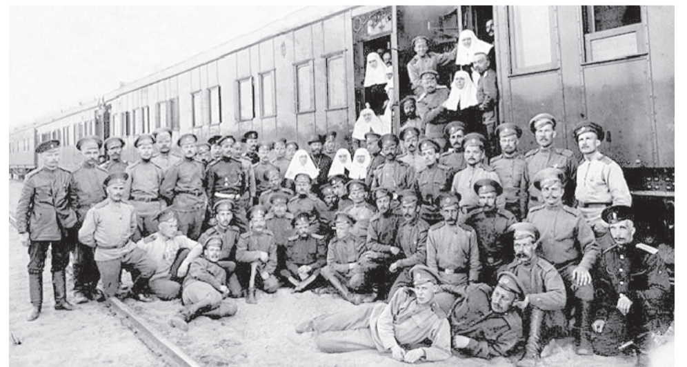
Сергей Есенин (лежит на переднем плане) среди военнослужащих санитарного поезда