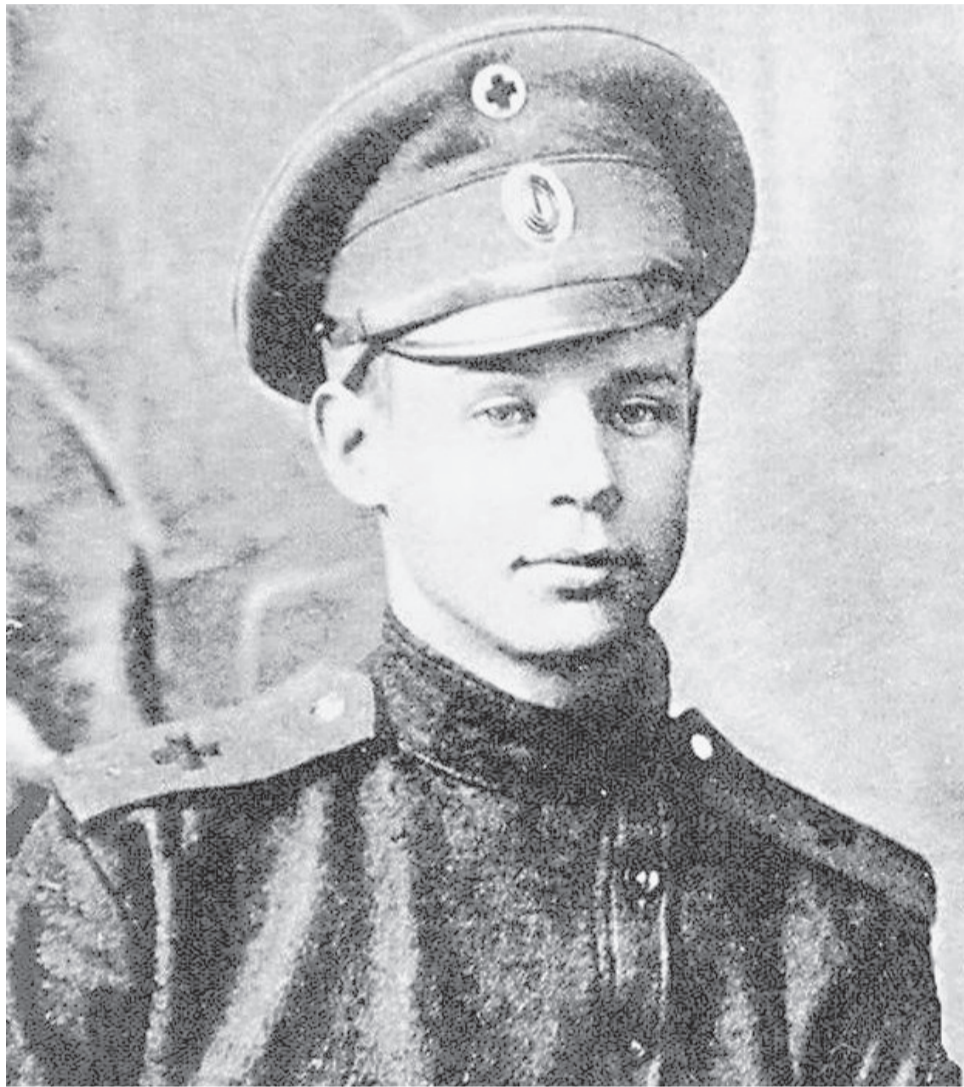
Таким был Есенин, когда впервые приехал в Тулу

Сергей Есенин – почти тульский поэт. И дело даже не в том, что, если вы спросите десять человек на улицах Тулы, чьи стихи им по душе, то половина наверняка назовет его имя. Просто от его родного рязанского села Константиново до наших мест недалеко – может, поэтому образы и звуки есенинской поэзии близки и туляку. Впрочем, и бывал он у нас нередко.