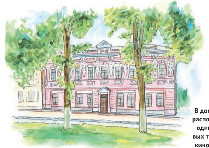
В доме № 25 располагался один из первых тульских кинотеатров