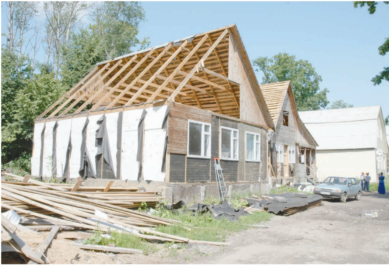
Большую часть строений цыгане разбирают самостоятельно