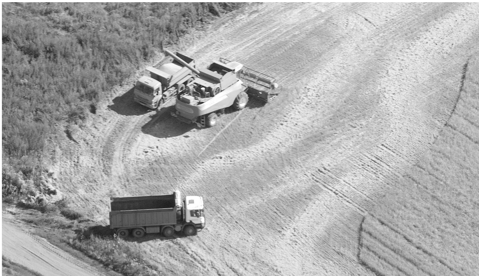
По производству зерновых наша область намерена удержать ранее завоеванные позиции

Все помнят небывалый взлет цен на гречку, произошедший