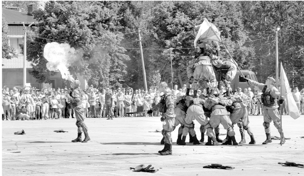
Десантники владеют не только оружием, но и акробатическими приемами