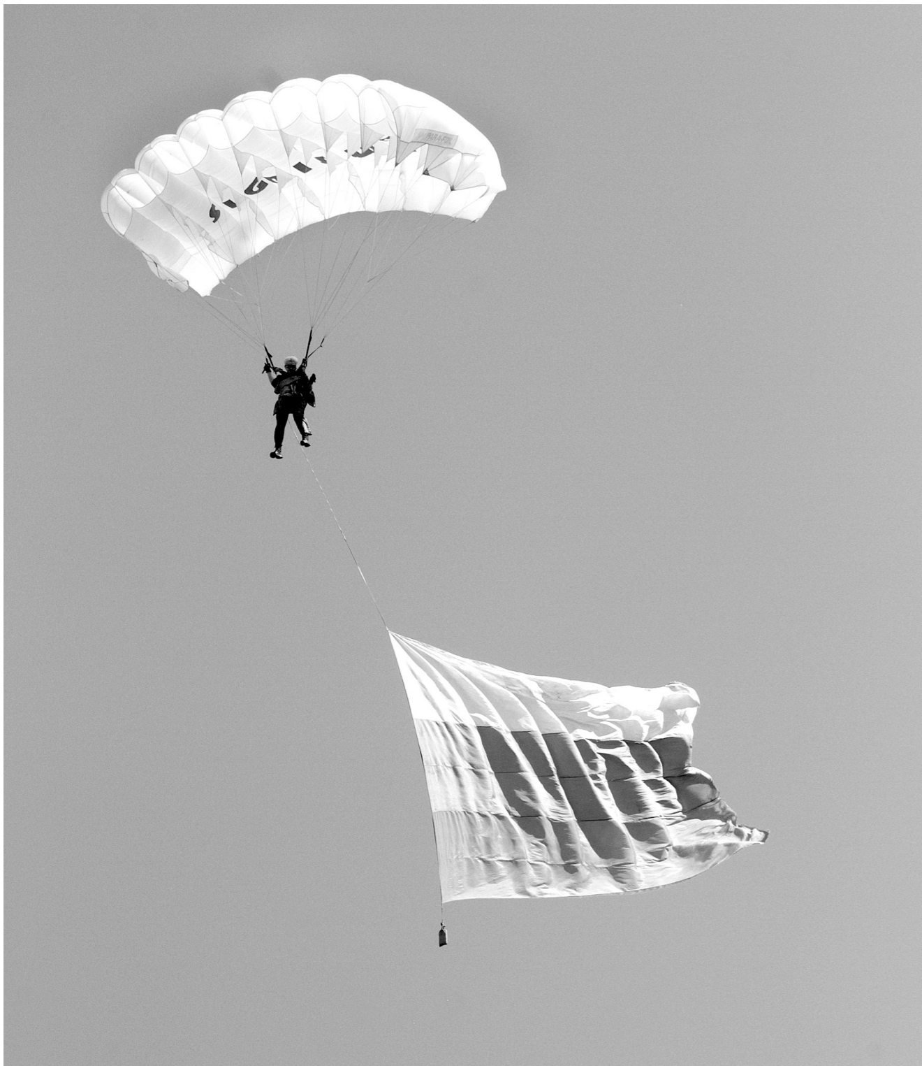
Десантирование парашютистов – главный элемент праздника