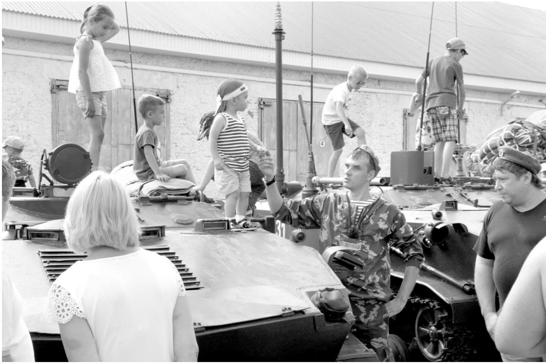
Военная техника заинтересовала детей