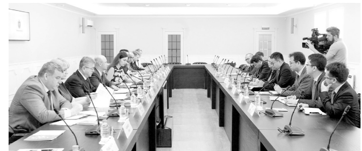
Представители областного правительства и компании China Poly Group обсудили вопросы взаимодействия в нескольких сферах экономики

В Корпорации развития Тульской области прошло заседание рабочей группы по вопросу взаимодействия регионального правительства и китайской компании China Poly Group.