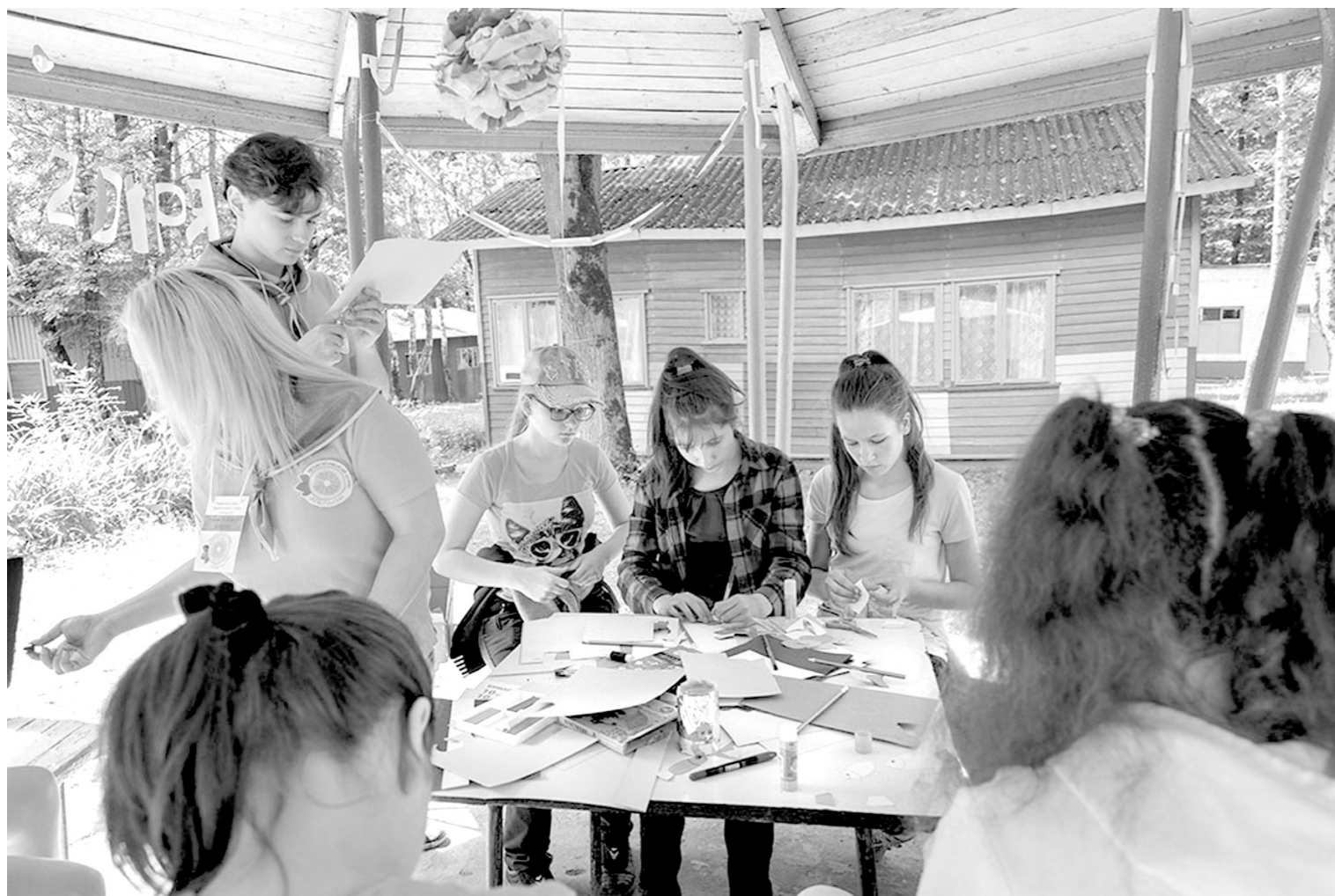
В загородном лагере должно быть весело, интересно и безопасно