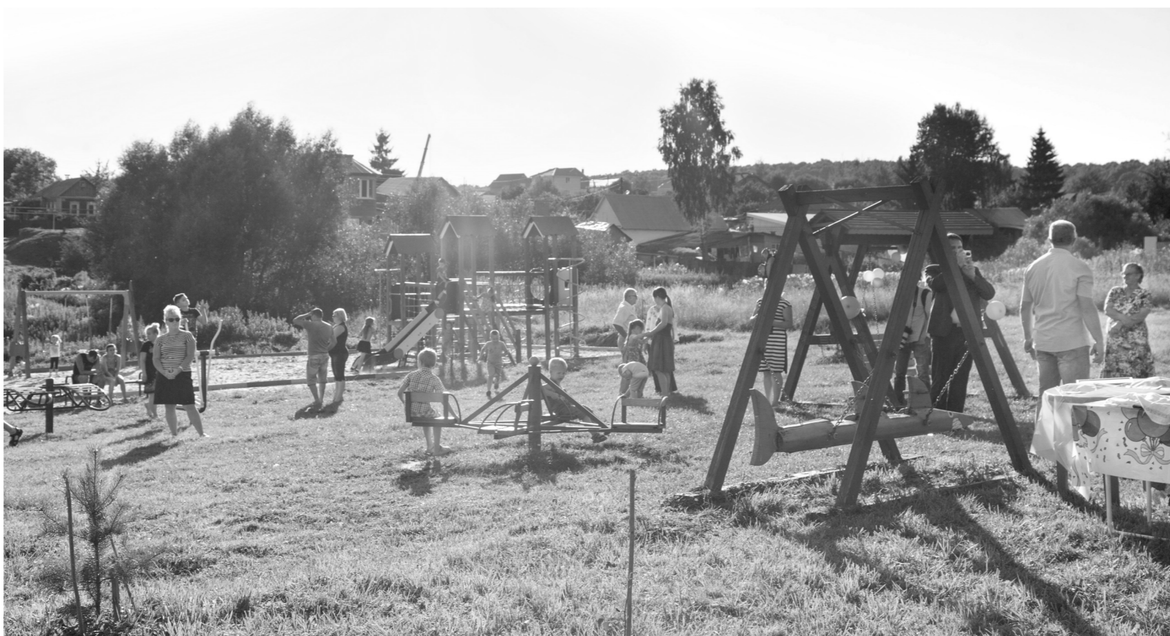
Горки, тренажеры, турники – все это расположилось на лугу в Высоком