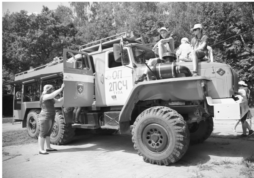
Юные пожарные на крыше большого «Урала»

До конца года подобные уроки безопасности обещают провести и в других детских оздоровительных комплексах Тульской области.