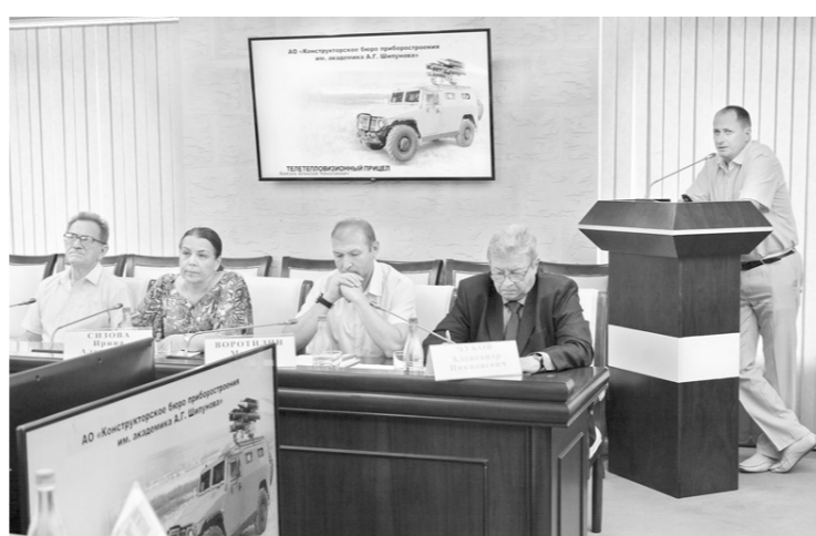
ставку для Министерства обороны РФ, а на «Тулочмаше» созданы рабочие места для серийного производства.

Первым свои проекты представило тульское Конструкторское бюро приборостроения им. академика А. Г. Шипунова. Один из них касался создания средств технического обслуживания зенитного ракетно-пушечного комплекса «Панцирь-С». Нововведения позволили сделать обслуживание ЗРПК более автономным и оперативным. Уже заключены два контракта на по-