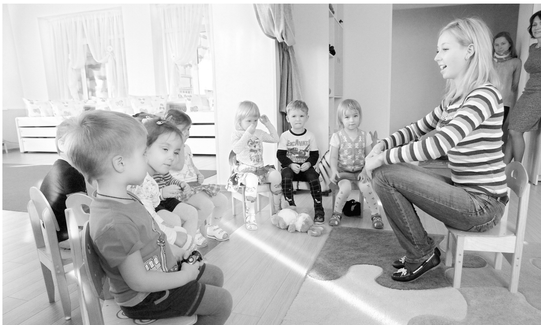
В этом году в детских садах региона создано порядка 700 дополнительных мест

Нелли ЧУКАНОВА Сергей КИРЕЕВ, Елена КУЗНЕЦОВА