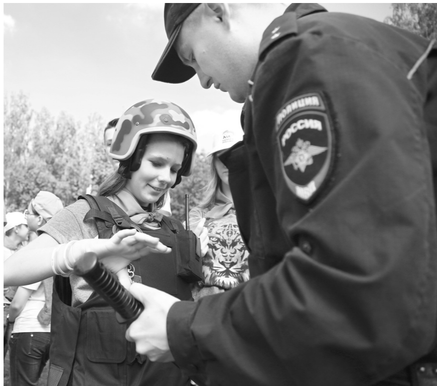
Ребята примеряют амуницию Войск Росгвардии

«Единый день безопасности» в Туле прошел впервые, но организаторы пообещали сделать практику его проведения традиционной. «Орленок» местом ее проведения выбрали не случайно. Только в одну смену здесь отдыхают до 145 школьников в возрасте от