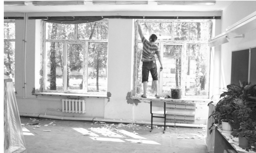
В 848 учреждениях провели ремонт по 953 позициям