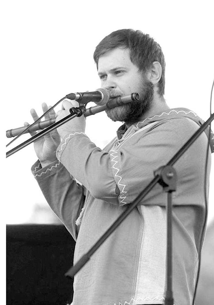
На фестиваль съехались музыканты со всей Тульской области