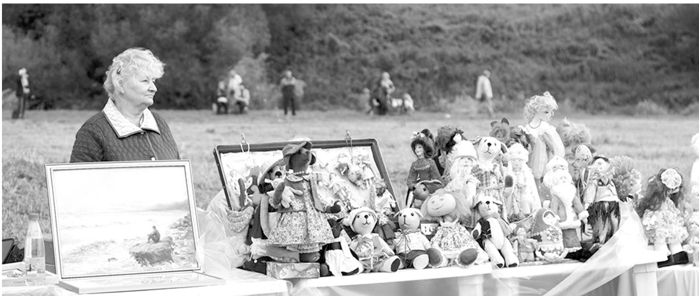
Тульские мастера представили свои поделки