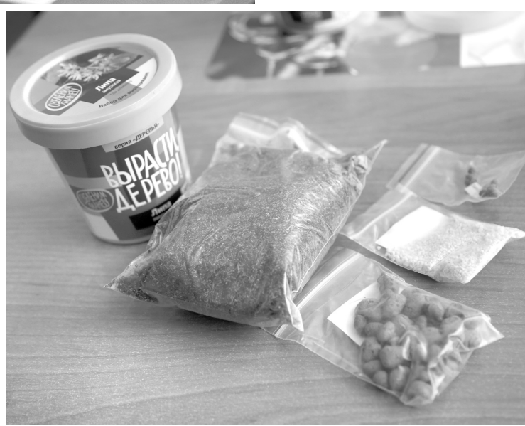
В набор для посадки дерева вошли грунт, семена и дренаж

рию, делают скворечники и вывешивают их в парке. При школе есть даже небольшой огород, на котором ребята выращивают различные овощи.