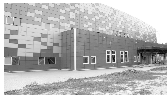
Внешняя отделка спортобъекта уже завершена

Благоустройство территории спортобъекта также уже выполнено, осталось только смонтировать хоккейную коробку во дворе – об этом попросили местные жители.