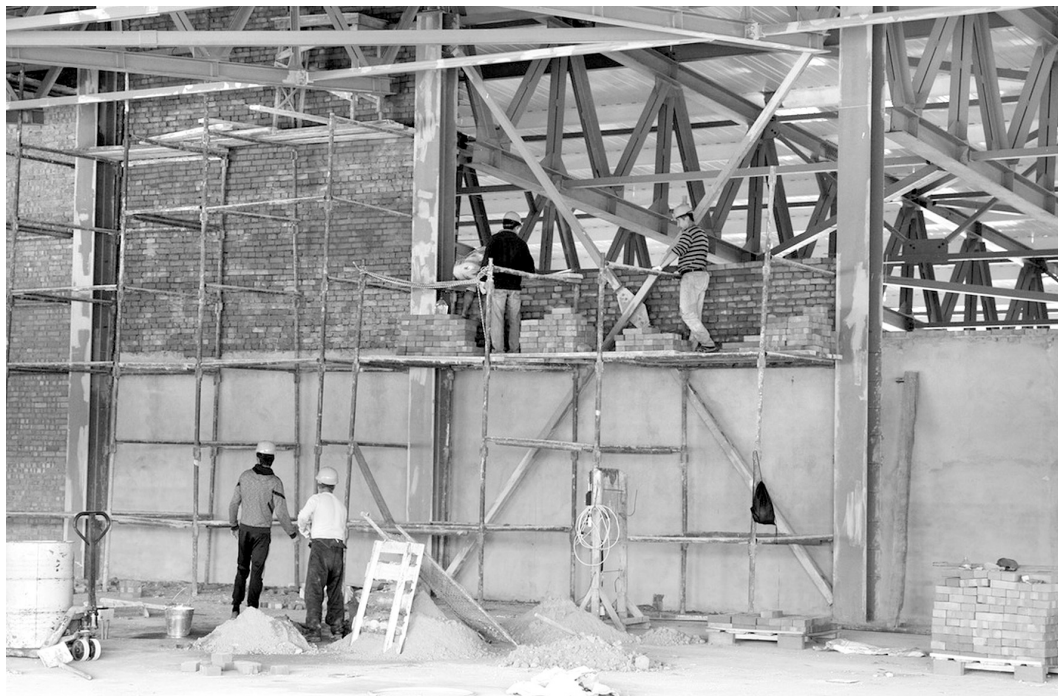
Новый подрядчик приступил к работам в августе

Благоустройство территории спортобъекта также уже выполнено, осталось только смонтировать хоккейную коробку во дворе – об этом попросили местные жители.