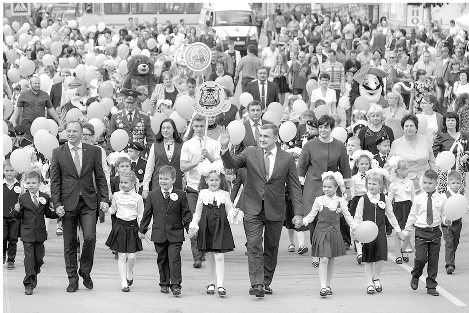
В праздничном параде шагали около 800 первоклассников