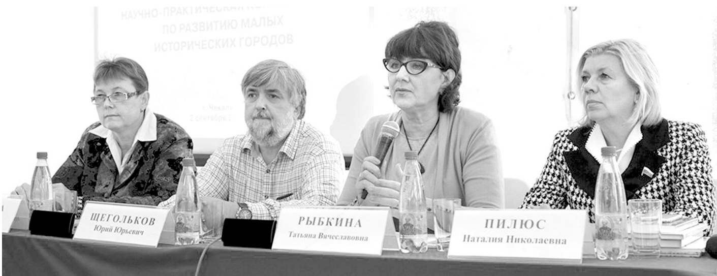
«ПереДвижение» – не только развлекательная площадка, но и место для обсуждения роли малых городов

В рамках конференции был подписан Протокол о намерениях создания Лиги малых исторических городов Тульской области.