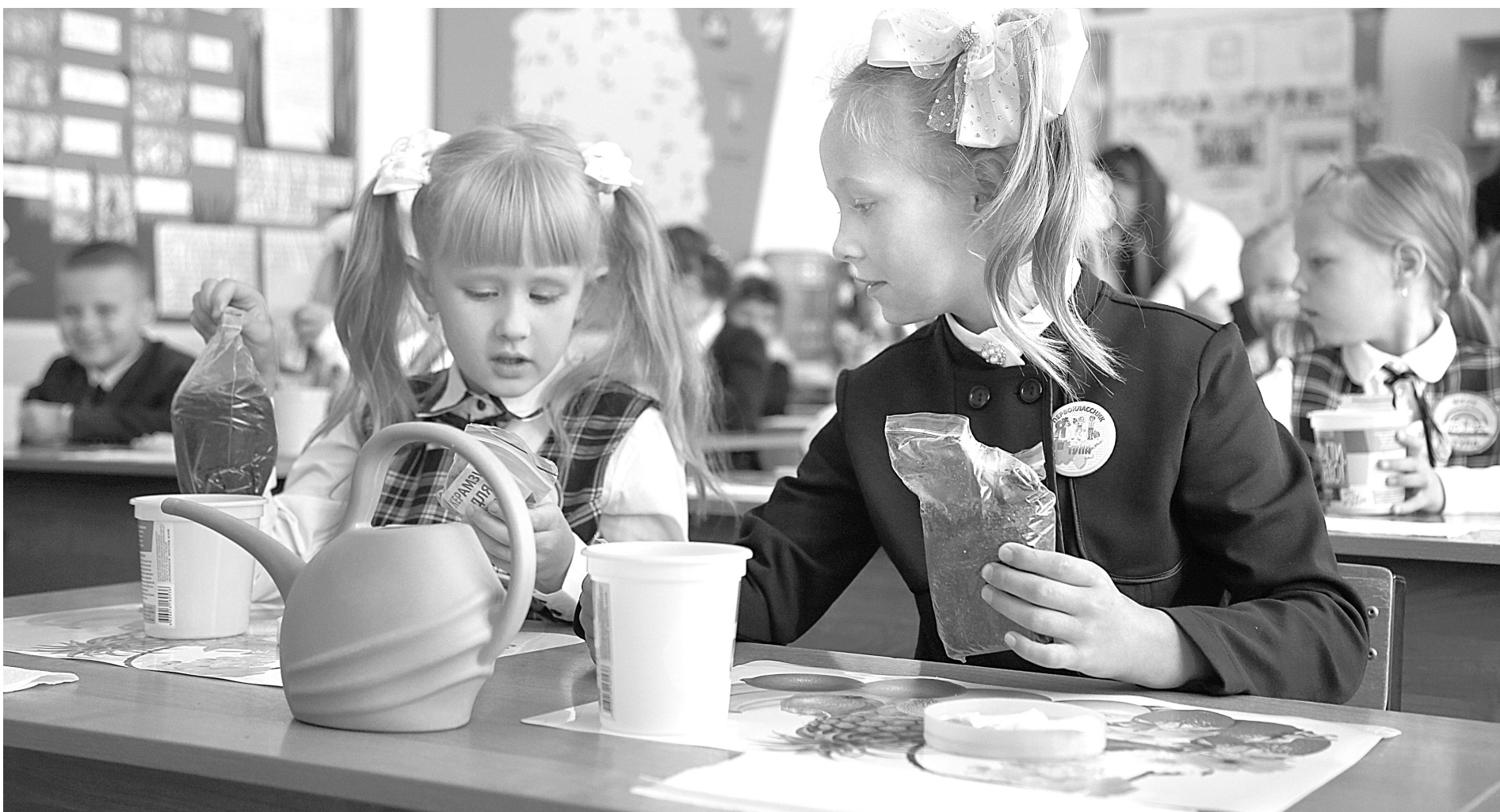
Маленькие круглые семечки преподаватели подготовили к посадке заранее, так что первоклашкам предстояло просто опустить их в горшок