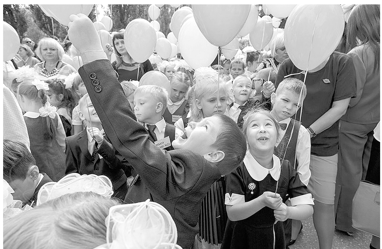
1 сентября – день знаний и радости

А накануне праздника каждый первоклассник Узловского района получил в подарок специальный набор, в котором, помимо необходимых канцелярских принадлежностей, имеется «Дневник узловского школьника», выпущенный к 145-летию основания города, которое будет отмечаться в 2018 году. Вместе с узловскими ребятами в Тульской области впервые сели за школьные парты более 13 тысяч мальчишек и девочек. Учителя, родители, местные власти и правительство области позаботились о том, чтобы для каждого из них День знаний стал настоящим праздником.