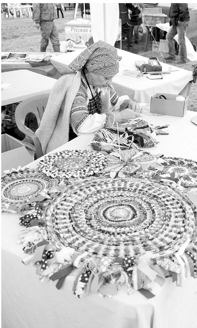
На празднике можно было приобщиться к народному творчеству