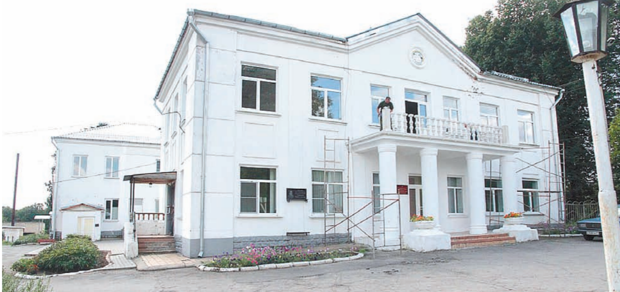
Один из центров одаренных детей появится на базе Яснополянского детского дома

Алексей Дюмин напомнил, что программа по созданию центров находится на особом контроле Президента РФ Владимира Путина.