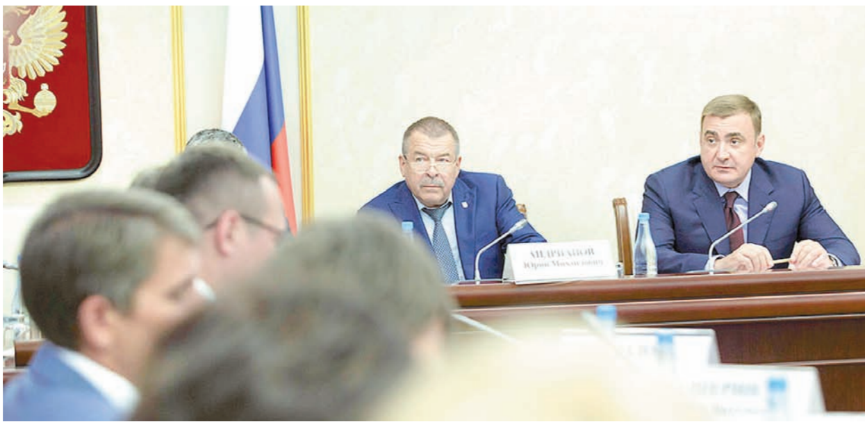
Алексей Дюмин напомнил, что программа по созданию центров находится на особом контроле Президента РФ Владимира Путина

увеличить число учеников «школы полного дня» до 140 человек.