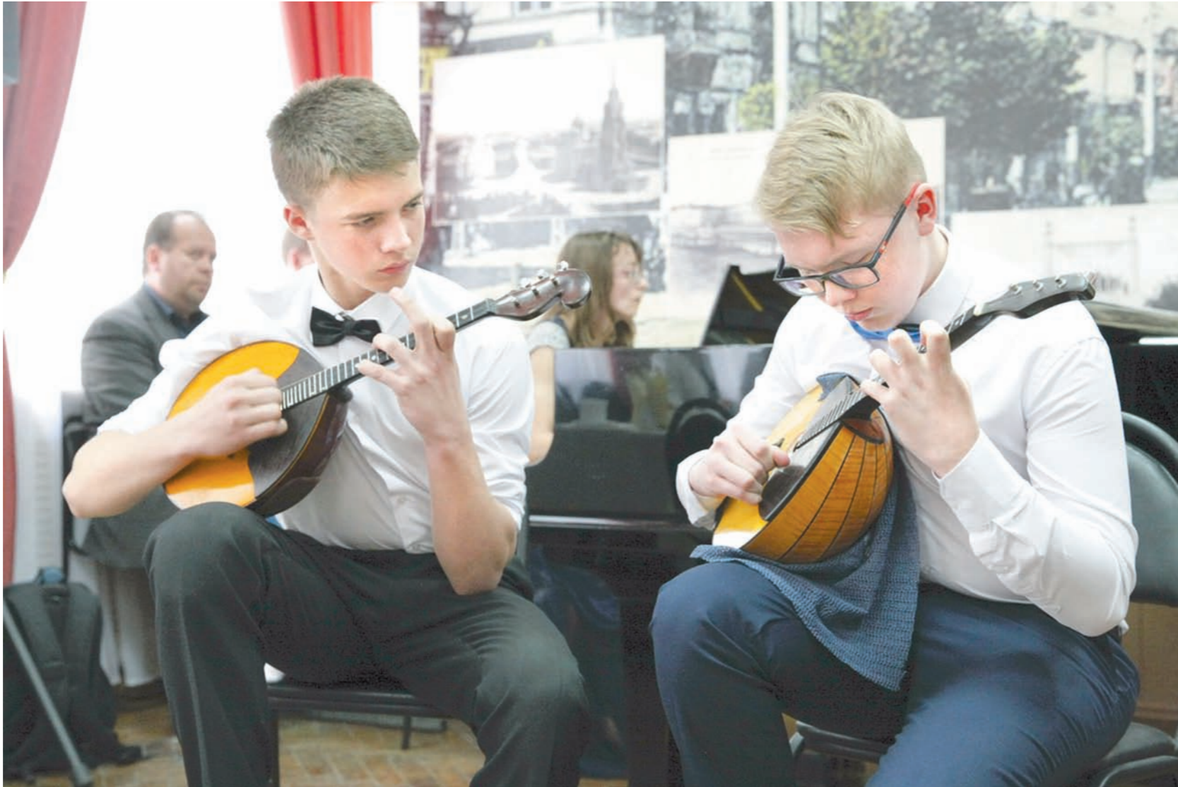
Для музыкантов на базе школы Г. З. Райхеля будет открыта «мастерская талантов»

В дальнейшем, по словам Левиной, будет рассматриваться возможность строительства двух дополнительных зданий для организации досугово-оздоровительно-развивающей деятельности. Это позволит