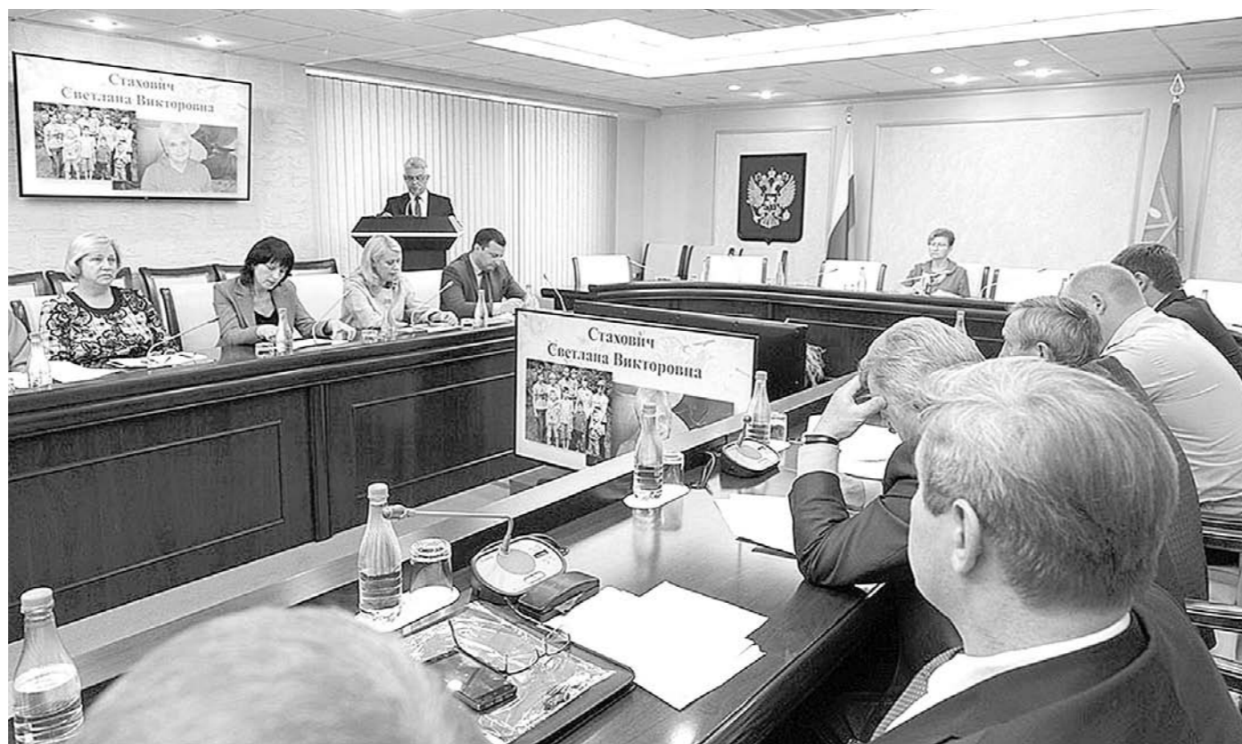
На заседании обсуждались кандидатуры жительниц региона, представленных к награждению Почетным знаком «Материнская слава»

Кстати, «мамнина награда» появилась у нас в 2008 году. Ее уже удостоены 485