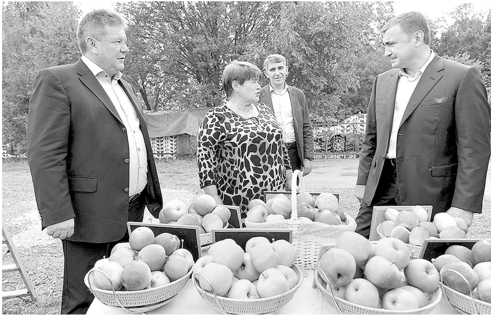
Алексей Дюмин пообщался с сотрудниками хозяйства «Плава»