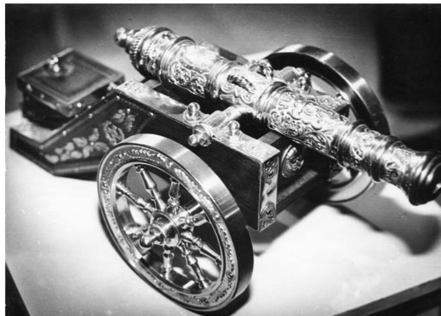
В Туле появится мастерская оружейных миниатюр

Им передали землю для постройки складских помещений. Появятся и новые предприятия. Одно из них – фабрика по производству макаронных изделий. О передаче под застройку участка почти в 1,5 гектара ходатайствовала администрация района. Кстати, подобной производства в Тульской области пока нет. Новое предприятие позво-