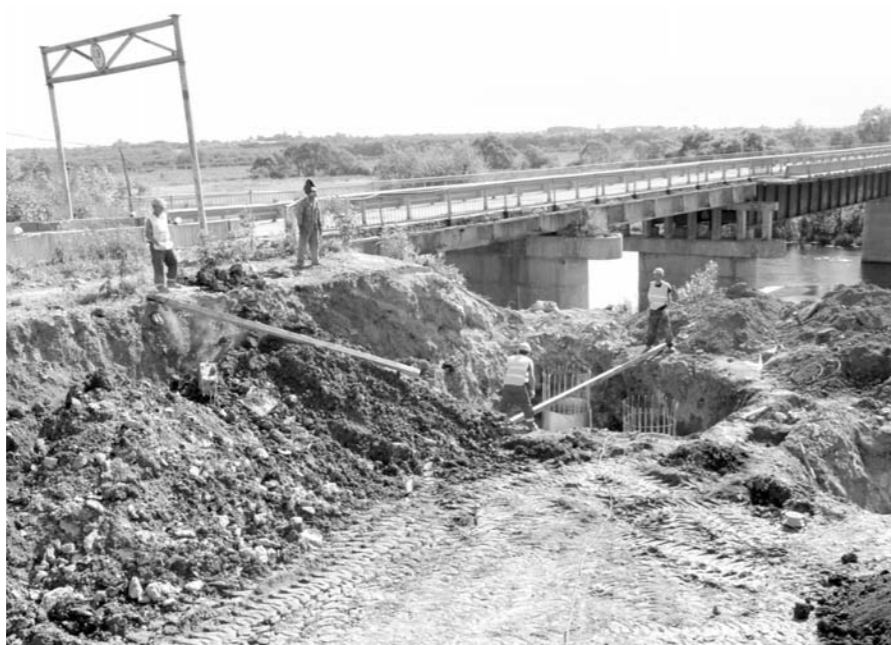
Мост через Красивую Мечу в Ефремове приведут в порядок к июлю 2018 года