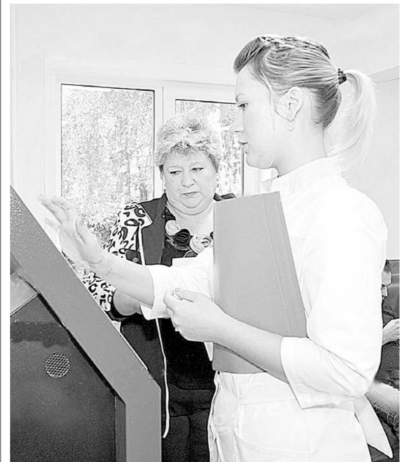
Специалисты готовы помочь пациентам записаться на прием к врачу

«Бережливая поликлиника» – это живой организм, так что для дальнейшего развития возможности есть: в холле первого этажа на специальной доске можно оставить свои отзывы и предложения по дальнейшему совершенствованию ее работы.