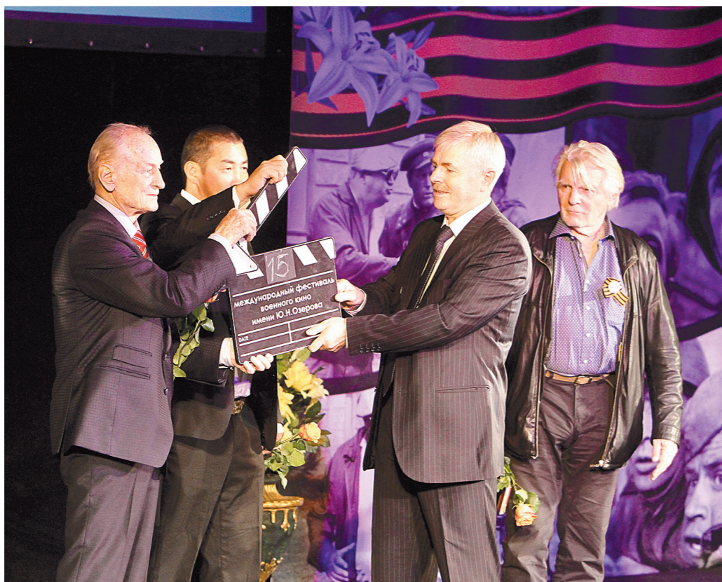
Фестиваль прописался в Туле

Об этом говорилось на торжественном открытии XV Международного фестиваля военного кино, которое состоялось в Тульском драмтеатре.