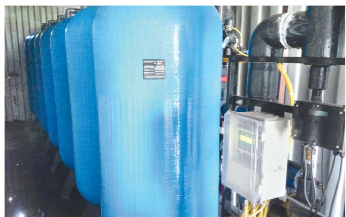
Вода проходит очистку на станции обезжелезивания

– Мы обратились к губернатору Алексею Дюмину с просьбой помочь нам в этой сложной ситуации. И благодаря его поддержке Донскому были выделены средства из областного резервного фонда. Уже закуплено необходимое количество труб, песка, завезена техника. Новая трасса водовода протяженностью 4 километра должна быть проложена до конца октября. Это позволит нам обеспечить водой верхние этажи жилых домов, – заверил глава администрации Донского.