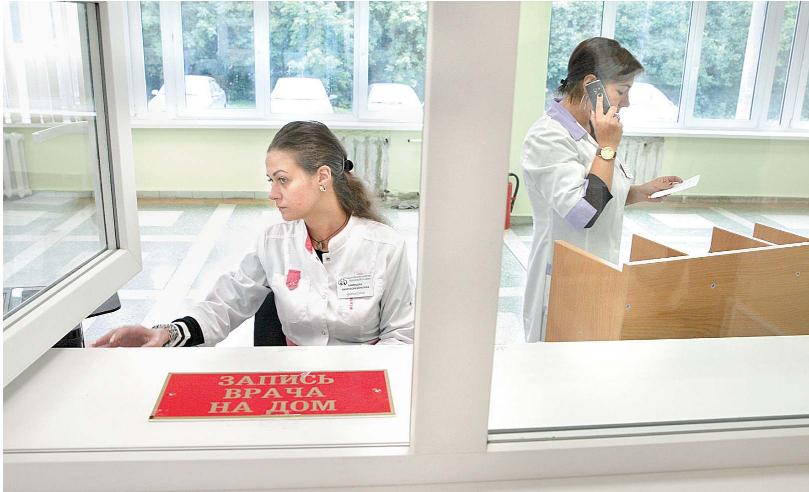
Проект «Бережливая поликлиника» уже успешно реализуется в регионе

С целью сокращения времени ожидания приема разработан порядок маршрутизации пациентов. Если человек заболел и пришел в