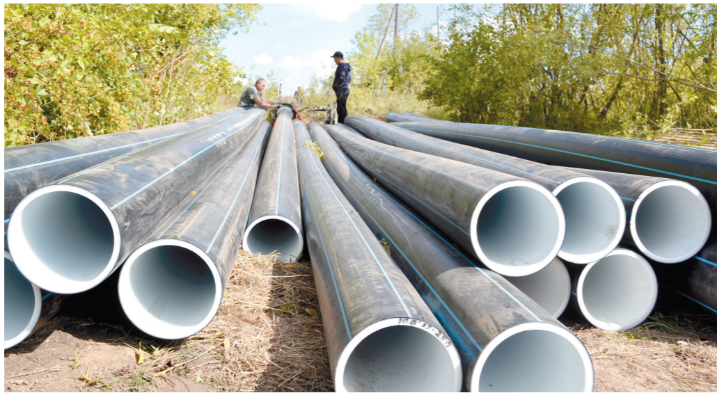
Замене подлежат несколько километров труб

Этим летом ситуация накалилась до предела: график