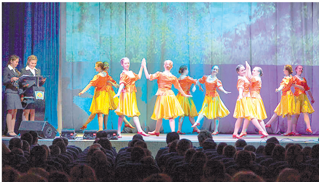
Воспитанницы пансиона Министерства обороны РФ продемонстрировали суворовцам сценические таланты

Визит воспитанниц пансиона в Суворовское училище завершился балом и дискотеккой.