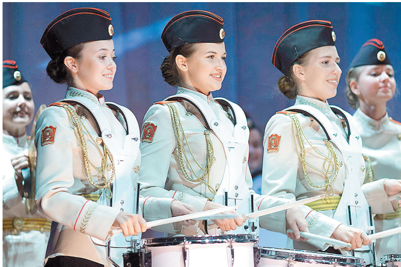
Юные барабанщицы уже показали себя на творческих конкурсах