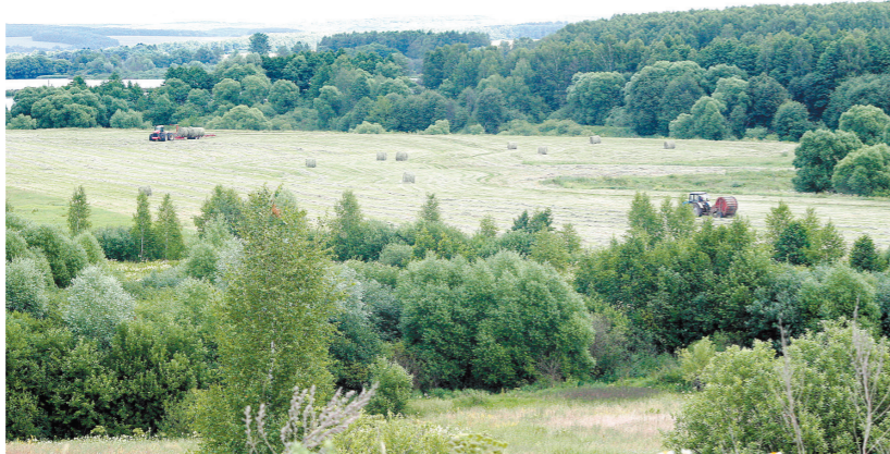
14,3 процента территории Тульской области занимают леса

ственного объединения, ею занимаются муниципалитеты, а также арендаторы участков. В их общем арсенале – около 200 единиц спец-