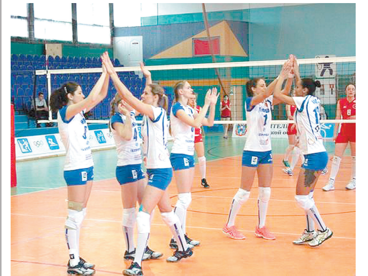
Как сообщили в клубе, в турнире также поучаствуют две команды из Суперлиги, а также из Финляндии, Чехии. Тулячки начнут сезон в высшей лиге «А» 7 октября.

Волейболистки тульской «Тулицы» в конце сентября сыграют на предсезонном международном турнире в Санкт-Петербурге.