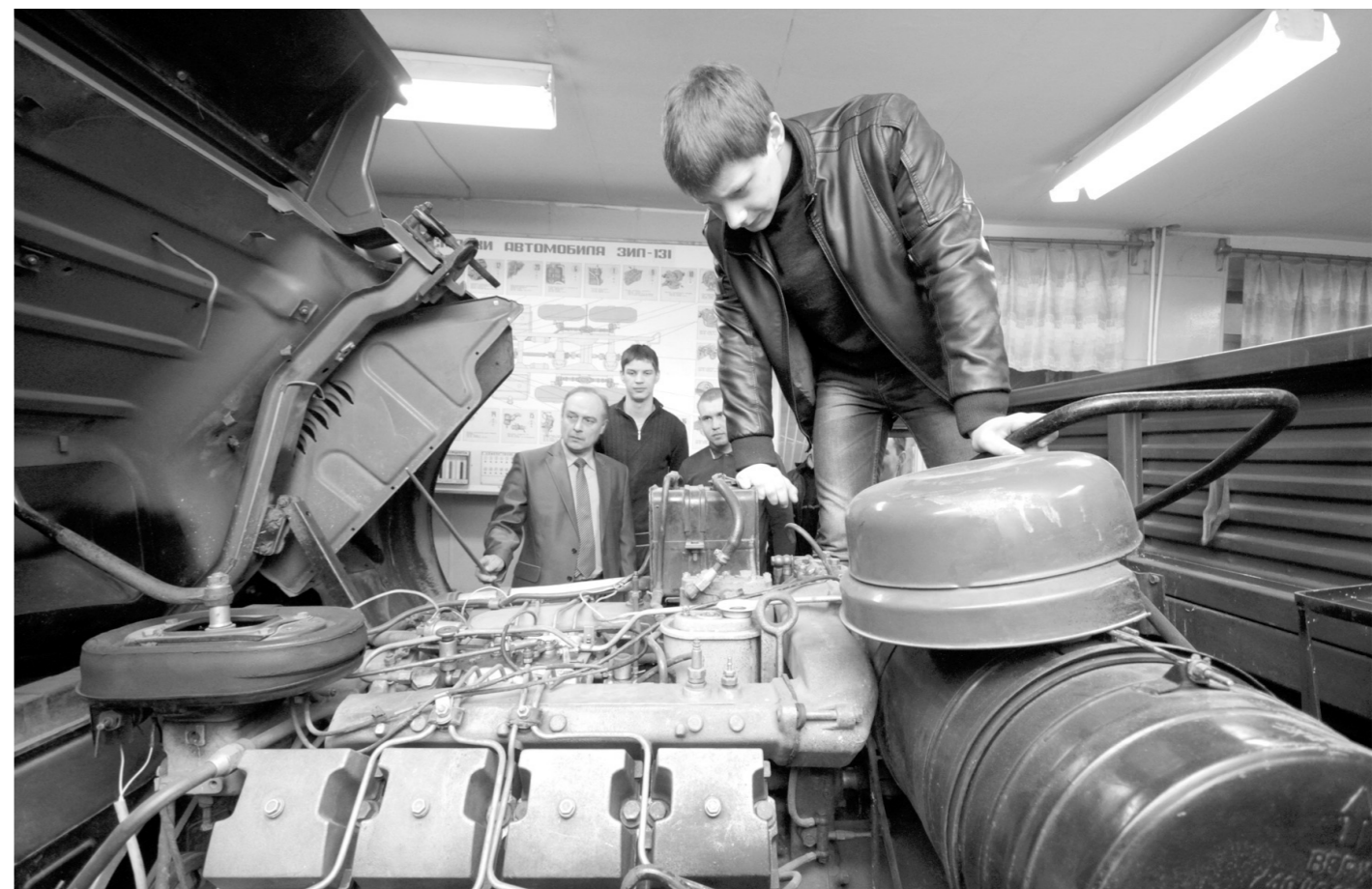
ДОСААФ сегодня готовит для армии водителей – впрочем, полученные знания пригодятся и на «гражданке»

К собравшимся обратилась министр молодежной политики Тульской области