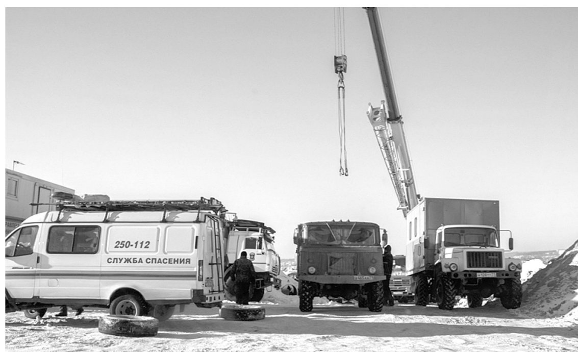
Причиной аварии стал сдвиг грунта

Выполните намеченное удалось. После полудня городские власти отчитались: восстанови-