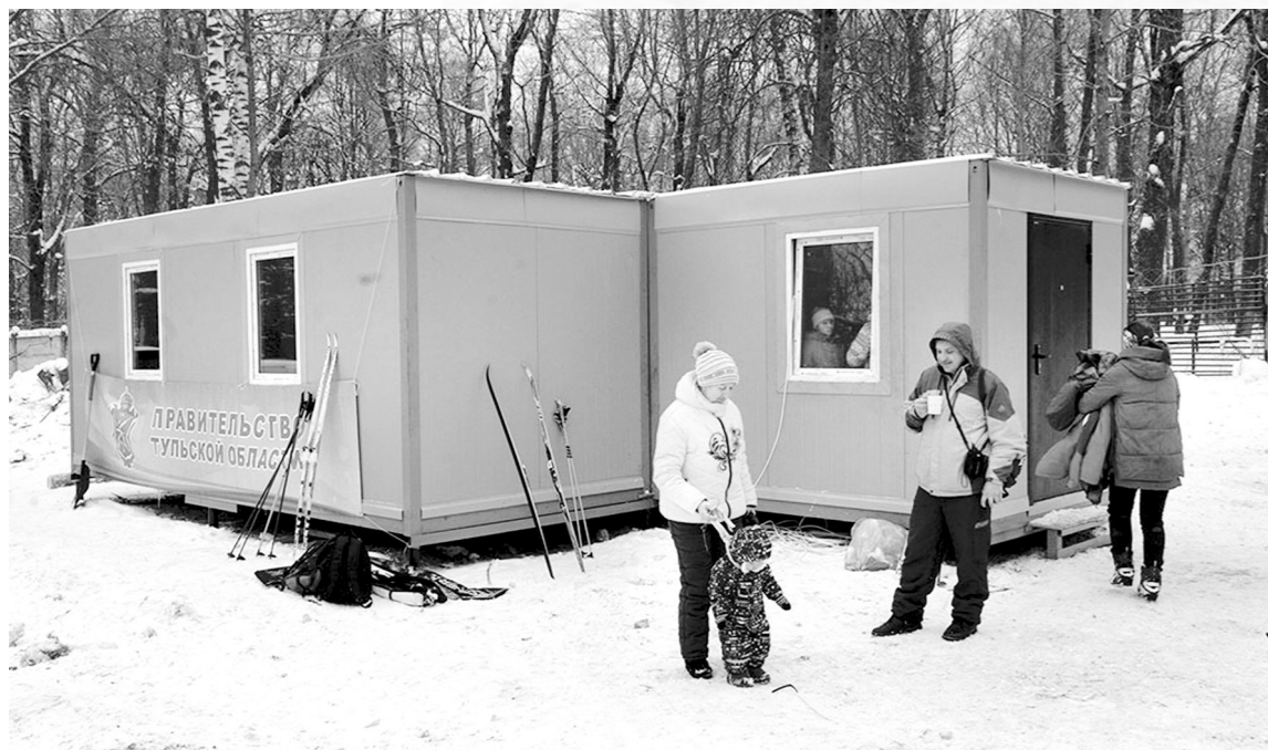
Модульную лыжную базу возвели в рекордно короткие сроки

Впервые за долгое время юным спортсменам не пришлось переодеваться на улице