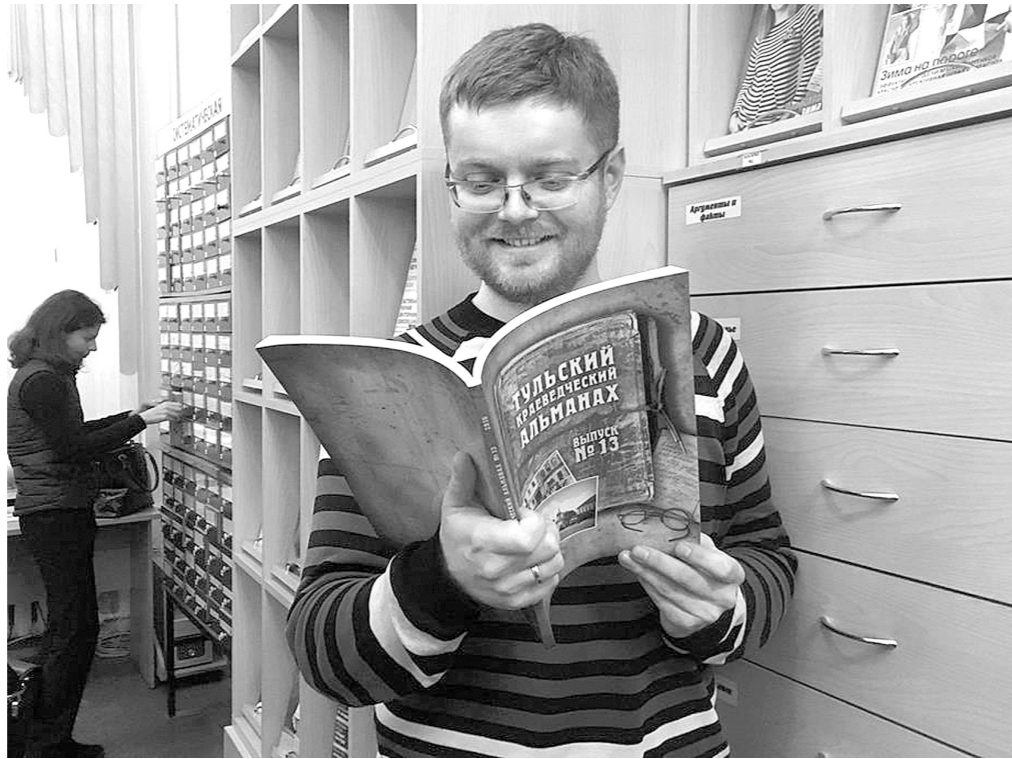
Очередной выпуск «Тулского краеведческого альманаха» читается на одном дыхании

В очередном, тринадцатом выпуске читатели ждут знакомство с тульской символикой на