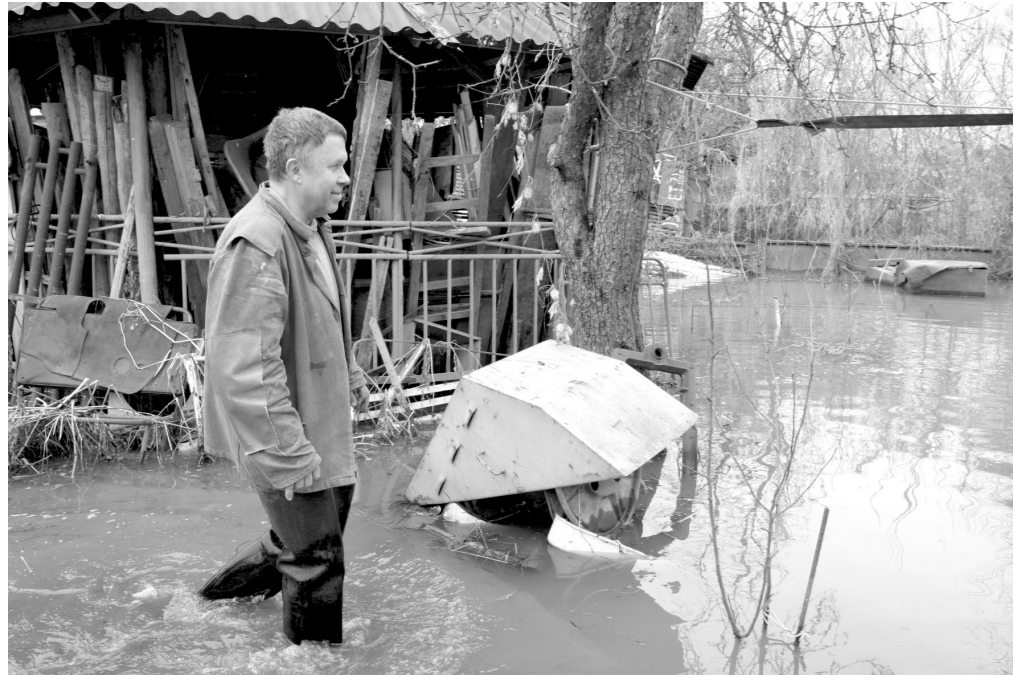
Вот такой бывает в половодье тихая и неприметная речка Воронка в районе Московского вокзала в Туле

О том, что необходимо предпринять, дабы не допустить наводнения, говорилось на заседании комиссии по предупреждению и ликвидации чрезвычайных ситуаций и обеспечению пожарной безопасности.