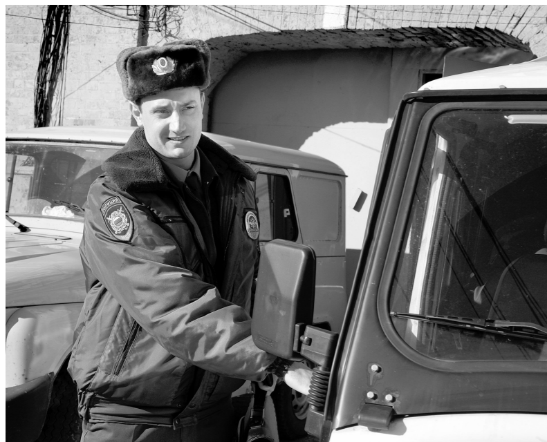
Тульские полицейские заслужили доверие земляков

Возросла раскрываемость убийств, разбойных нападений, краж с незаконным проникновением в жилище. На 13 процентов уменьшилось количество незаконных деяний на улицах и в общественных местах.