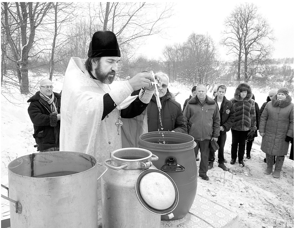
Три четверти века спустя здесь вновь святили воду