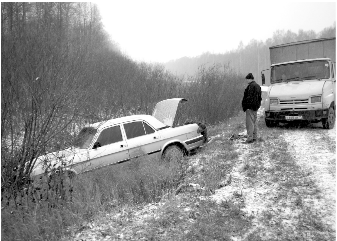
В 2016 году количество ДТП уменьшилось на 12 процентов