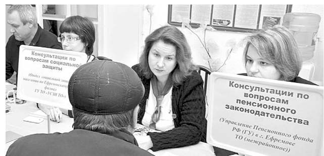
Для удобства посетителей предприятия промышленности и социальной сферы развели в разные залы

Впрочем, и эта ситуация может измениться к лучшему после межрайонной ярмарки вакансий, которая прошла на днях в Доме культуры «Химик». Поддержать ефремовских коллег приехали специалисты областного Центра занятости населения. А среди работодателей оказались предприятия Ефремовского, Куркинского, Воловского и других районов, готовые трудоустроить в торговле и общепите, транспорте и связи, строительстве и сельском хозяйстве, образовании и здравоохранении.