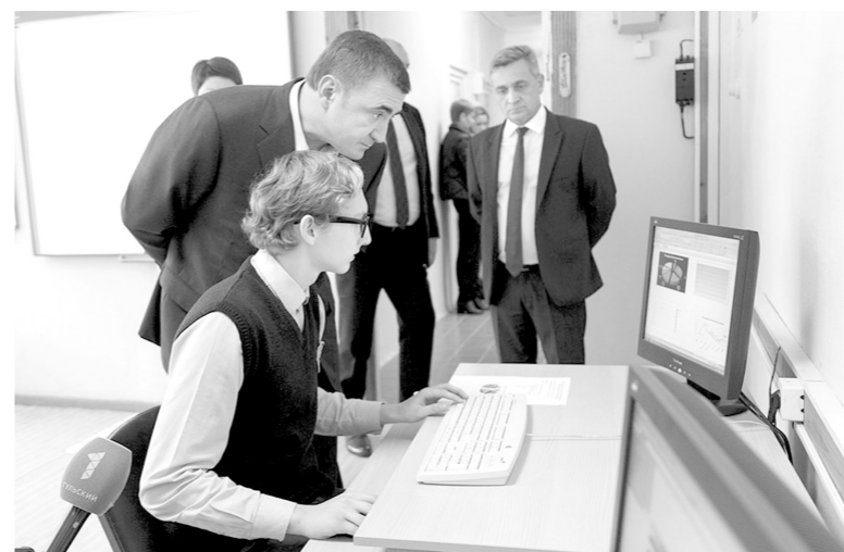
В образовательном центре № 2 Алексей Дюмин побывал на уроках и пообщался с учениками

Пообщался Алексей Дюмин и с юными киреевцами: он побывал в образовательном центре № 2. У входа его встретили дети, и губер-