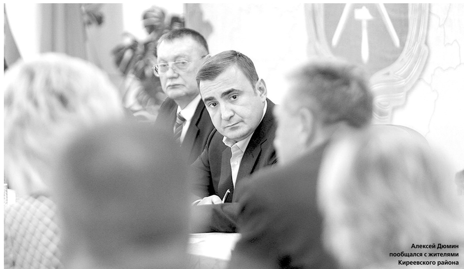
Алексей Дюмин пообщался с жителями Киреевского района