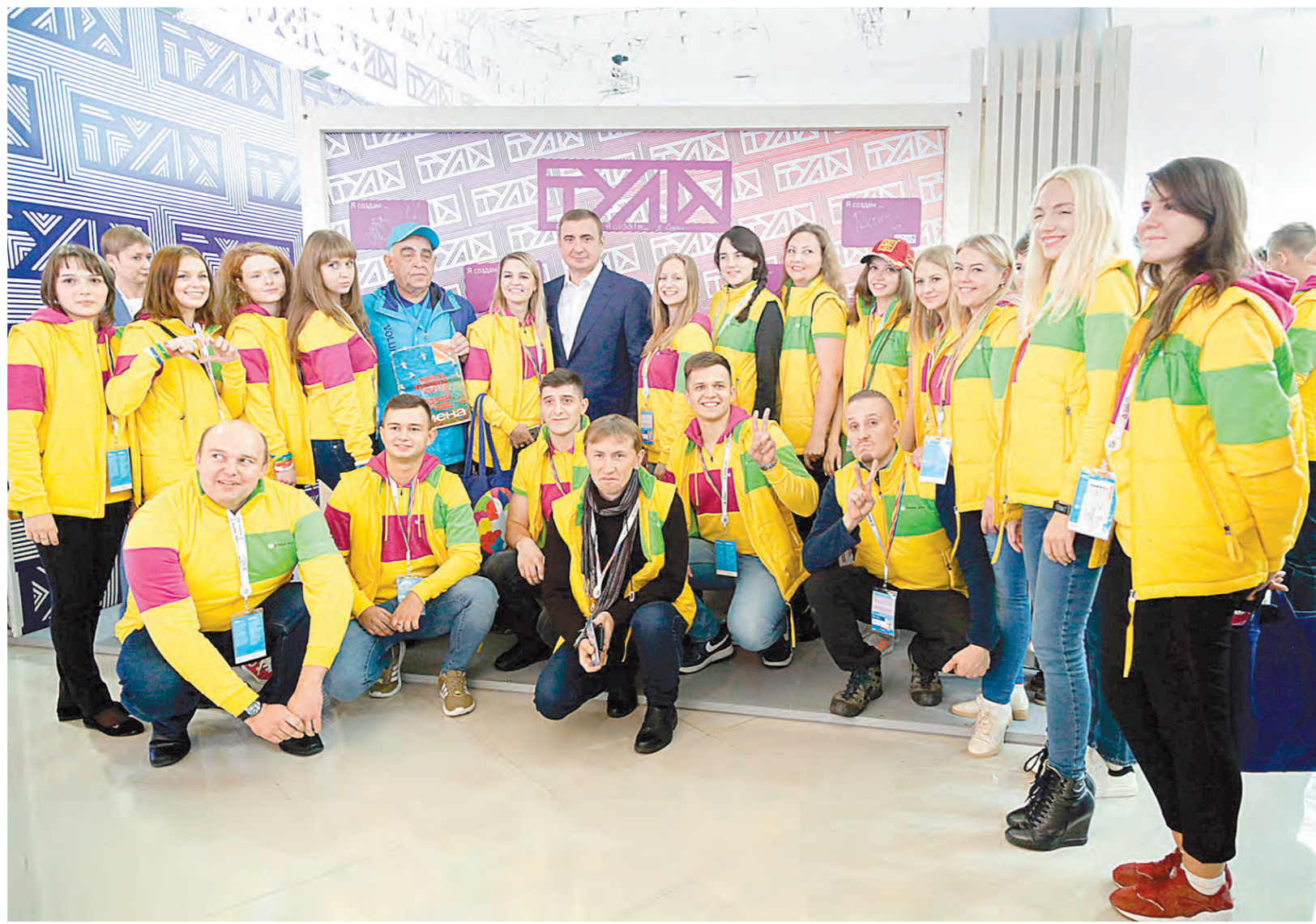
Алексей Дюмин пообщался с тульской делегацией на фестивале молодежи

лись ролями. Сейчас вы – основные спикеры, презентуете наш регион, – сказал участникам делегации Алексей Дюмин. – Главное – чтобы, побывав на стенде, люди загорелись желанием приехать в Тульскую область. Может, как туристы, а может, и бизнес свой захотят у нас открыть.