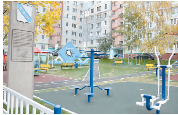
Оформление двора дома на улице Галкина тематически посвящено Курску

Несмотря на хмурое холодное утро, морозящий дождь и ледяной ветер, настроение у жителей дома №10 по улице