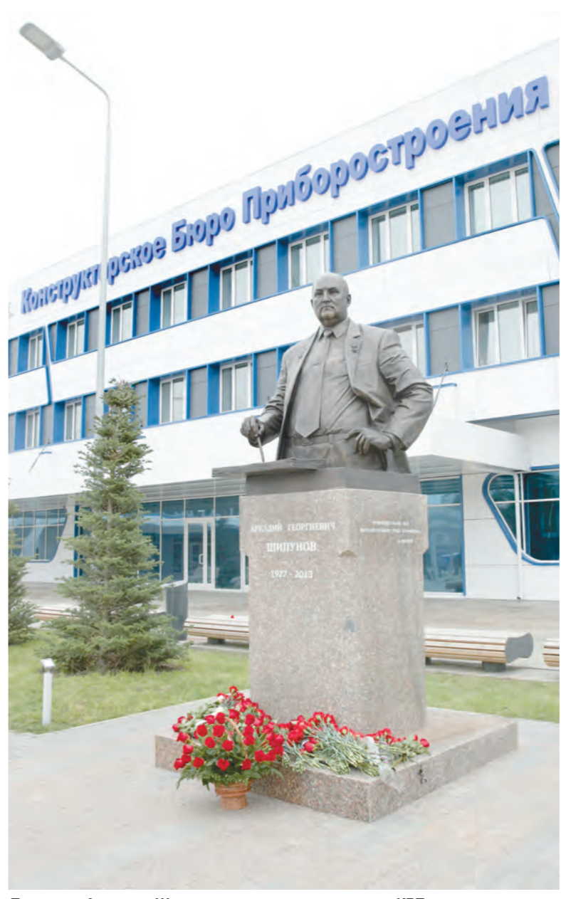
Памятник Аркадию Шипунову открыли у проходных КБП

Торжества продолжились на площади возле КБП. Здесь для сотрудников предприятия устроили