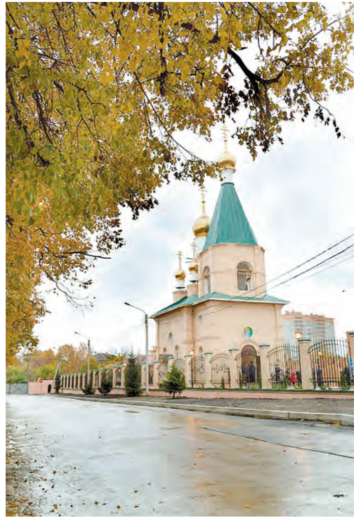
У воинов-десантников 51-го полка теперь есть свой храм

– В Туле всегда были сильны традиции благотворительности. И этот храм – наглядное тому подтверждение. Хочу поблагодарить всех, кто вложил