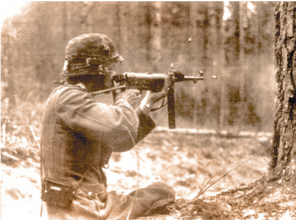
Немецкие автоматчики расстреливали в деревне всех попадавшихся на глаза мужчин