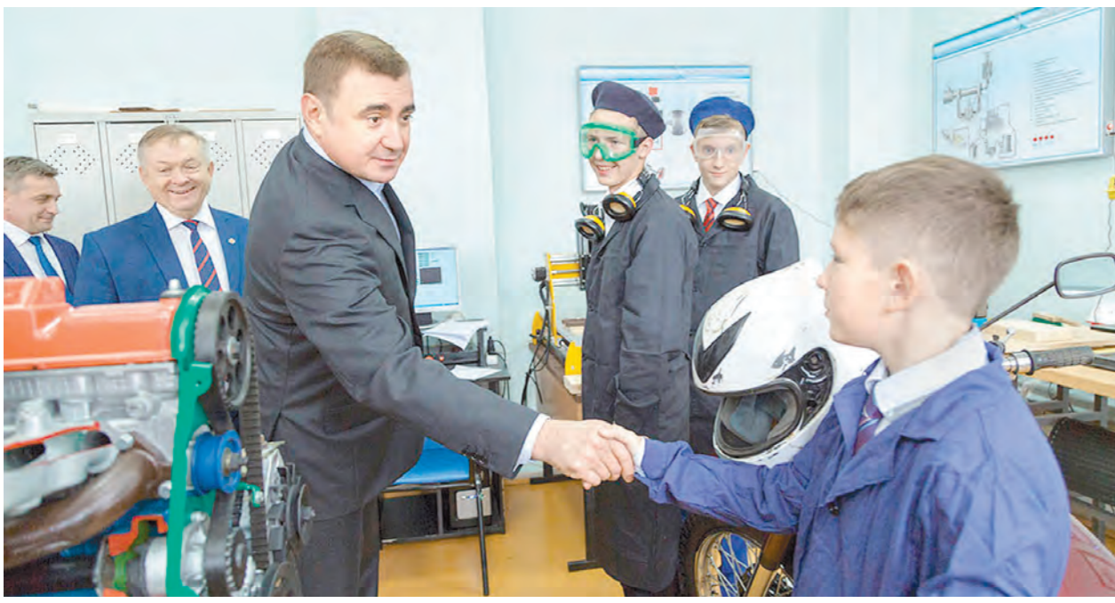
Губернатор осматрел мастерскую, пообщался с ребятами