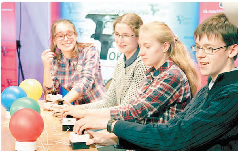
Юным знатокам предстояло ответить на задания ведущих не только правильно, но и быстро