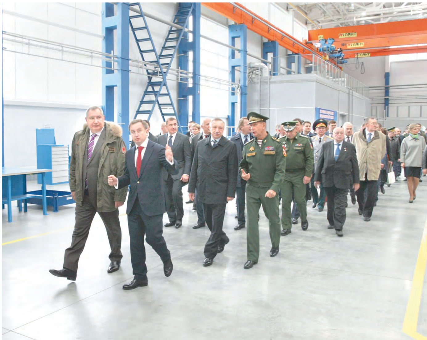
Новый цех на «Щегловском вале» оснащен с использованием новейших технологий