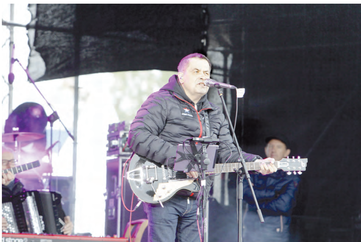
Для сотрудников КБП спел Николай Расторгуев