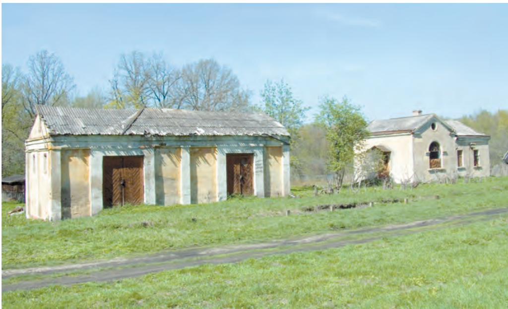
Так в наши дни выглядит заброшенная железнодорожная станция Рвы