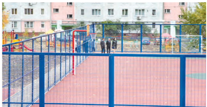
На огромной территории у домов на улицах Пролетарской и Плеханова нашлось место для универсальной спортплощадки, комплекса для занятий воркаутом и нескольких детских спортивных и игровых городков

До конца 2017-го предстоит сформировать и утвердить аналогичную программу благоустройства городов на 2018–2022 годы. Работа предстоит большая и ответственная, ведь с будущего года в реализацию проекта включатся уже двадцать семь муниципальных образований нашего региона.