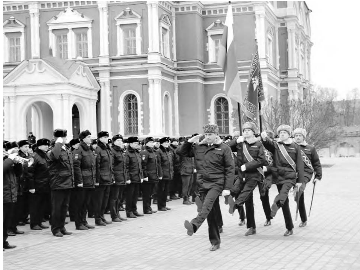
Стражи порядка прошли торжественным маршем по Соборной площади кремля