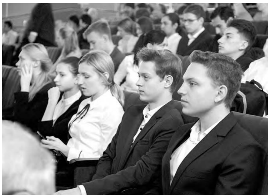
Молодежь – за права человека

ственное управление, колоссальная нормативная база, регулирующая правоотношения, – это человек, соблюдение его прав и свобод. А это высшая ценность в стране. Взаимодействие, которое на сегодняшний день выстроено между всеми ветвями власти в ре-