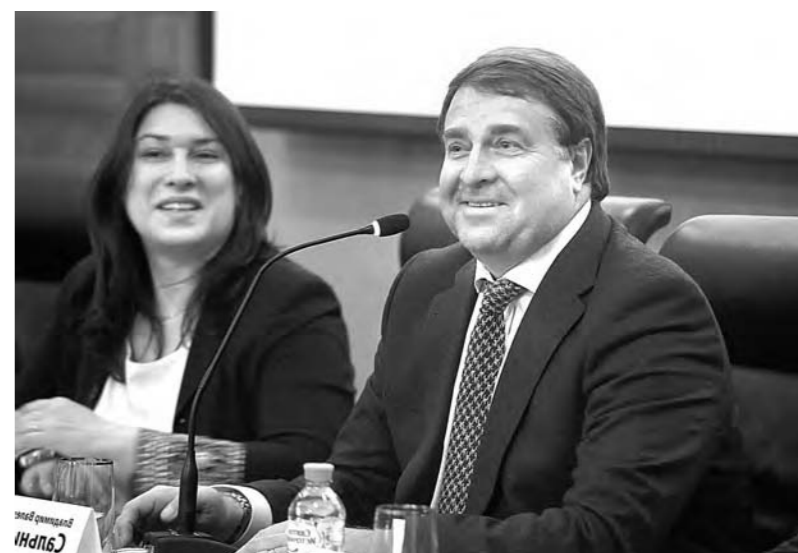
Владимир Сальников: чтобы добиваться успеха в жизни и спорте, надо просто захотеть

На днях в Туле побывал Владимир Сальников – легендарный пловец, четырехкратный олимпийский чемпион, автор двадцати мировых рекордов, а ныне президент Всероссийской федерации плавания. Он поучаствовал в проекте «Диалог на равных», пообщавшись со студентами ТулГУ.