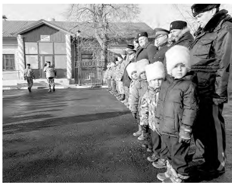
На открытие культурного центра «Верховье Дона» собрались дети и взрослые