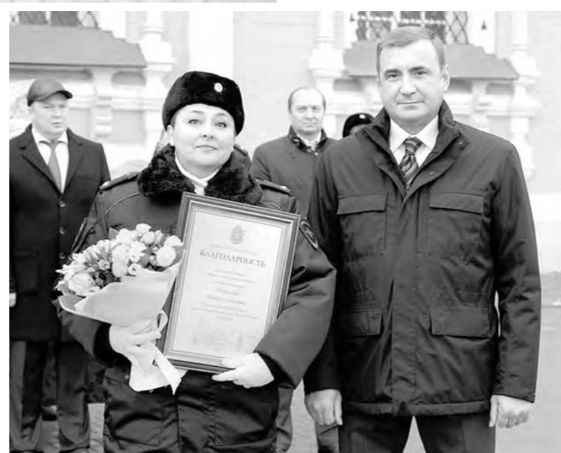
Отличившиеся силовики были удостоены благодарности губернатора Тульской области

– Вы первые, к кому обращаются люди, попавшие в беду. Вы поддерживаете порядок в нашем общем доме – России – и спокойную атмосферу в нем. Служите честно на благо народа, и вы будете окутаны его любовью и уважением! – отметил в своем выступлении председатель правительства Юрий Андрианов.