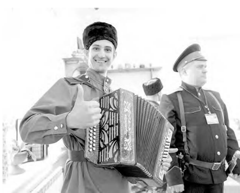
Казаки порадовали губернатора старинной песней