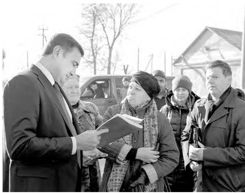
Жители Епифани рассказали Алексею Дюмину о своих проблемах

– Для туристов, в первую очередь для детей, мы с компанией РЖД организуем железнодорожные туры по нашим достопримечательностям, – поделился планами губернатор. – Надеюсь, что это место станет новой точкой притяжения, даст дополнительный приток туристов.