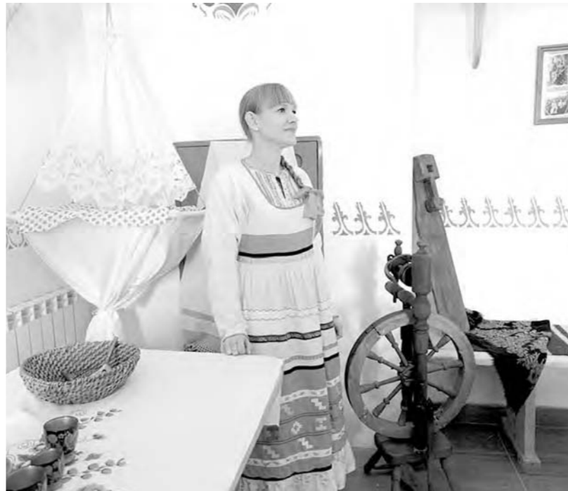
Курень предназначен для изучения традиций казачества