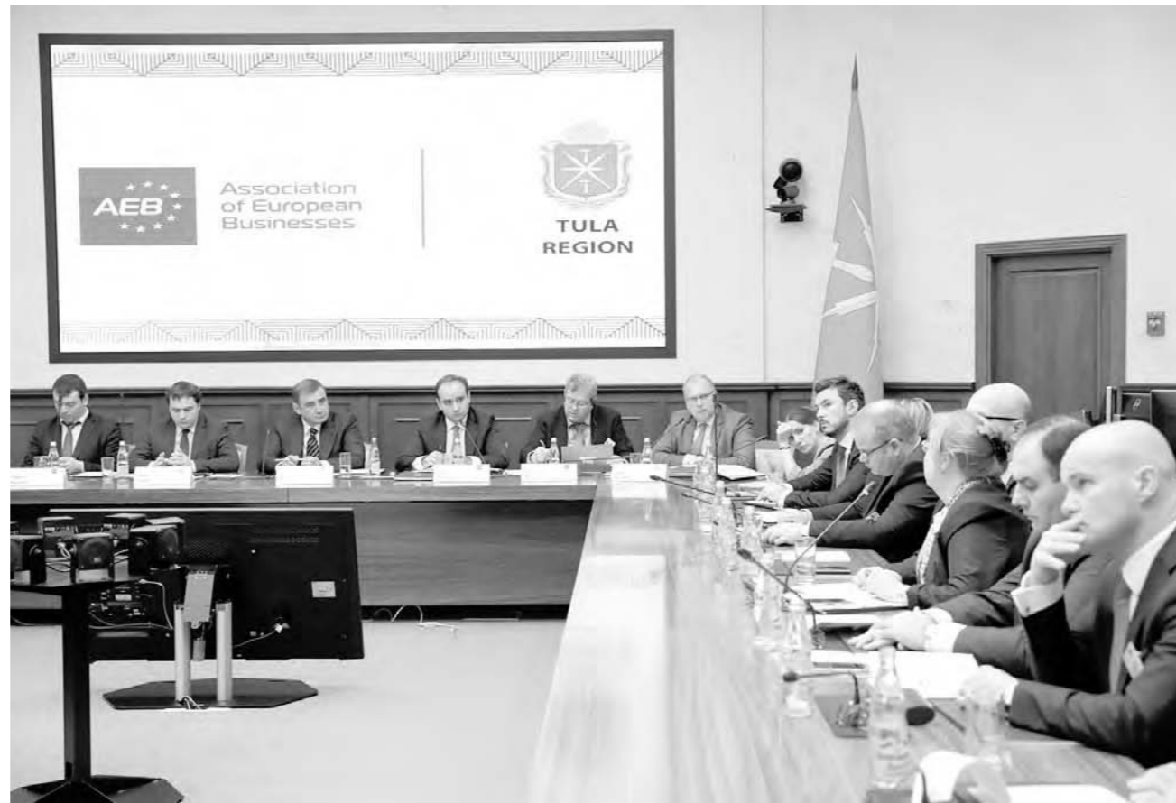
Участники встречи констатировали: инвесторы в Тульской области получают возможность абсолютно открытого диалога с региональной властью