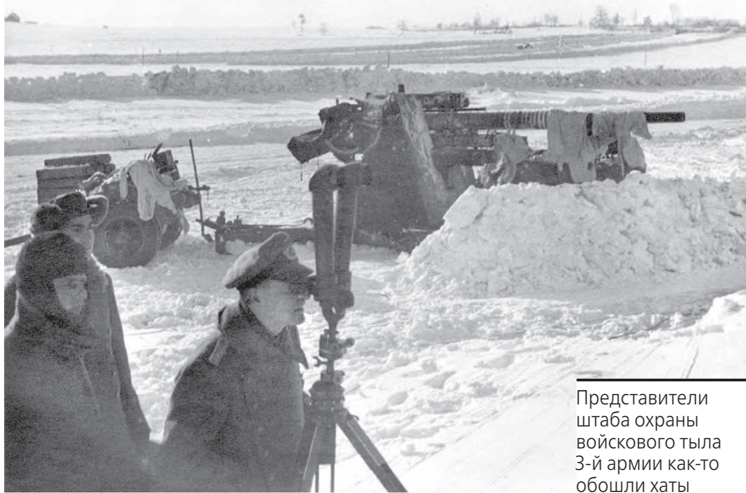
Гитлеровцы, отступая, бросали на территории Тульской области и орудия, и всевозможное снаряжение