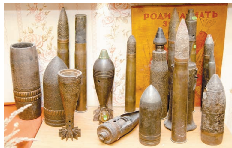
Сбор брошенных на полях сражений боеприпасов активно велся еще в 1941 году, но до сих пор снаряды то и дело находят тульские поисковики

Перед нами – оперативно-разведывательная сводка за 27 декабря сорок первого. В ней сообщается о деятельности группы 73-го полка, который в Ефремове подбирал вооружение, брошенное отступающими фашистами. А они оставили после себя богатое фронтовое наследие: пушку и 330 снарядов к ней, пару велосипедов, мотоцикл. Все это потом шло на переплавку или же в действующую армию. Главной задачей тогда было предотвращение фактов «растацилировки» и подрывов. Существовало также опасение, как бы трофеи не перекочевали в руки преступных элементов. Надо сказать, что в условиях неразберихи, паники, активных боевых действий многое в лесах и на полях оставалось и от бойцов Красной армии. Например, добавлением к немецким трофеям послужили дюжина отечественных драгунских винтовок, 15 противотанковых гранат и пятюк гранат РГД-33, а также 11 противогазов... Все артиллерийское имущество было сдано начальнику гарнизона города на Красивой Мече, а вот пять «эргэдшек» личный состав полка оставил для себя. Видимо, солдаты отлично знали, как обращаться именно с этими боеприпасами, поэтому и решили: пусть уж