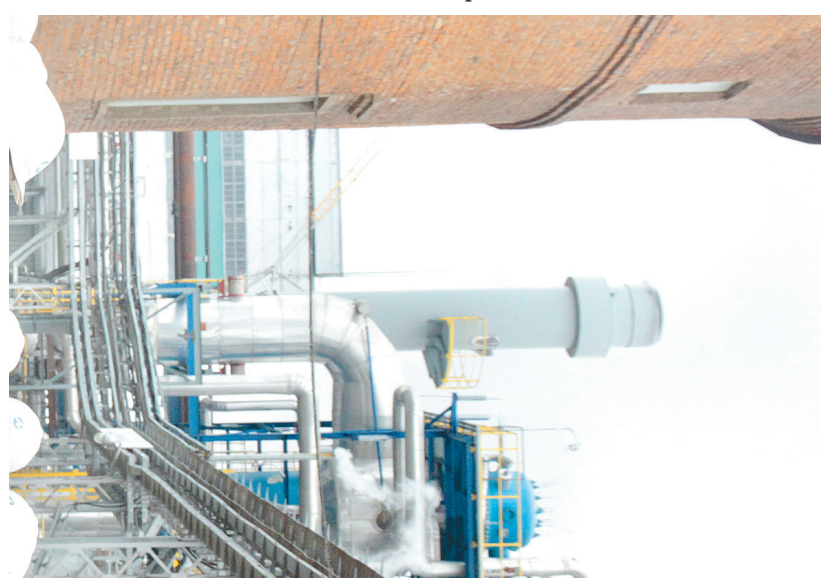
Индийская делегация осмотрела производственные площадки «Щекиноазота»