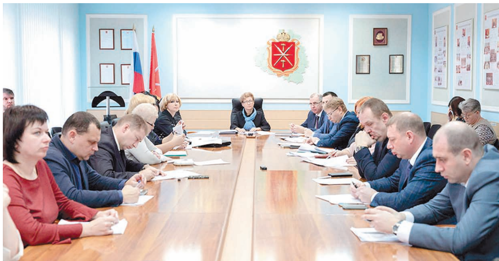
В Новый год – без долгов по заработной плате. От предприятий, где «ситуация близка к разрешению», на комиссии потребовали более активных действий

По его же словам, предварительно кредитная линия КЗЛМК на погашение всей кредиторской задолженности уже одобрена. А кроме того, руководством завода обратилось к акционерам с предложением продать часть неиспользуемого имущества: