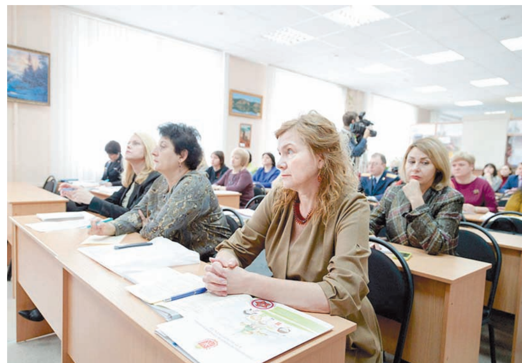
Участники конференции считают, что выявлению неблагополучных семей внимания надо уделять больше

В том же районе на территории дачного кооператива обнаружили двухлетнюю безнадзорную девочку. Ее мать злоупотребляет алкоголем, ведет асоциальный образ жизни. Ребенок хоть и оформлен в садик, но не посещает его. Родительница передоверила воспитание девочки своим отцу и матери, постоянно проживающим на даче – в условиях, совершенно не подходящих для ма-