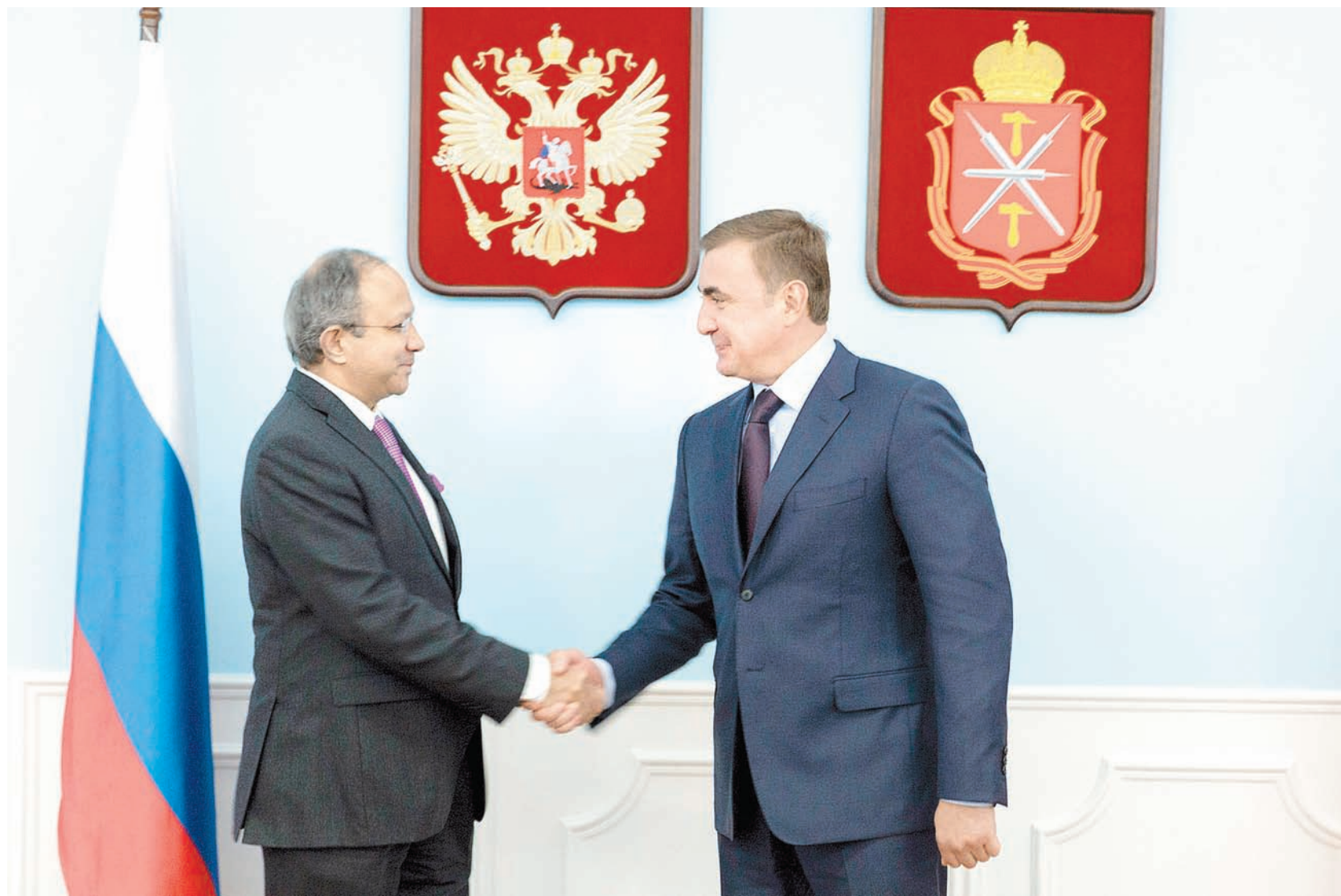
Алексей Дюмин в общении с послом отметил, что каждый крупный индийский инвестор может рассчитывать на поддержку губернатора

Сергей МИТРОФАНОВ Геннадий ПОЛЯКОВ, tularegion.ru