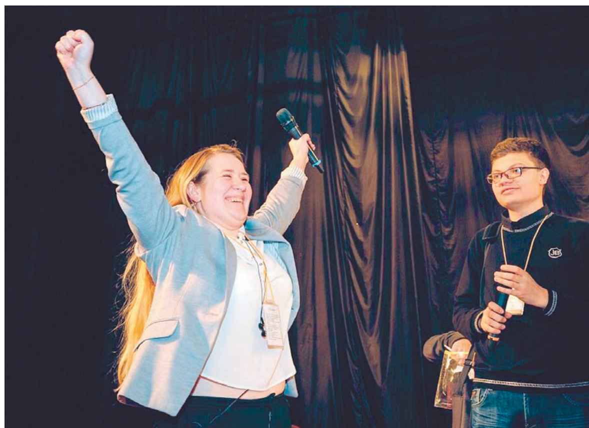
Когда народ поддержал оратора...