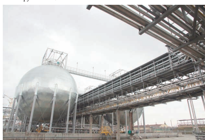
Масштабы предприятия и его деятельность произвели неизгладимое впечатление на гостей из Индии