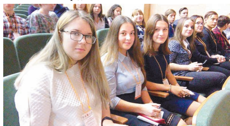
Участниками дебатов стали ученики 9–11-х классов