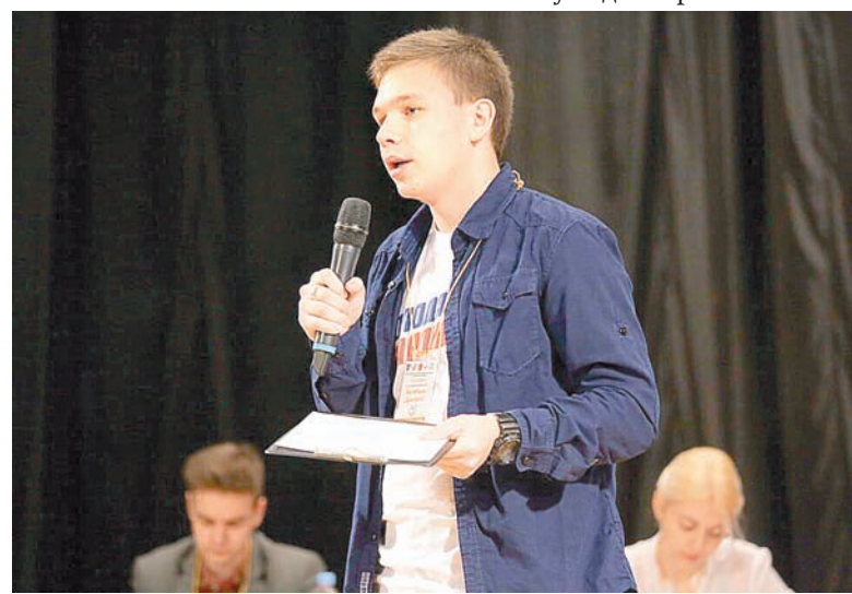
Уметь спорить – значит уметь доносить свою мысль до аудитории

Второе название этого масштабного проекта – образовательный форум, ведь команды были представлены учащимися 9–11-х классов, которым выпала возможность попрактиковаться в красноречии и логическом мышлении.