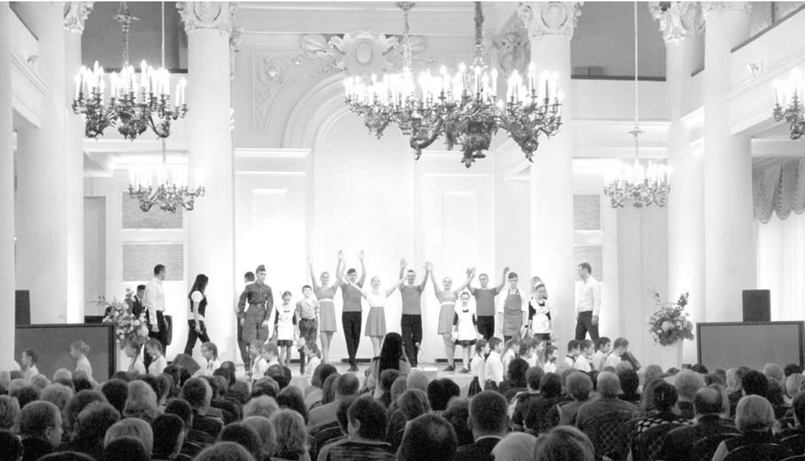
Торжественная церемония открытия прошла в Доме дворянского собрания