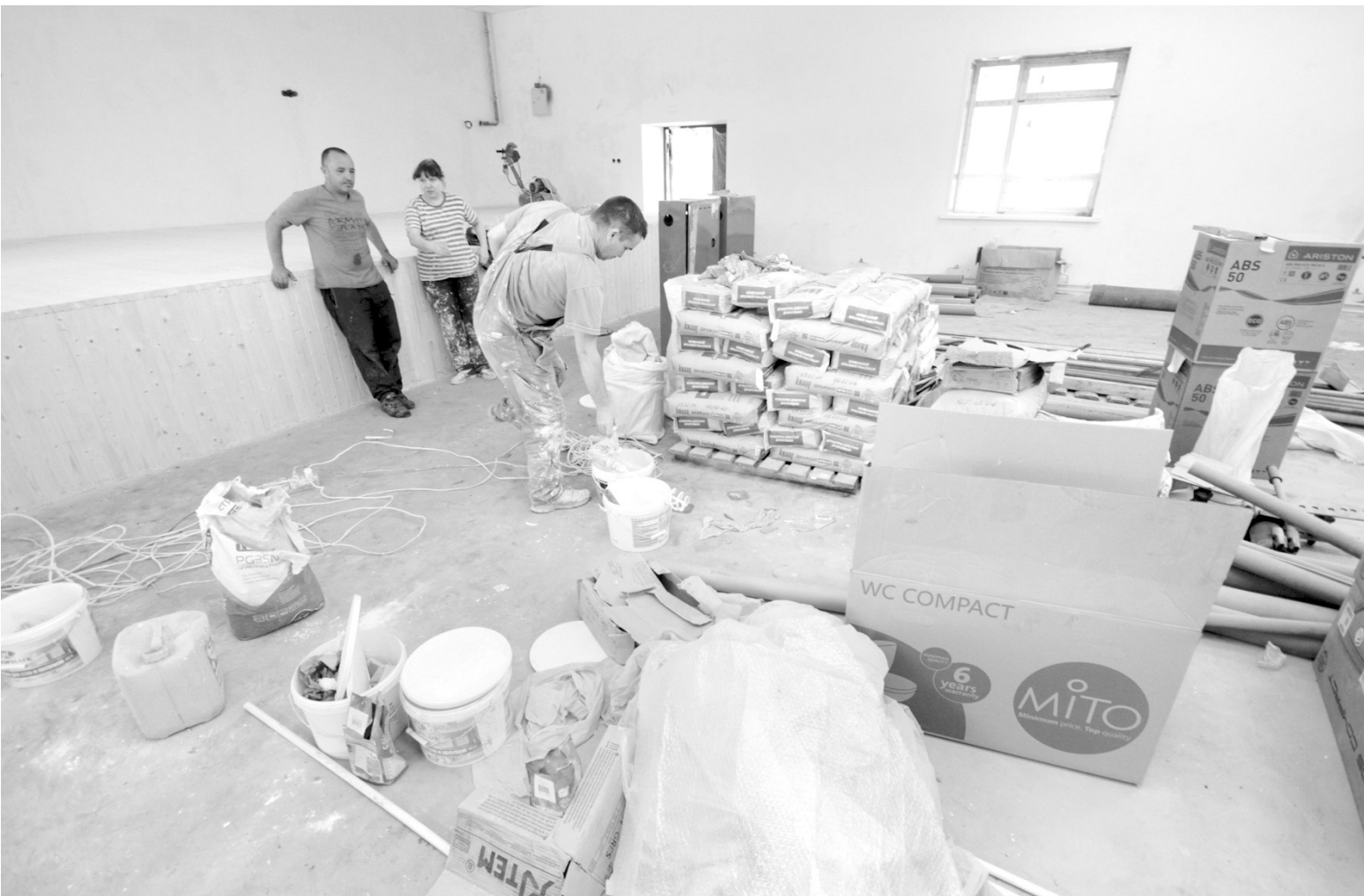
Все объекты, возводимые и ремонтируемые в Тульской области по федеральной программе «Сто клубов на селе», планируют завершить до 20 декабря этого года