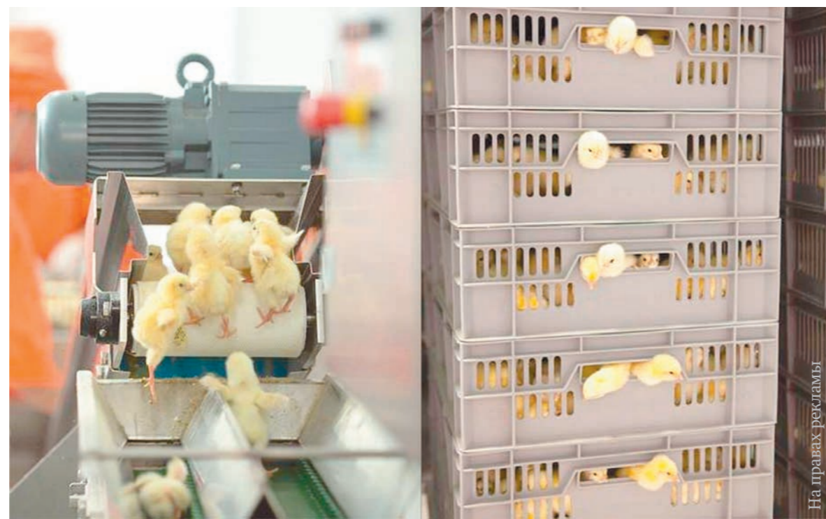
Что там, за клеткой?

ООО «Воловский бройлер» планирует открыть цех глубокой переработки, где будет производиться продукция под маркой «Своя». Руководство надеется, что она придется по вкусу тульским покупателям.