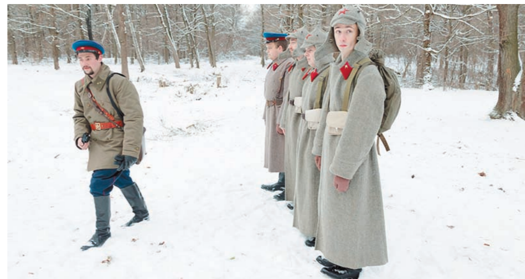
В этом году участники акции получили обмундирование, снаряжение и вооружение героических защитников города