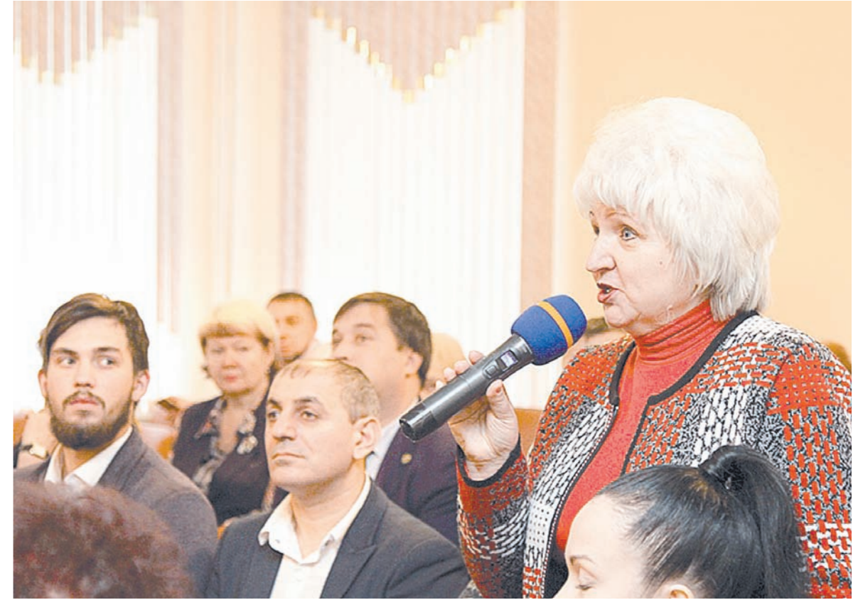
Жители Алексина рассказали о проблемах

– Мы очень рады, что смогли совместно с местной властью ре-