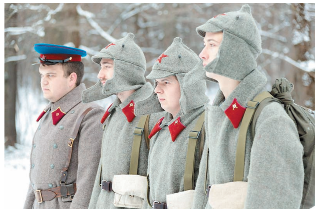
В поход по историческим местам отправились не только школьники, но и юнармейцы