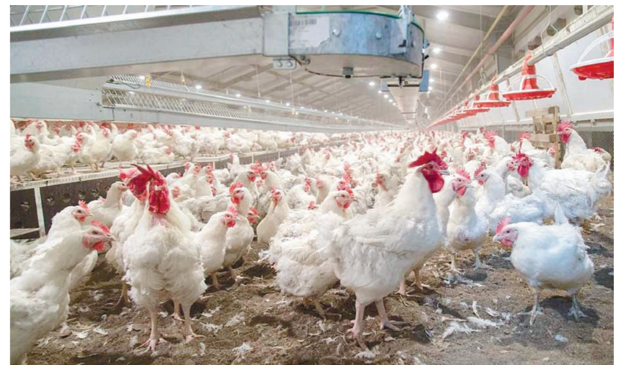
Участок содержания родительского стада

Как поясняют специалисты, если кормить и бройлеров такой мукой, то полученное от него мясо