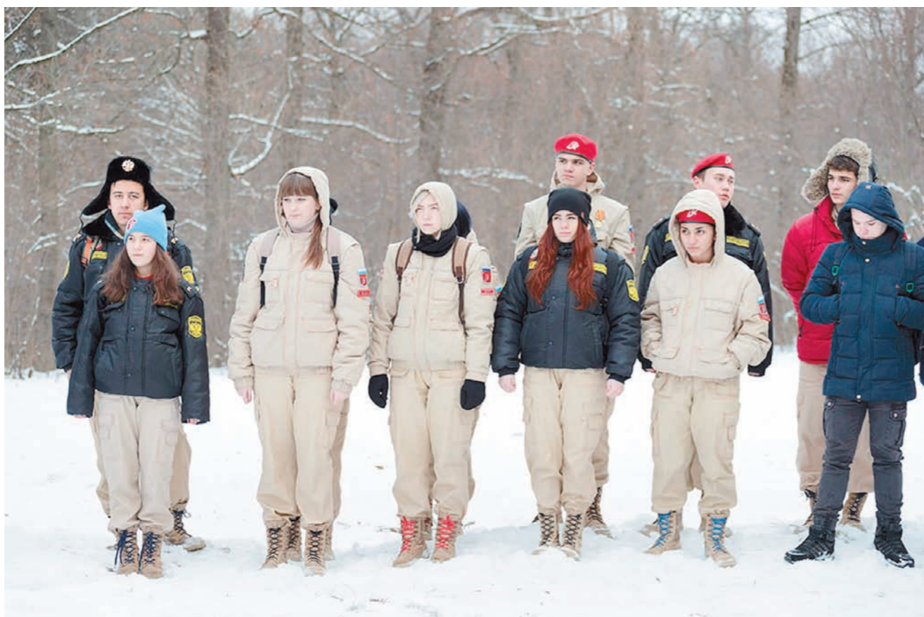
На непростой маршрут вышли и девушки