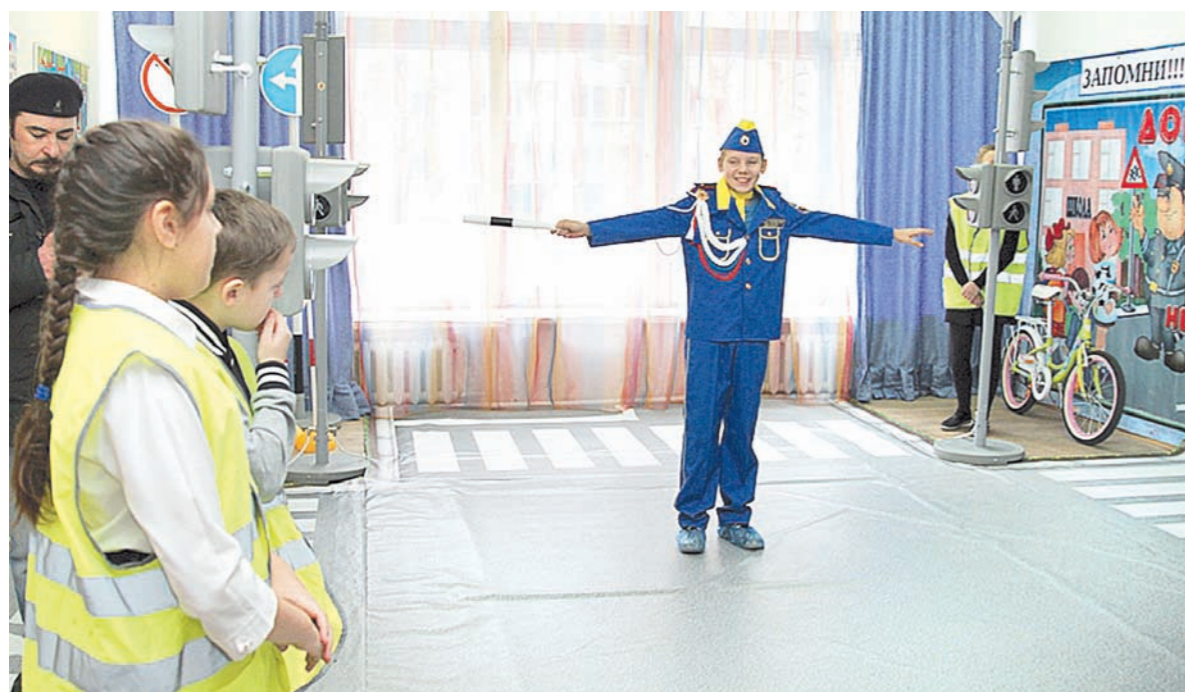
В автогородке занимаются юные инспектора дорожного движения

в программу «Доступная среда», в рамках которой для Дома творчества приобрели специальное оборудование, в том числе и «Сенсорную комнату», в которой с детьми занимаются педагоги-дефектологи. Также здесь создан детский автогородок, в котором ребята изучают правила дорожного движения.