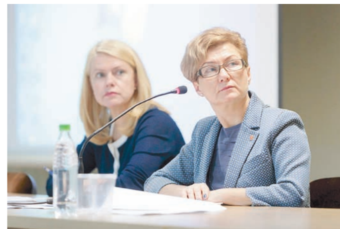
На заседании обсудили трудоустройство инвалидов и создание доступной среды

Сегодня в Городском концертном зале пройдет профилактическая акция, включающая проведение скрининговых обследований граждан с ограниченными возможностями здоровья, а 1 декабря в ГКЗ состоится торжественное мероприятие, на которое приглашены 600 инвалидов со всей области. Для них проведут мастер-классы по рукоделию и прикладному искусству, они смогут получить консультации специалистов по самым разным вопросам, а в завершение получат подарки и посмотрят замечательный концерт.