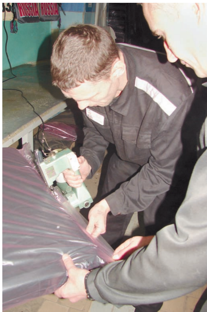
Эту партию матрасов шьют специально для столичных осужденных