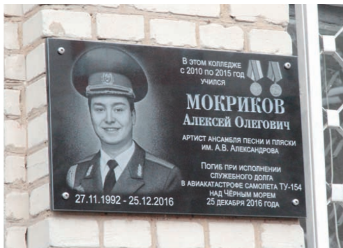
Мемориальную доску установили на здании колледжа искусств имени Даргомыжского