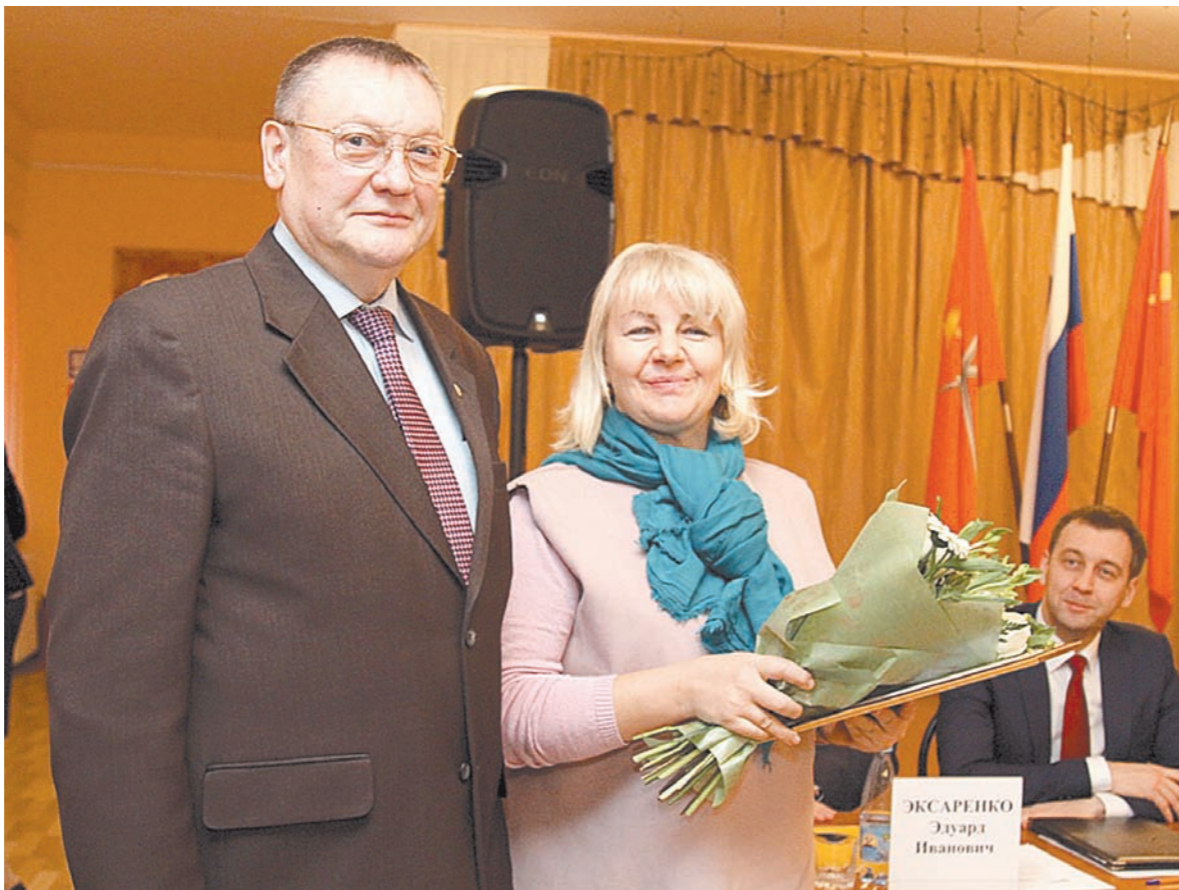
Сергей Харитонов отметил, что власть должна поддерживать общественную инициативу по разным направлениям

Перед началом встречи для членов общественного совета провели экскурсию по городу. В частности, делегация посетила Дом детского творчества. В нем занимаются почти 700 ребят, 58 из которых – с ограниченными возможностями здоровья. В нынешнем году учреждение вошло