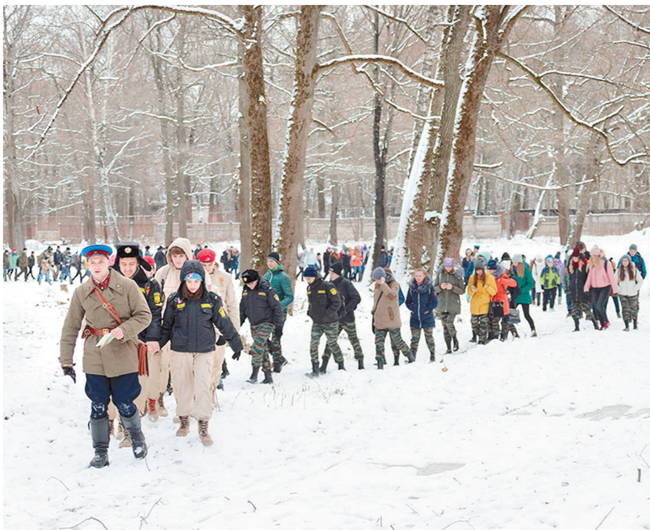
Ребята узнали новое об обороне Тулы и истории тульских засек