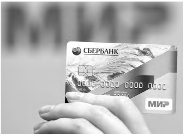
Туляки уже оценили преимущества новой карты

В том, что национальная карта – удобное платежное средство, уже убедились многие. «Мир» принимают к оплате везде, где можно расплатиться картой, – в крупных сетевых гипермаркетах и маленьких магазинах, на