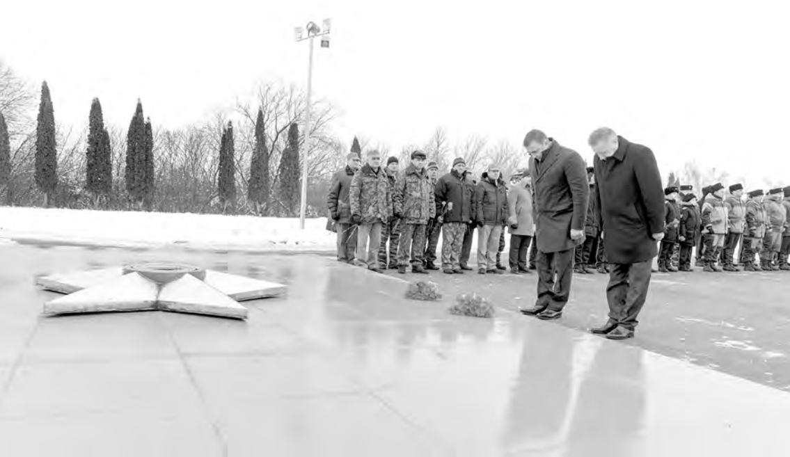
Александр Беглов и Алексей Дюмин возложили цветы к памятнику боевой славы – Кургану Бессмертия

– На координационном совете по реализации Национальной стратегии действий в интересах детей Владимир Владимирович Путин поставил задачу – решить вопрос очередности детей до 3 лет за два года. Сейчас в Туле