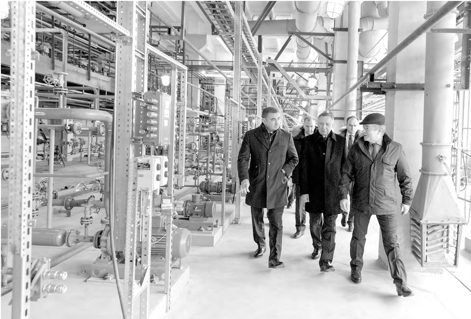
Полпред президента в ЦФО и губернатор посетили градообразующее предприятие Ефремова – завод синтетического каучука

для занятий, – подбросив один из больших гимнастических мячей, обратился полпред к малышам, занимающимся физкультурой. Расслышать что-либо после было невозможно: мальчишки и девочки с криками и пронзительным визгом устремились играть с презентами.