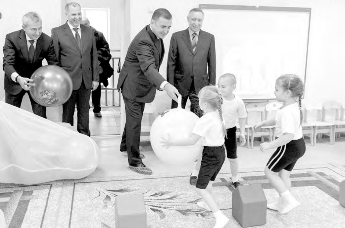
Малыши с восторгом принимают подарки от гостей – гимнастические мячи