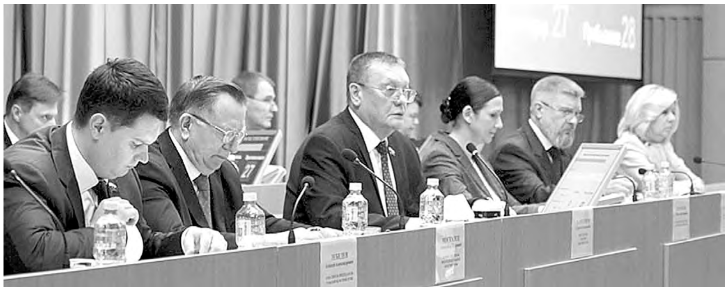
Депутаты рассмотрели в первом чтении проект закона «О бюджете Тульской области на 2018 год и на плановый период 2019 и 2020 годов»