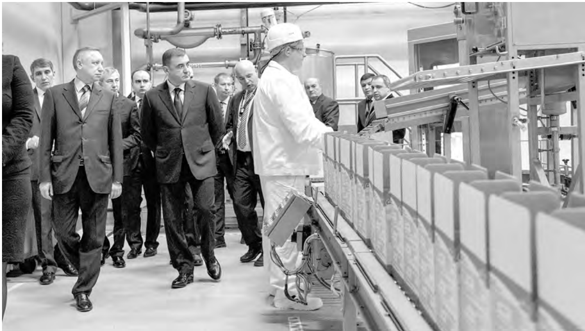
Перед совещанием участники визита осмотрели производственные линии компании «Каргилл»

арда рублей. Срок реализации проекта – 3 года, а окупаемости – 5 лет, – уточнил бизнесмен.