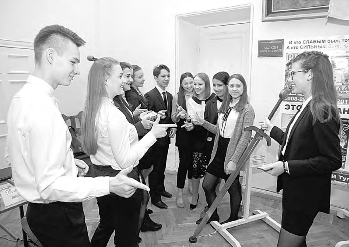
Детские общественные объединения не только рассказывали о себе, но и принимали в свои ряды новых участников

Определенного формата у фестиваля нет: здесь представлены и политические, и общественные, и арт-объединения. Веприн-