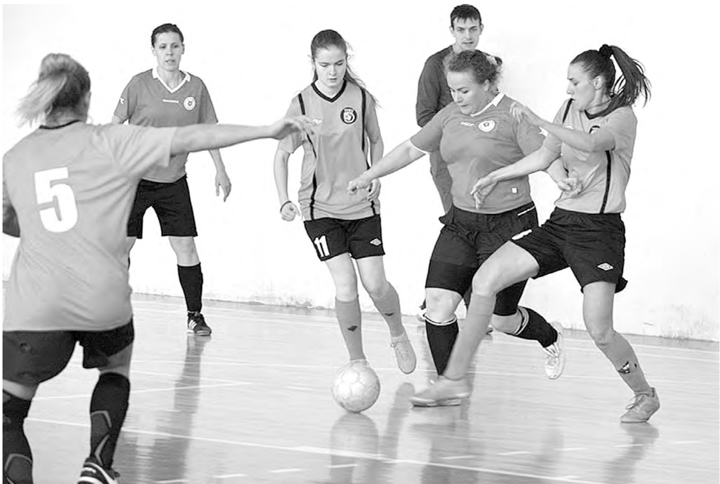
Девочки играют в футбол с большим удовольствием