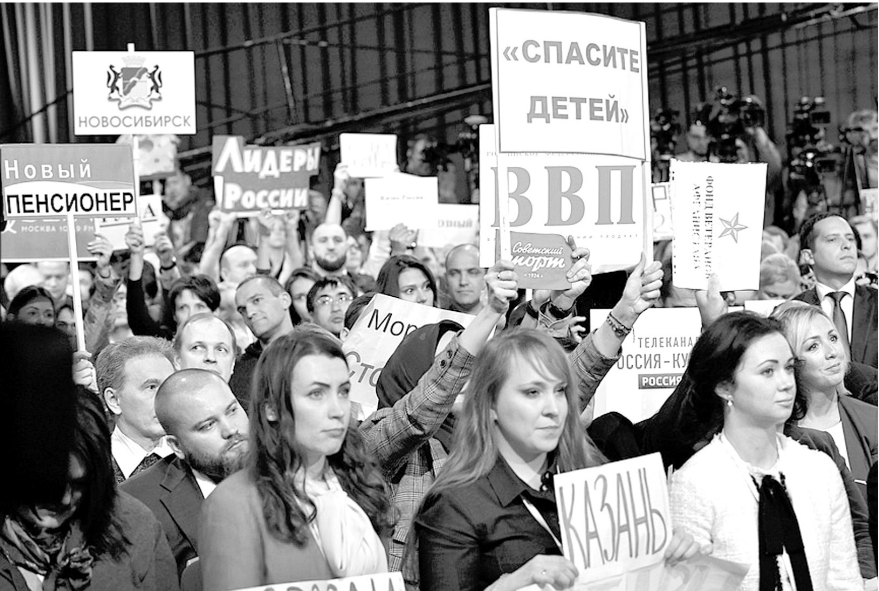
Владимир Путин за время встречи со СМИ обстоятельно ответил на самые разные вопросы

– Количество людей, которые страдают тяжелыми заболеваниями, растет, а объем выделяемых денег недостаточен. Поэтому я уже дал