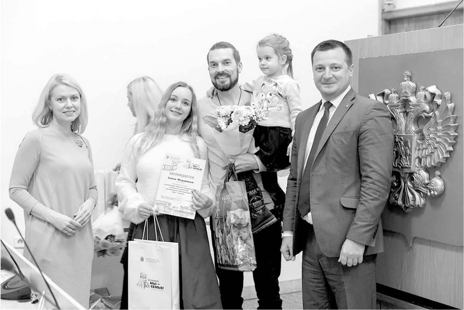
Победителям областного фотоконкурса вручили награды

Но помогают у нас не только деньгами. В этом году 2175 женщинам, имеющим несовершеннолетних детей, оказано содействие в трудоустройстве. За три года более 1100 мам, находящихся в отпуске по уходу за ребенком до трех лет, прошли профессиональную переподготовку. А с 2018 года будущие мамы, имеющие серьезные проблемы со