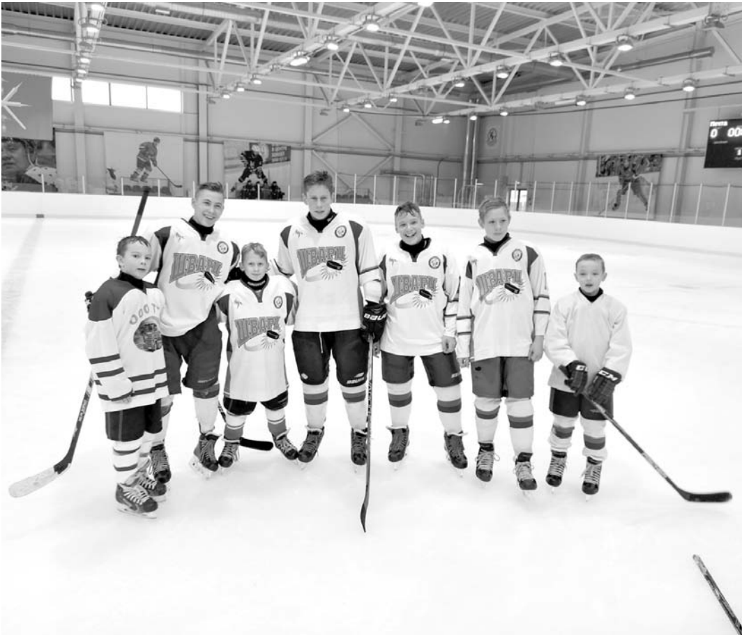
Ребята из шварцевской «Мечты» проявили себя на льду Суворовского училища

Жителей села Селиваново Щекинского района долго мучила проблема с мостом через реку Солова. Дорожное покрытие изобиловало ямами, между которыми было все труднее лавировать. Со временем даже водители автобусов стали останавливаться перед мостом, а селивановцам приходилось идти по нему пешком. В ответ же на обращения жителям предлагали ждать, пока мост капитально отремонтируют.