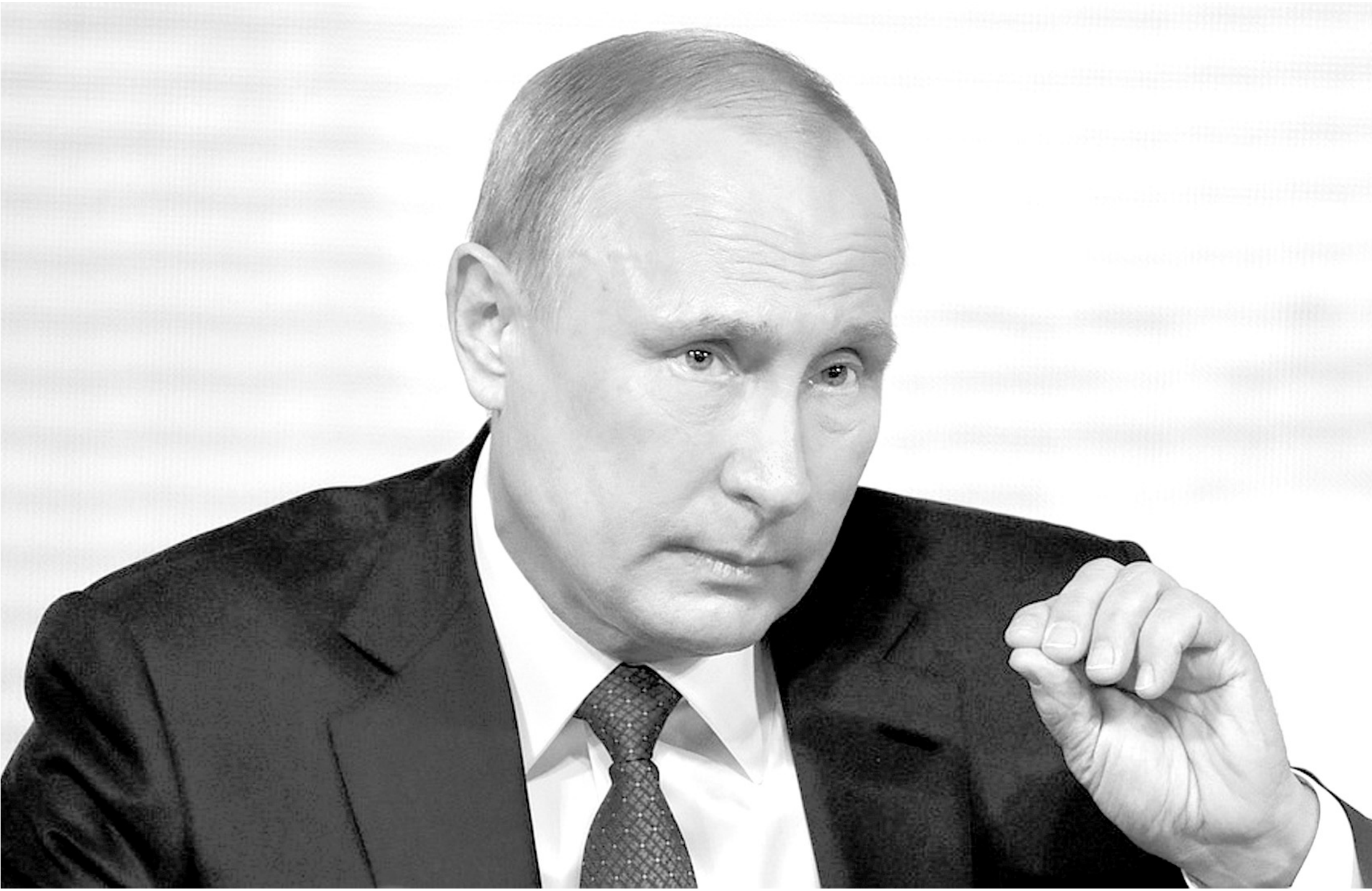
По мнению президента, Россия должна быть современной, устремленной в будущее