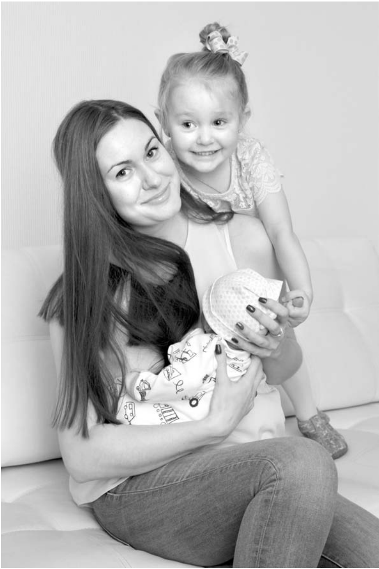
В уходящем году введен ряд новых мер поддержки молодых семей

Учреждения социального обслуживания семей и детей также играют важную роль в деле реализации государственной социальной политики. Здесь оказывается более 50 видов услуг в стационарной и полустационар-