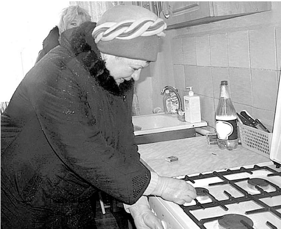
Газификация – это новая жизнь для села