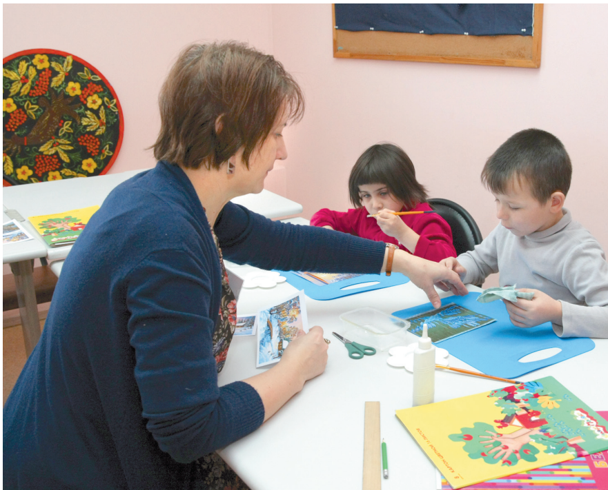
В центре и рукодельничать научат

Стационарное отделение способно одновременно принять 21 ребенка, полустационарное, действующее в две смены, – порядка сорока.