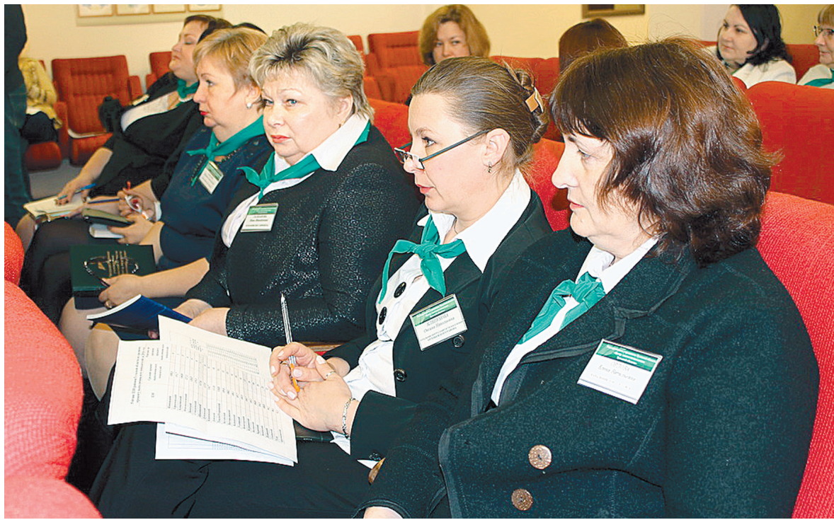
Специалистам центров занятости населения расслабляться не приходится