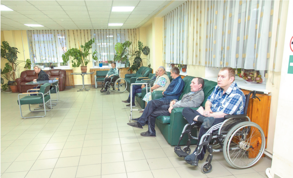
В 11 домах-интернатах Тульской области проживают более 3,5 тысячи человек

– В домах-интернатах, их в Тульской области 11, ежегодно социальные услуги получают более 3500 человек. В детском доме-интернате, таковой – один в нашей структуре, проживают 150 воспитанников, страдающих тяжелыми психиче-