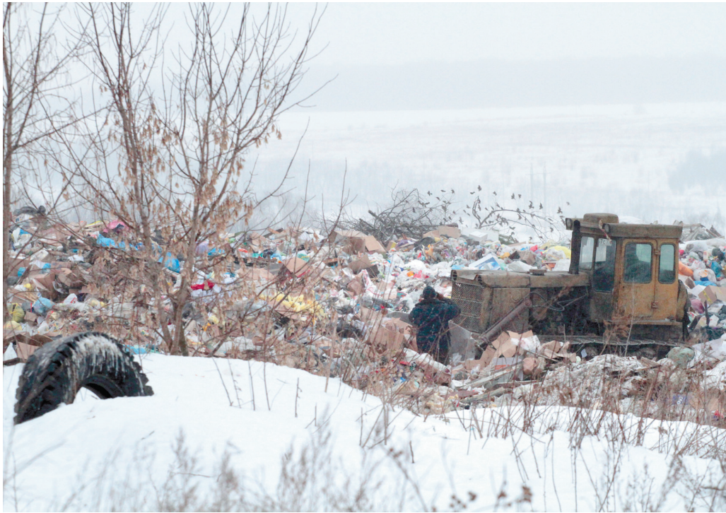
Рекультивация свалки в Шекинском районе обойдется в 100 с лишним миллионов рублей

– В настоящее время горение не фиксируется, жалобы от населения не поступают, – отчитался Олег Анатольевич. – В прошлом году за счет средств муниципального образования была разработана проектно-сметная документация для рекультивации свалки. Стоимость работ – ориентировочно 110 миллионов рублей, из них примерно 85 приходится на первичный этап. Ходатайство о финансировании мероприятий нами направлено в министерство природных ресурсов и экологии Тульской области.