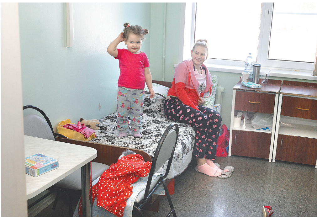
С мамой в палате почти как дома

Лимфобластный лейкоз, к счастью, хорошо поддается лечению, 80 процентов деток выздоравливают полностью.