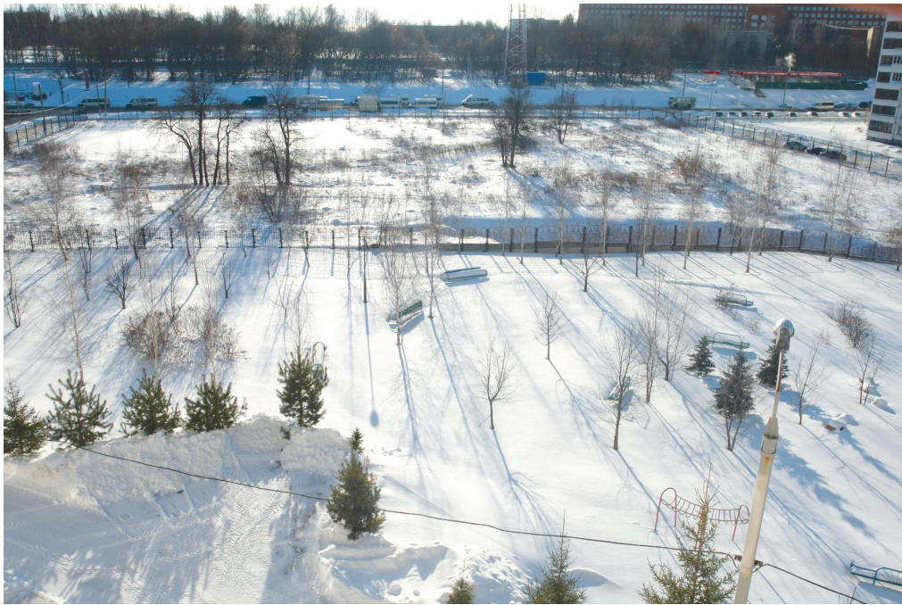
Площадка ждет строителей