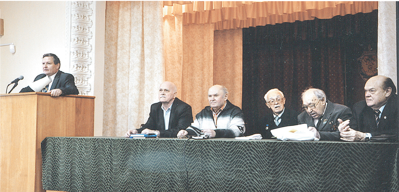
Группа членов Союза писателей России (Тульское региональное отделение)

Московская железная дорога – филиал ОАО «РЖД»