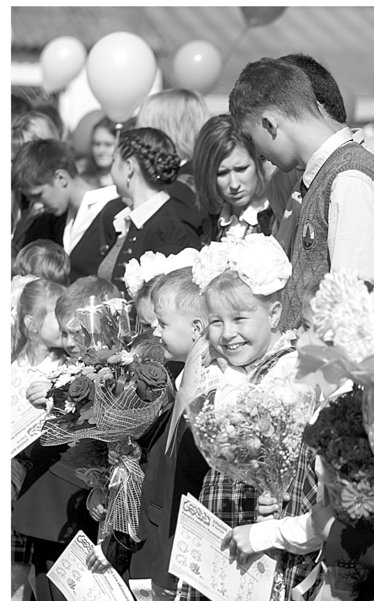
1 сентября за парты сядут больше 13 тысяч первоклассников, а записать ребят в школу можно уже сейчас

– Анализ комплектования общеобразовательных учреждений в первый день приемной кампании показал, что было подано 1 865 заявлений. На 6 февраля их было уже 3 964, – уточнила глава областного минобра. – Если говорить в процентном соотношении от прогнозируемого числа первоклассников, которые придут в школы 1 сентября 2017 года, то это больше 30 процентов. Выслушав доклад руководителя ведомства