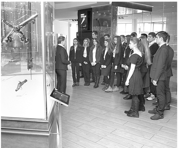
Для каменских школьников провели экскурсию

Экскурсовод рассказала гостям историю учреждения. Еще в прошлом столетии был создан заводской музей. А почти полвека спустя появился уже известный далеко за пределами нашей страны «шлем», где подлинники соседствуют с высокими технологиями.