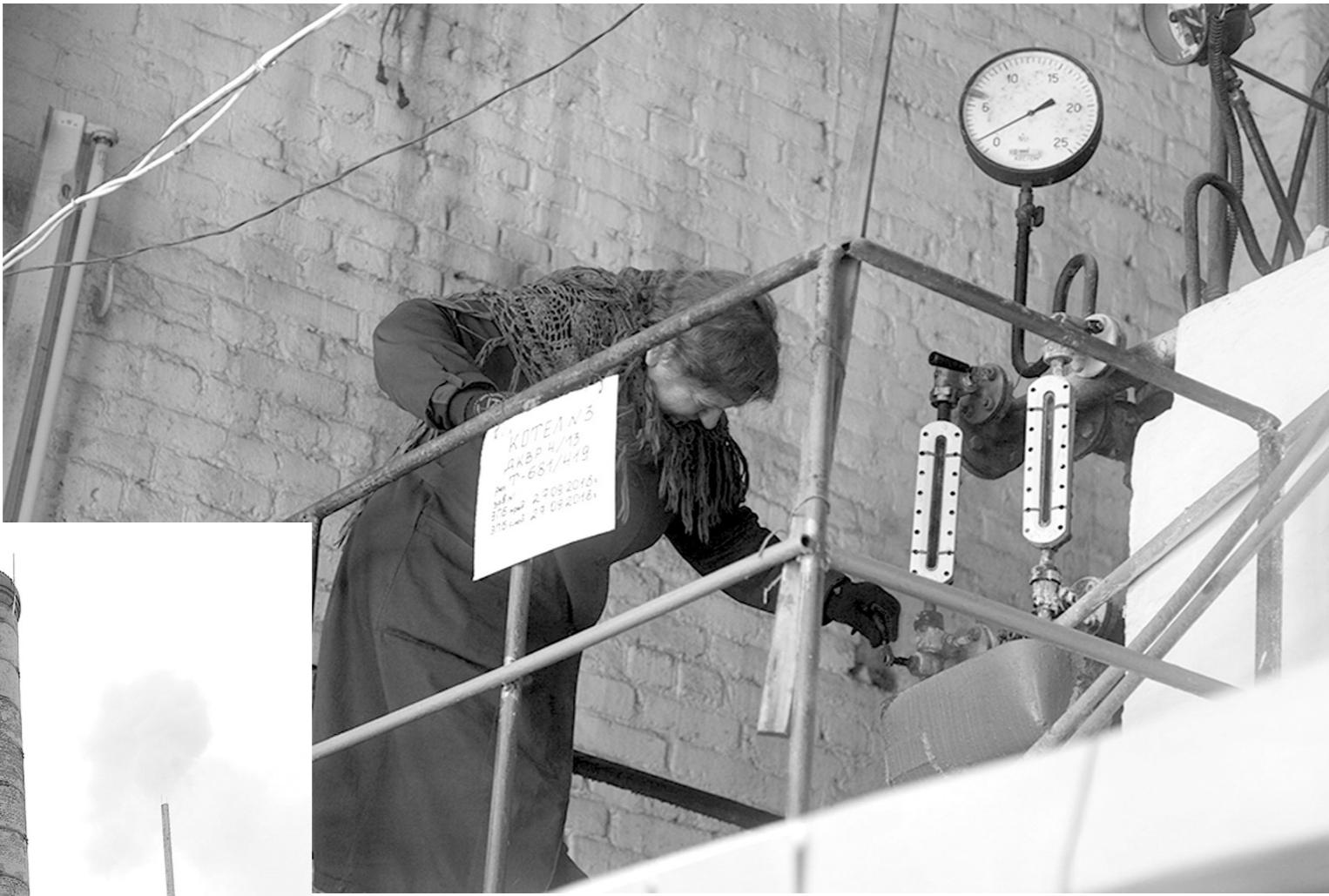
Киреевской котельной №3 в этом году исполняется 60 лет

Граждане, проживающие на улицах Титова, Школьной, Горняков, Толстого и некоторых других, сообщали, что в их квартирах столбик термометра опустился до плюс тринадцати градусов, мерзнут старики и дети, к