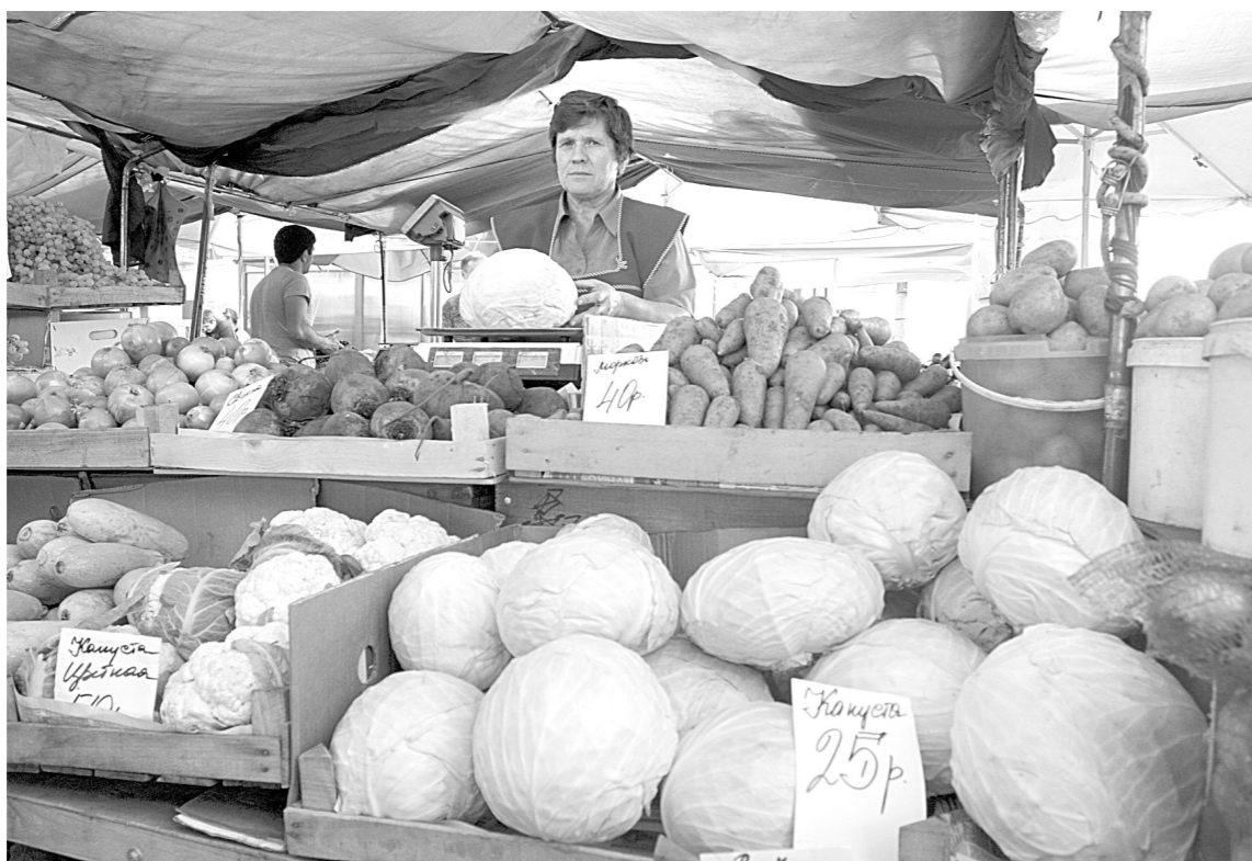
Фермеры хотят, чтобы на их продукцию устанавливали минимальные закупочные цены, обеспечивающие доходность сельхозпроизводства