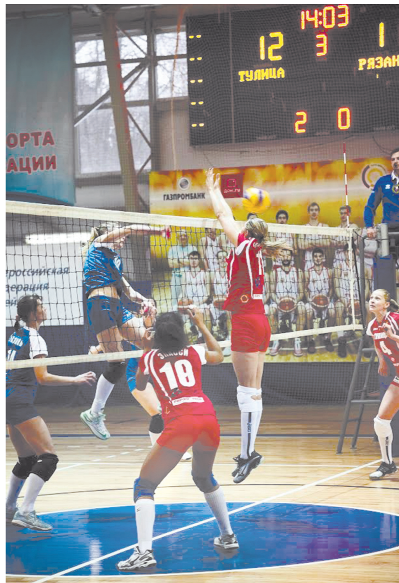
Волейболистки возрожденной «Тулицы» лидируют в зональном турнире

бухующее больших вложений, – тем не менее процесс идет. Например, – разновидности, которой занимаются люди с проблемами здоровья, в основном опорно-двигательного аппарата. В 2013 году в Алексине была создана первая в Европе детская команда «Ладога». Составленная исключительно из местных ребят, она скоро показала себя и