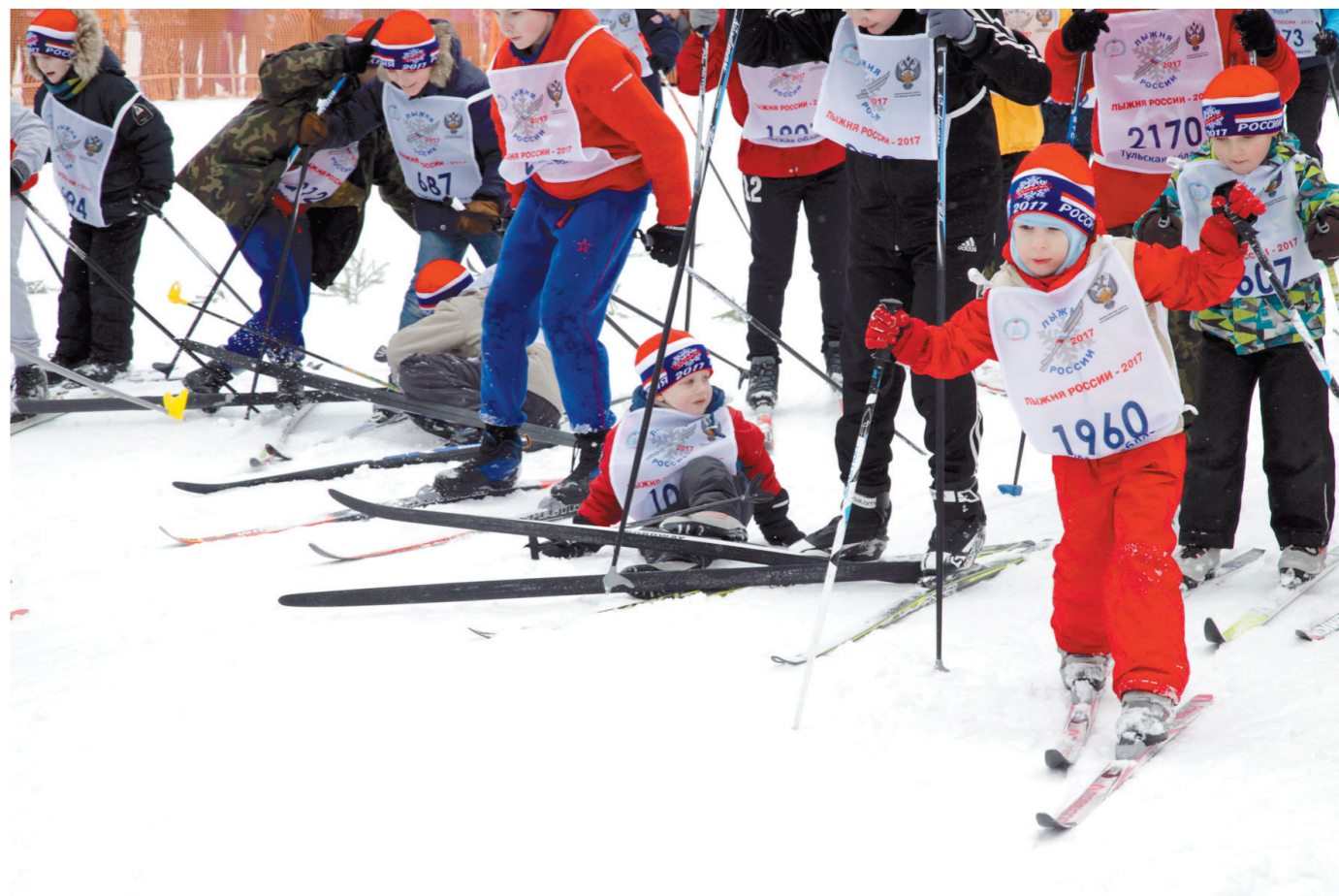
Без завалов не обошлось