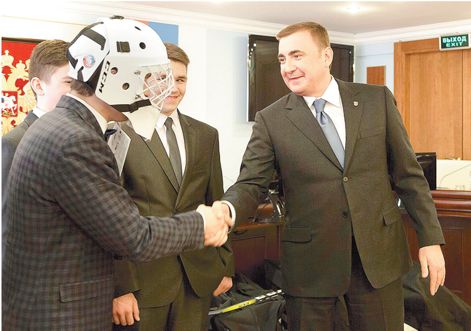
Губернатор исполнил мечту ребят

На августовском совещании глава региона поддержал обраще-