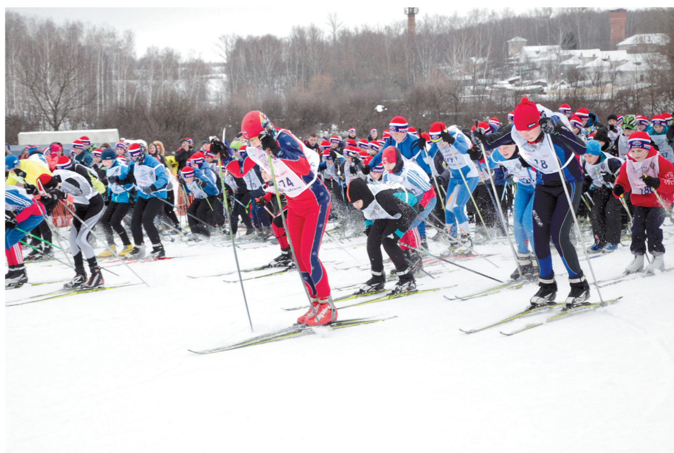
Тысячи лыжников вышли на старт