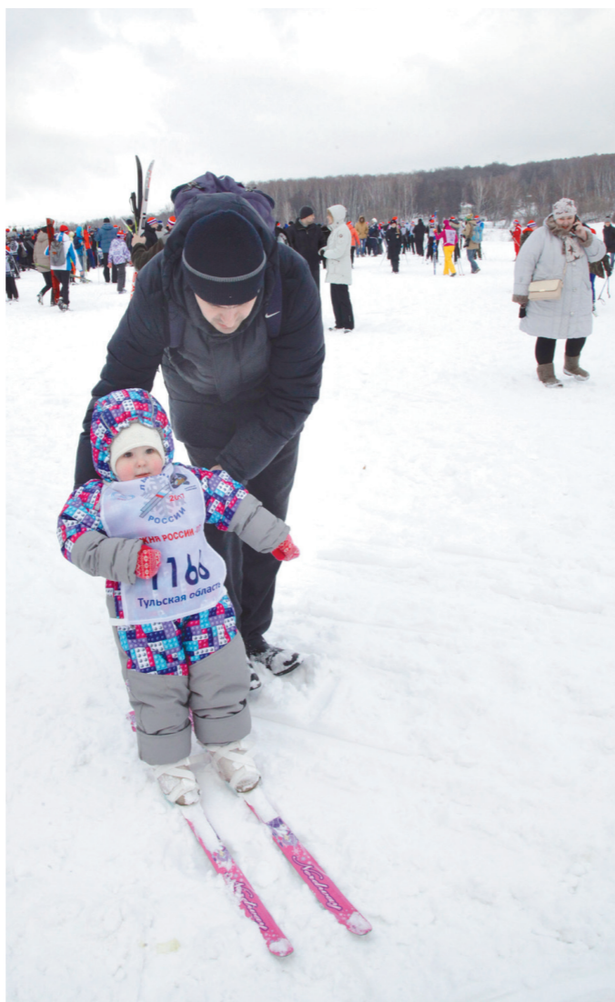
Первые шаги – под отцовским присмотром

Московская железная дорога – филиал ОАО «РЖД»