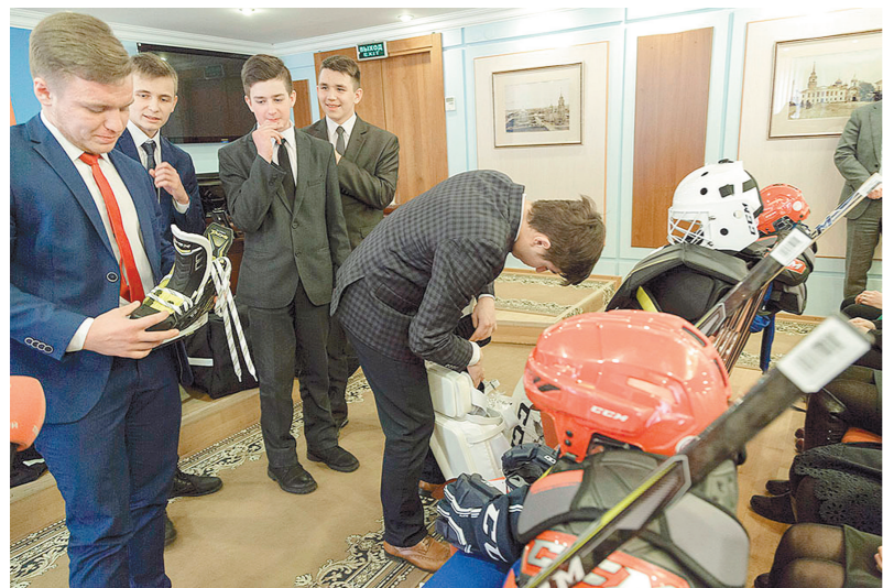
17 комплектов хоккейной формы получили каменские школьники

бухующее больших вложений, – тем не менее процесс идет. Например, – разновидности, которой занимаются люди с проблемами здоровья, в основном опорно-двигательного аппарата. В 2013 году в Алексине была создана первая в Европе детская команда «Ладога». Составленная исключительно из местных ребят, она скоро показала себя и