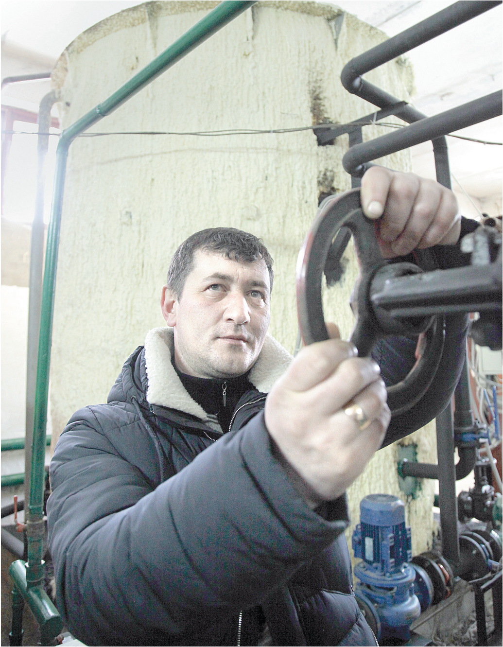
Реконструкция котельной АДС помогла дать горячую воду близлежащим домам

Для решения проблемы в 2015 году администрация МО Узловский район разработала проект на техническое перевооружение котельной АДС. Мероприятия по улучшению горячего водоснабжения провело ресурсоснабжающее предприятие: рабочие смонтировали бак-аккумулятор,