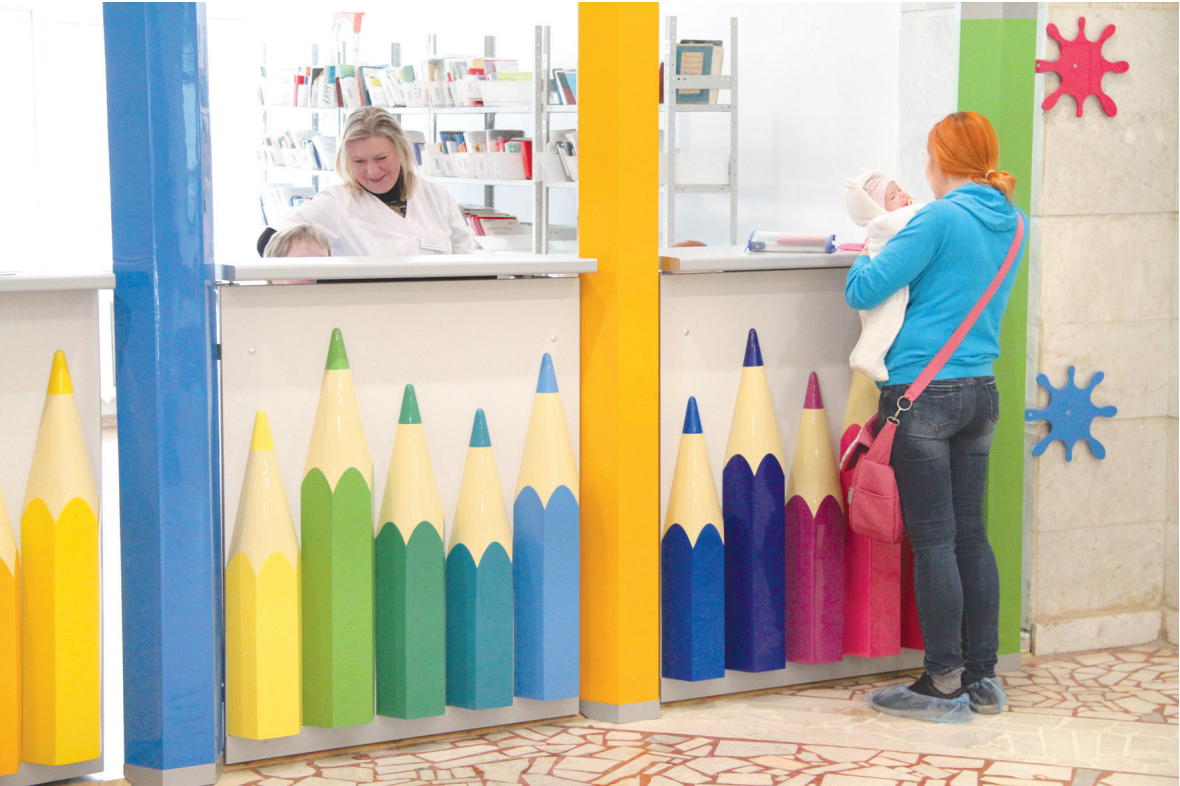
Открытая регистратура: очередей нет

Пациенты могут записаться на прием различными способами, и практически весь поток, а это 1000 человек в день, все необходимое делает в заранее обозначенное время. Резервное время тоже планируется заранее, что позволяет быстро решать вопросы «неорганизованных» пациентов. Регистратура распределяет потоки больных: кто-то сразу идет на фильтр, кто-то в кабинет неотложной помощи, куда можно вызвать любого консультанта; если нужна справка для детсада или бассейна, пожалуйста в кабинет «здоровое детство» и т. д. По коридору, вдоль кабинетов врачебного приема ходит дежурный администратор, который в оперативном порядке решает все затруднения пациентов. Результатом таких организационных изменений