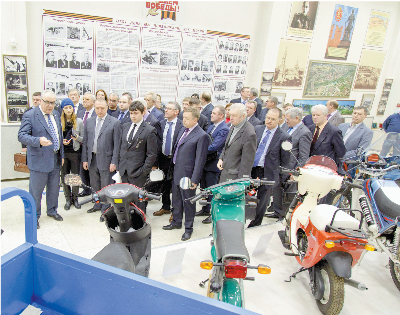
«Туламашзавод» готов вновь производить мотороллеры – если удастся победить в конкурентной борьбе

У АО «Пластик» в высокой степени готовности находится проект по производству из