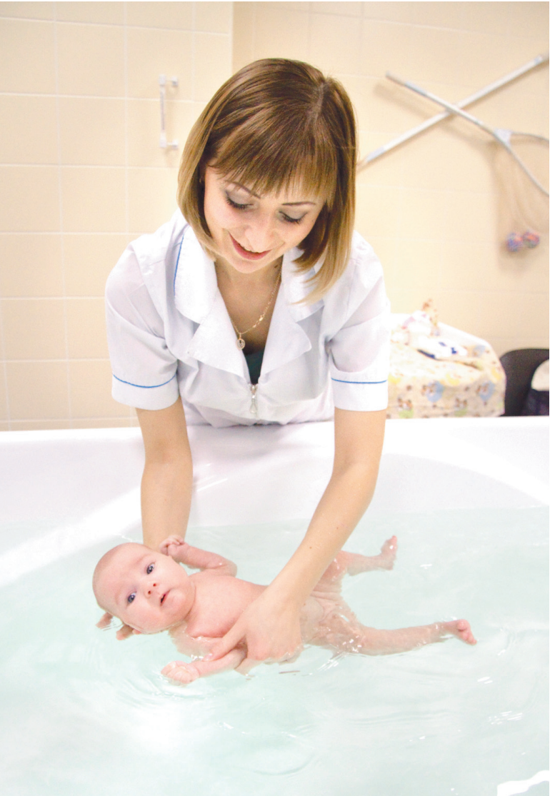
Плывать раньше, чем ходить

В завершение для родителей с детьми была организована экскурсия в новенький бассейн, который по медицинским показаниям можно посещать совершенно бесплатно.