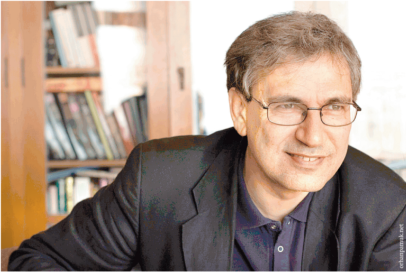
Орхан Памук ждал возможности попасть в Ясную Поляну почти полвека

– Там присутствует толстовский панорамный подход. «Это история жизни и ежедневных размышлений торговца бузой и йогуртом Мевлюта Караташа. Мевлют появился на свет в 1957 году...» – так начинается роман, который я писал шесть лет. Речь идет о людях, приехавших в 50-е годы из провинции в город и выживавших в тяжелых условиях без