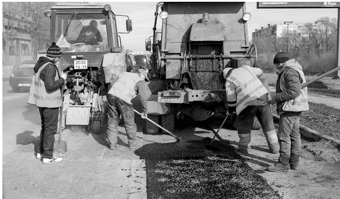
Этой весной дороги ремонтируют по технологии литого асфальта

Глава региона напомнил, что после схода снега требуется подновить дорожную разметку. Сити-менеджер доложил, что конкурс на эти работы разыгран, начать нанесение разметки планируют с участков в непосредственной близости от образовательных учреждений.