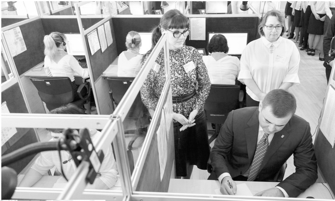
Алексей Дюмин лично принимал звонки жителей Узловой, Ясногорска и Тулы

— Вы являетесь связующим звеном между жителями региона и правительством Тульской области, — отметил он. — Каждый звонок — это крик о помощи, и вы эту помощь оказываете правильными действиями. Без вас нам не обойтись.