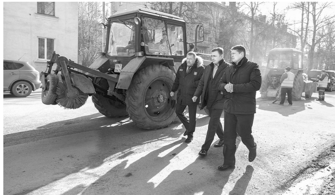
Глава региона проконтролировал ход дорожного ремонта в Туле