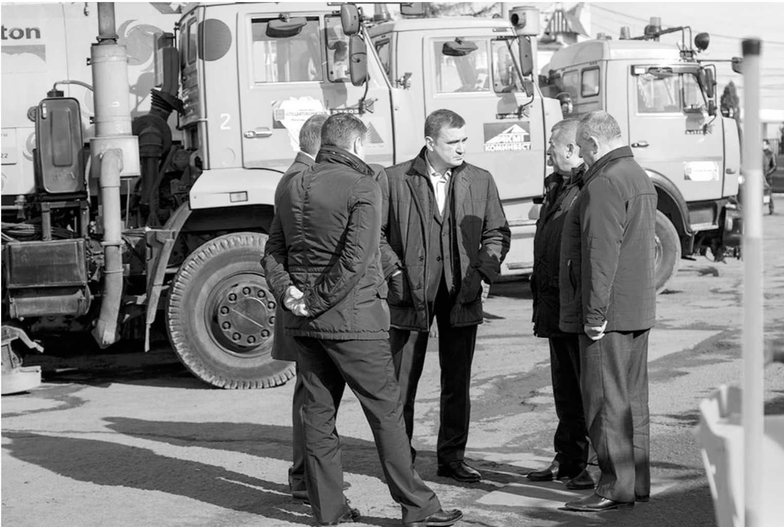
Алексей Дюмин напомнил работникам «Спецавтохозяйства» о необходимости оперативно очистить город от мусора