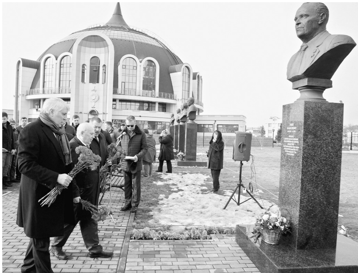
К бюсту талантливого оружейника многочисленные туляки возложили живые цветы

Экскурсовод добавила, что ребята увидели в этот раз только некоторые образцы оружия. Когда откроется новая экспозиция