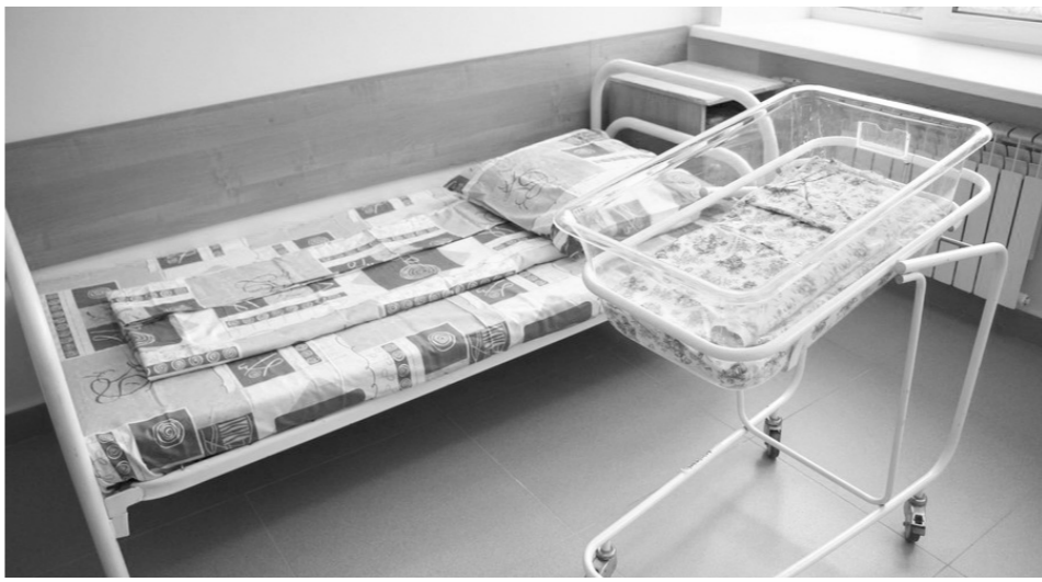
В акушерском стационаре созданы комфортные условия для пребывания молодых мам с детьми

В акушерском стационаре, который одновременно может принимать до 45 человек, созданы комфортные условия для пребывания молодых мам с детьми, а также для работы медицинского персонала. Здесь полностью заменили двери, сантехнику, коммуникации, выполнили плиточные работы в режимных кабинетах. Дол-