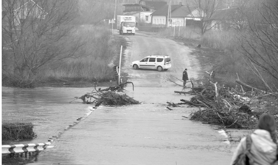
Этой весной опасность подтопления грозит 20 низководным мостам

Для дополнительной страховки была подана заявка на выделение двух средств от Тульского спасательно-поискового центра в случае необходимости с их помощью организуют переправу в районе населенных пунктов Никольское Щекинского района и Ханино Суворовского района. А Тула, Ефремов, Одоевский и Белевский районы заключают соглашения с судоводителями муниципалитетов.