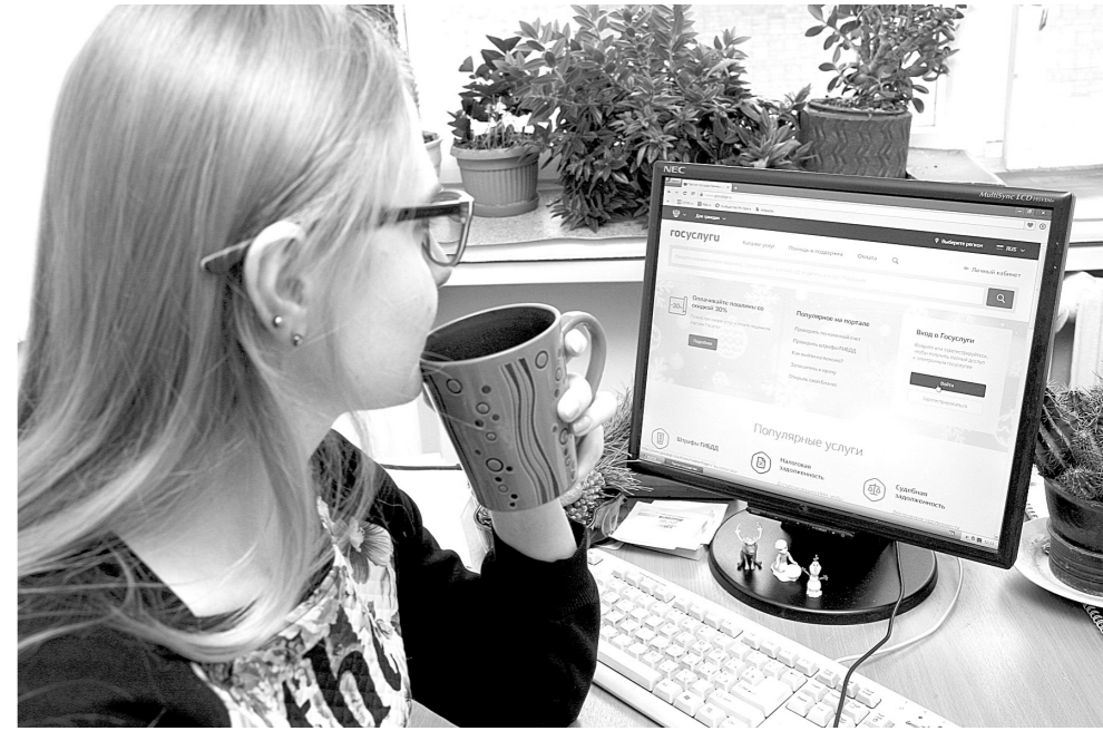
Электронные услуги помогают улучшить качество жизни туляков

Медицинские работники Тульской области, врачи-терапевты, врачи других специальностей, фельдшеры, медицинские работники выездной бригады обязаны выписывать рецепты на наркотические сред-