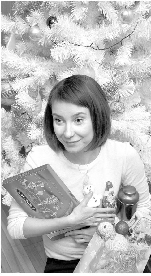
Может, лучший подарок все-таки деньги?

А ведь просто порой стоит расслабиться и получать удовольствие от того, что есть. Завтра Старый Новый год. Есть возможность исправить ошибки празднования.