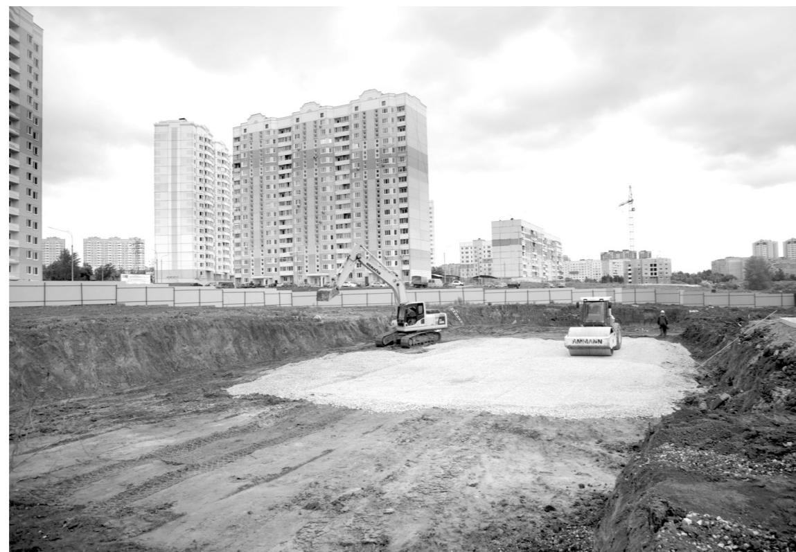
Банк-санатор компании «СУ-155» анонсировал вложения в достройку объектов порядка 14,7 миллиарда рублей в текущем году и подтвердил намерения исполнить обязательства до конца 2018 года

Он также отметил, что в России более 100 тысяч обманутых дольщиков. Напомним, среди них оказались и клиенты «СУ-155»: один из крупнейших отечественных девелоперов оставил недостроенными объекты в 14 субъектах страны, в том числе и в Тульской области. Благодаря активным действиям губернатора Алексея Дюмина дома в нашем регионе были включены в первую очередь достройки. Так, уже в конце минувшего года в ЖК «Новая Тула» были подведены инженерные коммуникации, пущен газ, полностью завершены работы по благоустройству территории. Как сообщает сайт банка-санатора, корпус №2 введен в эксплуатацию. Этот дом предназначен для переселения людей из аварийного жилья. Корпус №1 новые подрядчики предполагают сдать в первом квартале текущего года. Возведение комплекса МКД продолжится и на северо-востоке Тулы, в ЖК «Парус», где