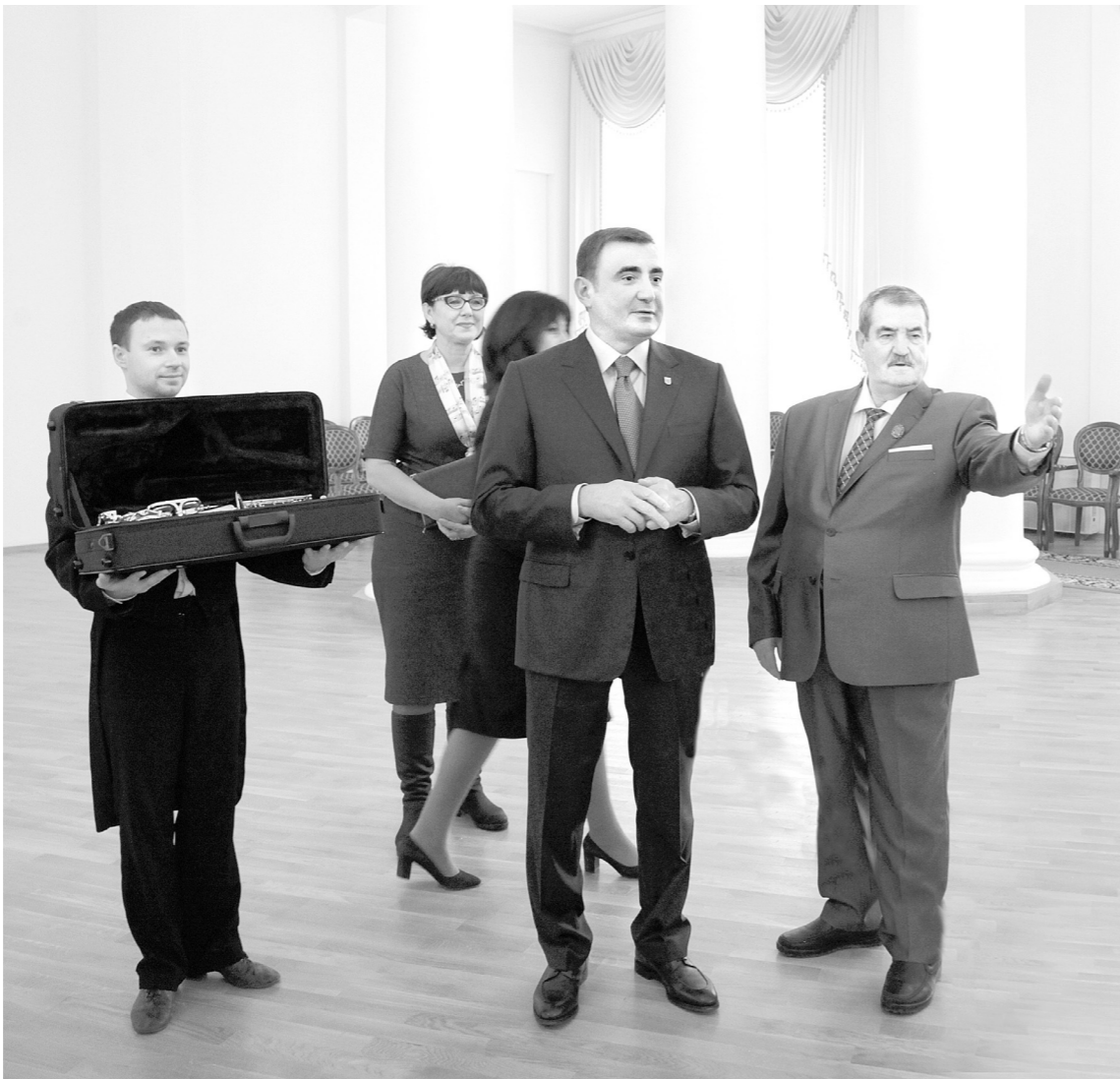
Алексей Дюмин подарил юным музыкантам профессиональные инструменты

Воспитанники школы исполнили для главы региона музыкальные произведения. Дюмин