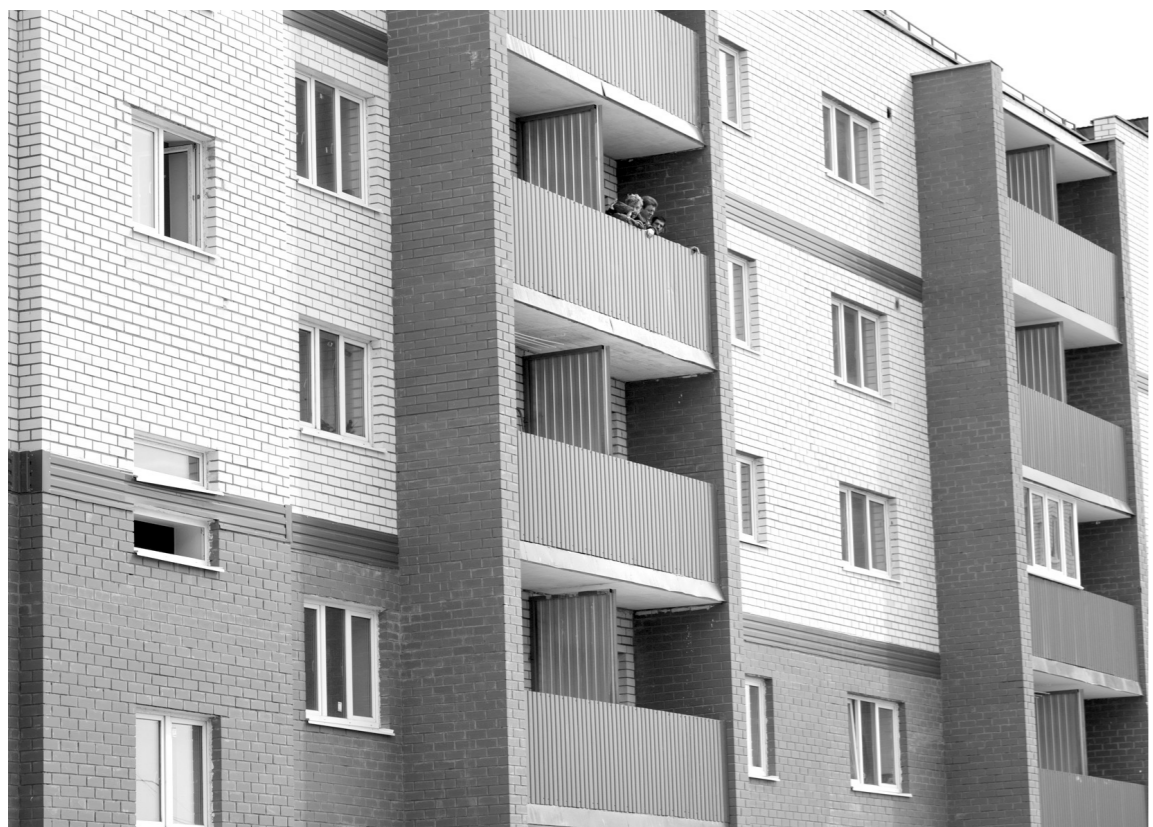
В первом квартале планируют ввести в эксплуатацию дома в трех муниципалитетах