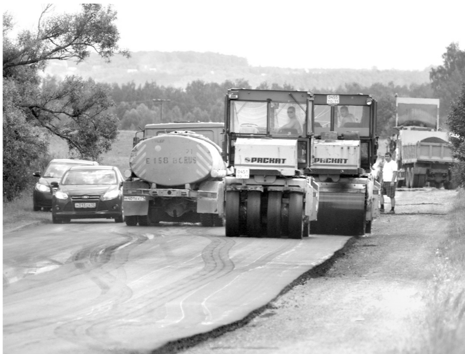
В наступившем году «Тулаавтодор» намерен выпустить 710 тысяч тонн асфальтобетонной смеси, которой должно хватить для запланированного ремонта дорог

В планах областного минтранса на текущий год также указаны работы по освещению 50 километров региональных автодорог. Как отметил руководитель ведомства, наша область в этом году участвует и в реализации стратегического направления «Безопасные и качественные дороги», в рамках которого разработана программа комплексного развития транспортной инфраструктуры Тульской области. – Целями этой программы является