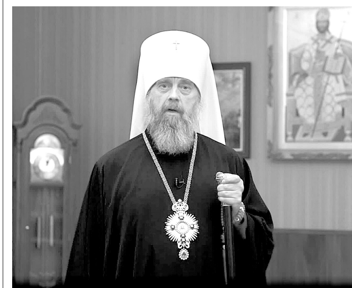
Радуйтесь, люди, и веселитесь: Христос воскрес из мертвых, Спас мира Стихира на Хвалитех понедельника Светлой седмицы

Вседушевно радуясь и молитвенно торжествуя, Христорогивая Полнота Святой Соборной Апостольской Церкви единогласно благодарит и благоговейно восприславляет в эти нареченные и святые дни Жизнодавца Христа, упразднившего жертвенным подвигом самозабвенной любви к роду человеческому владычество всеобщей смерти, утвердившееся в человеческом естестве через самовластное уклонение свободного произволения естеством к естественному им боголюбия к противоестественному богозавению и богонечувствию, от жизненности послушания всеблагой воле Божией к вредоносному греху. В добровольном принятии крестных страданий и смерти, священной для нас, яко Иерей во век по чину Мелхиседеку (Евр. 5, 6), наше избавление от неклочимых адовых уз, Христос Спаситель, плотню уснув, яко мертв, тридневно воскрес – Первенец от умерших (Кол. 1:18), и мы «смерти празднуем умерщвление, адово разрушение, иного жития вечного начало, и играюще поем Виновника – отцов наших Бога препрославленного!» (7-я песнь Пасхального канона).