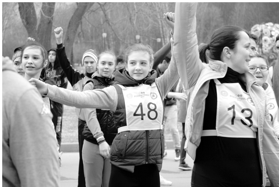
Перед забегом для ребят провели согревающую разминку

На дистанцию в Белоусовском парке вышли более