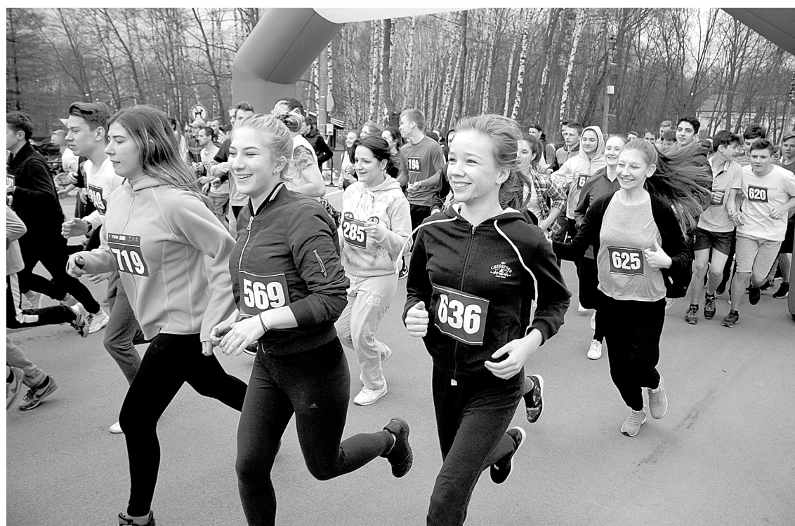
Погода не испортила настроение тем, кто вышел на старт

– Поддерживая такие акции, вы доказываете, что волонтерство вышло на новый уровень. За добровольцами идет, с них берут пример, – сказала она.