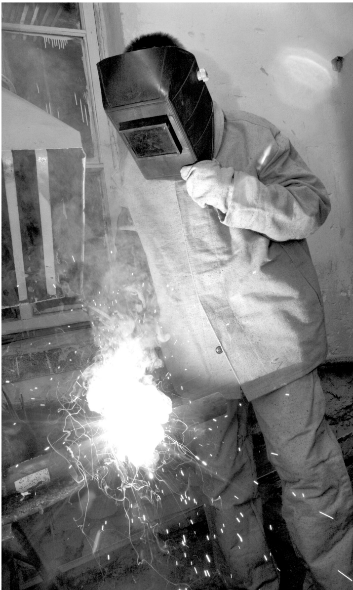
Работа со сваркой здоровья не прибавляет. Значит, нужно заботиться о профилактике заболеваний

Но вернемся к коллективной дозе облучения. Ее средний показатель в расчете на одного жителя области составил 3,9 мкЗв (микрозиверта) в год, что соответствует среднероссийскому уровню.