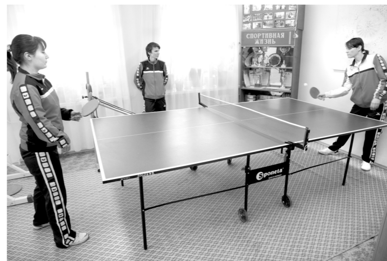
Настольный теннис – один из любимых видов спорта в этом интернате

ся управляться с тяжестями. Но есть и другие увлечения. Вышиваю крестиком, а недавно освоила алмазную мозаику – это когда картины выкладываются мелкими-мелкими камушками. Работа очень кропотливая и трудоемкая, но мне такая по душе.