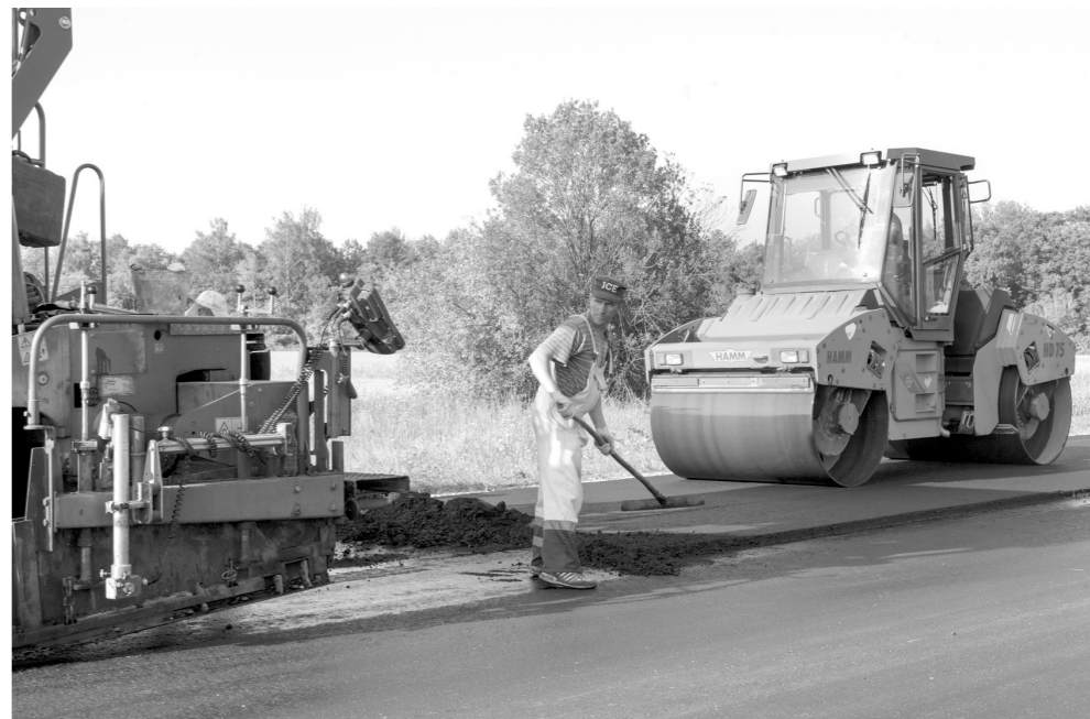
В этом году туляки закупят асфальт в других регионах уже не будут

– А 200 миллионов рублей из 450 было выделено на приведение в порядок автомобильных дорог, в частности, 130 израсходовали на ремонт трассы до населенного пункта Плотичино, а 70 пошли на ремонт улиц города Белева, – добавил министр.