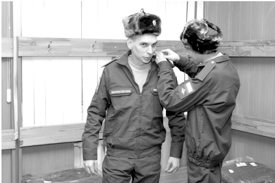
Последние приготовления – и в войска!

По итогам осенней кампании, число граждан, не при-