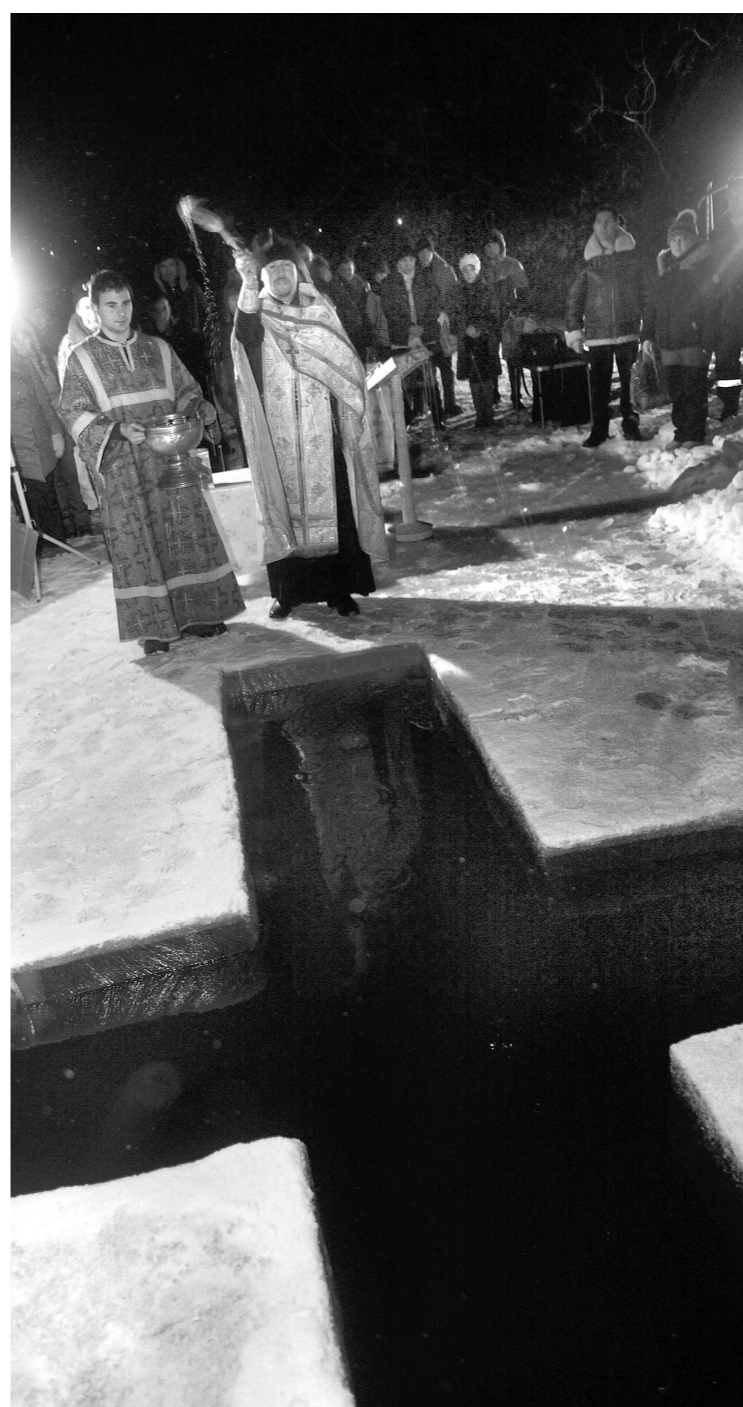
Купели и проруби появятся по 37 адресам

лучше всего постепенно, чтобы избежать рефлекторного сужения сосудов головного мозга.