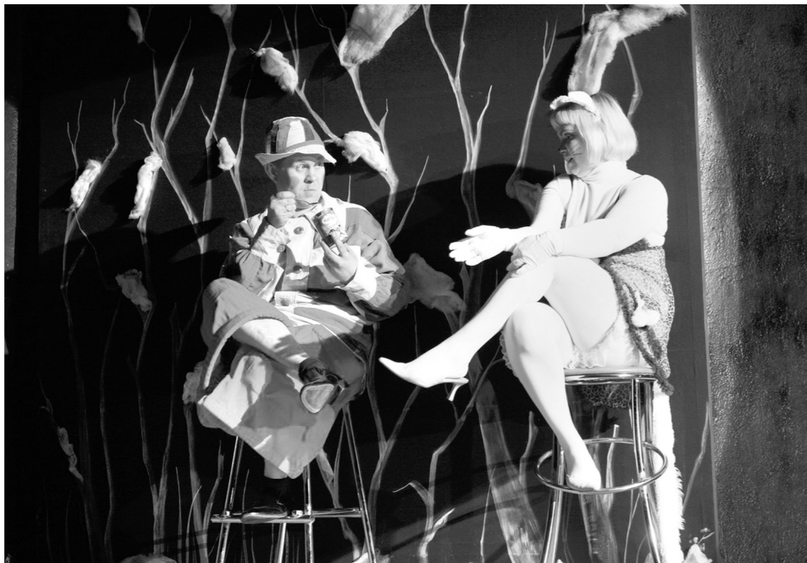
Новый год и пирожки с капустой

И, наверное, поэтому в Тульском ТЮЗе, отыграв все сказки, традиционно показывают капустник для взрослых: шаловливый (в формате 18+), веселый, импровизационный. Участвуют в нем буквально все сотрудники театра, даже те, кому по штату положено пребывать за кулисами, – не только актеры, но и осветители, звукорежиссеры, работники цехов.