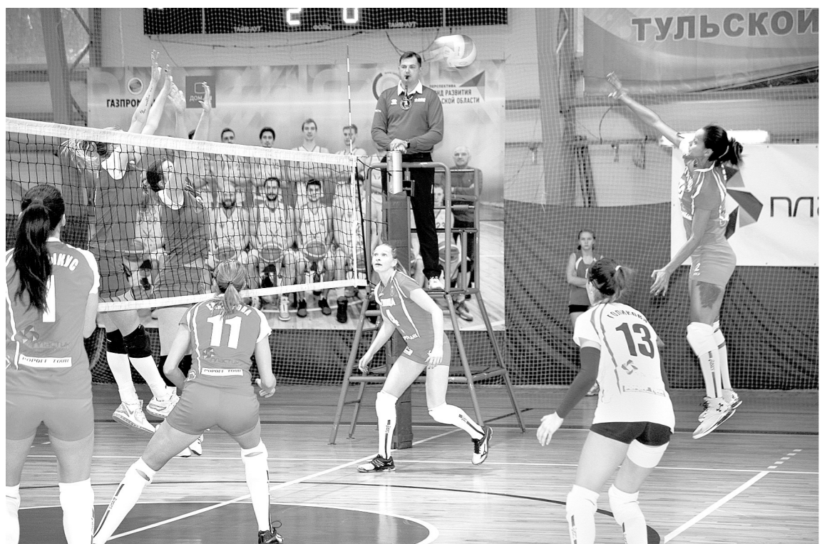
«Тулица» упустила первое место по итогам первого круга в самом последнем матче