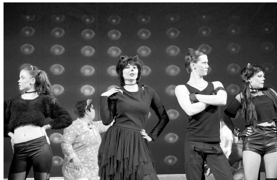
О чем думают кошки