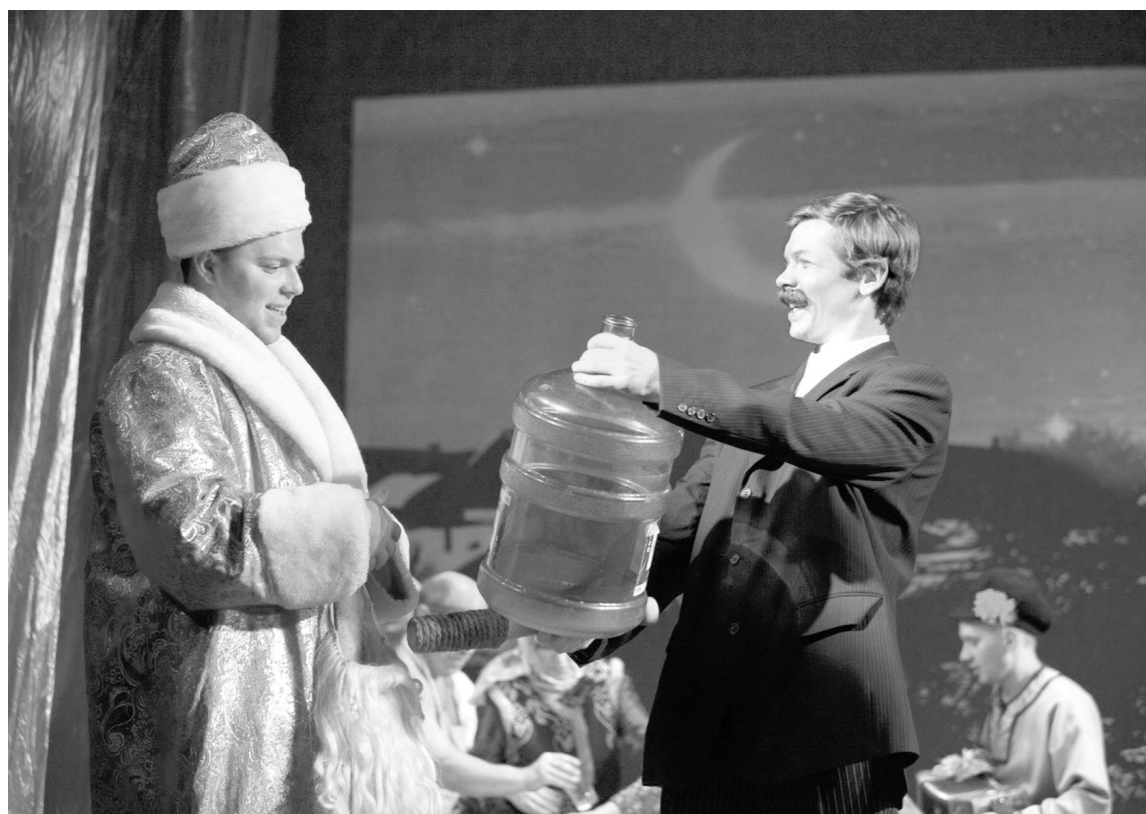
Не только Дед Мороз делал подарки – но и наоборот