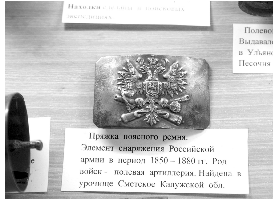
Любопытный экспонат музея – пряжка царского артиллериста

– Хочу для полноты картины добавить к ним еще некое оружие. – Попадают на землю и дореволюционные награды. Например, у деревни Борисово Алексинского района в 2012 году нашли медаль с профилем Николая II. Нередко находим пряжки.