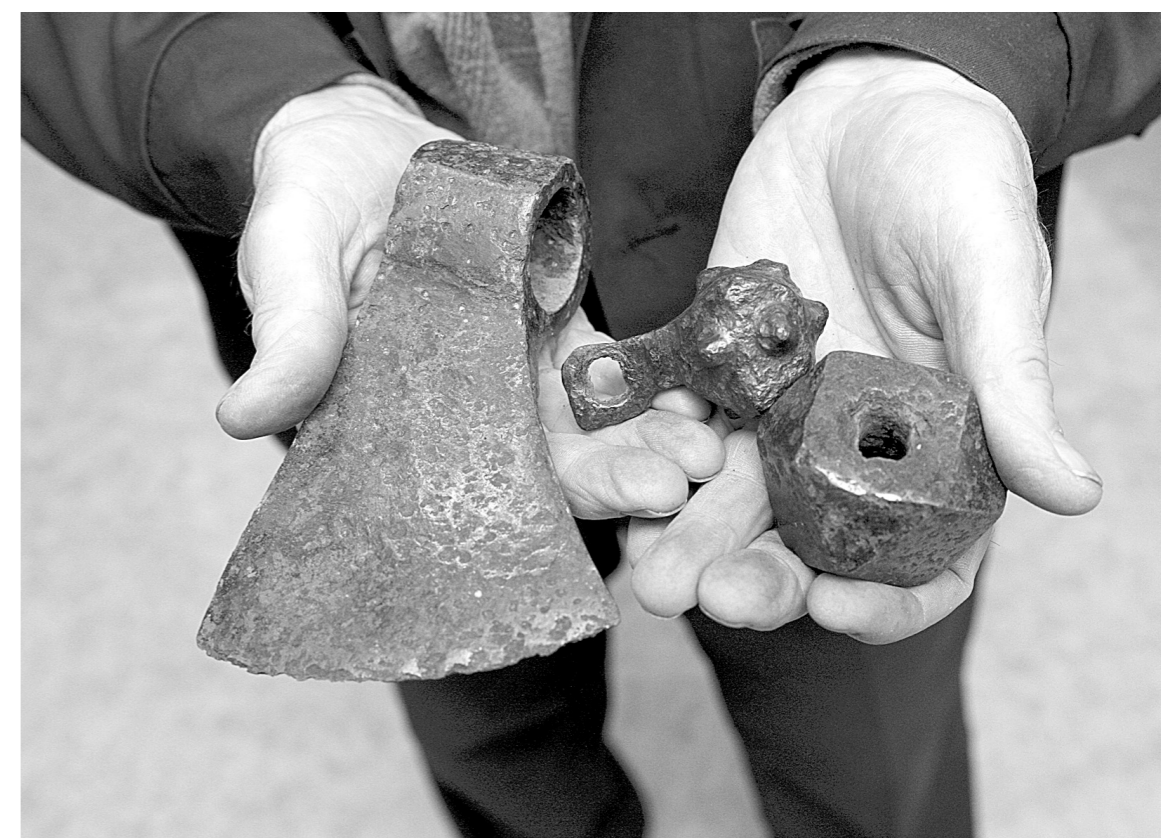
Из земли поисковики извлекли боевой топор, кистень и булаву

Так, в урочище Сметском Калужской области как-то обнаружили пряжку артиллериста, которую носили военнослужащие в XIX веке.