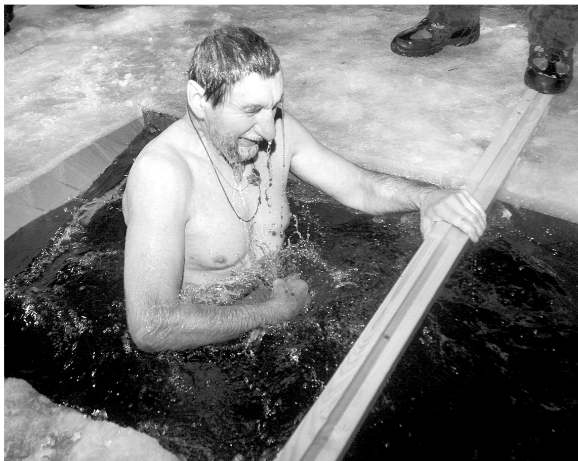
Окунаясь в источник, не стоит забывать о безопасности

Никогда не ныряйте в прорубь вперед головой. Окунайтесь