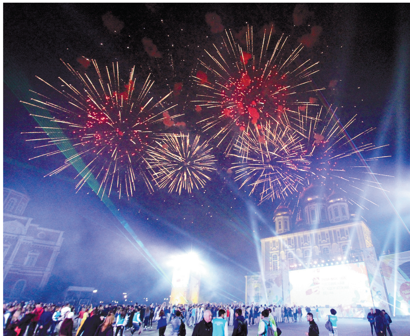
Заключительным аккордом церемонии открытия стал красочный фейерверк