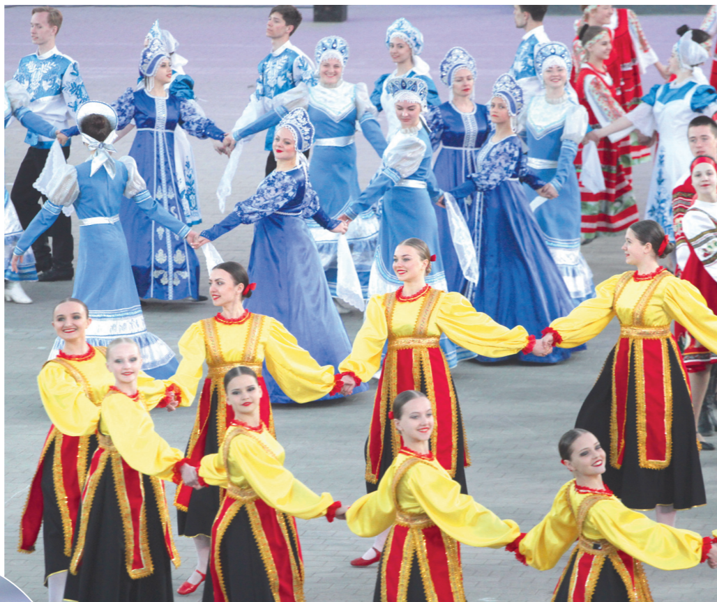
В церемонии открытия приняли участие десятки творческих коллективов из Тулы и области