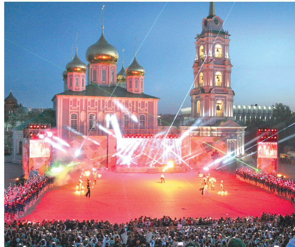
Один из самых зрелищных номеров программы – «зажигательное» файер-шоу