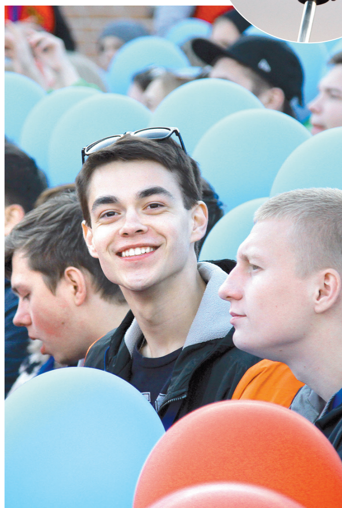
Улыбки не сходили с лиц участников и гостей фестиваля